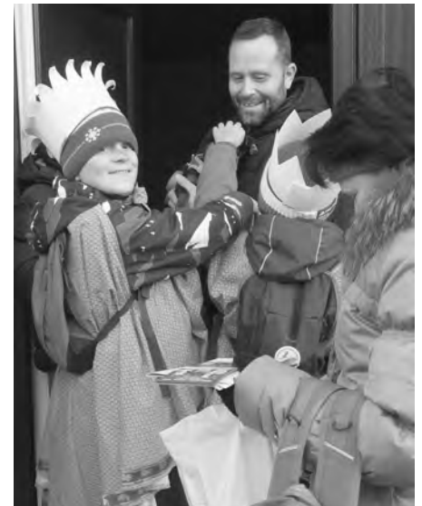
Stačí jedna kačka a je plná pokladnička! Za každíčkou korunu děkujeme! Podarovali jste jich rovných 137.329!

A toto nadšení v letošním roce vyneslo 137.329 Kč , za což všem občanům velmi děkujeme, neboť je to téměř trojnásobek loňského výtěžku. Na závěr kromě velkých díky všem, co se účastní Tříkrálové sbírky, pokud nevíte, co znamená PSP z úvodních slov písně, zeptejte se omladiny, ta to bezpečně vědět bude.