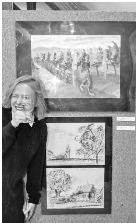
Vernisáže výstav obrazů výtvarníků ze Senice a Velkých Pavlovic se vždy nesou na přátelské vlně a v uvolněné atmosféře.

Výstavu bylo možné navštívit až do 10. ledna 2025. Potěšit se obrazy mohli i účastníci Vá-