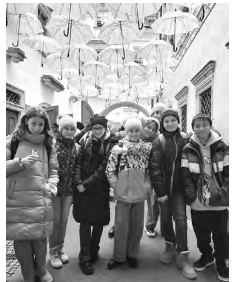
V Brně není nikdy nuda ani pruda. Dokonce ani když zaprší, deštníků všude dost!