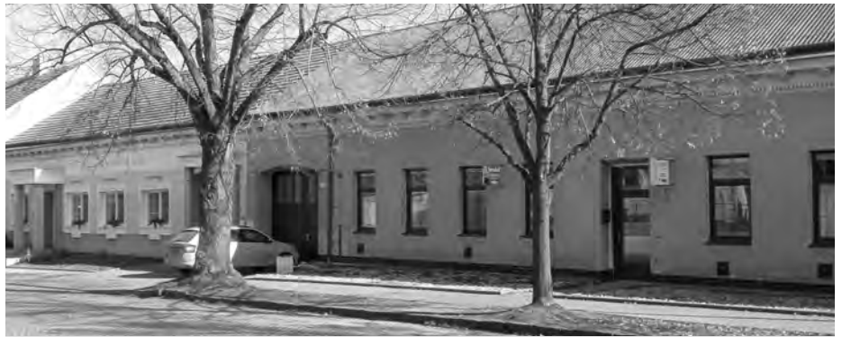
Přímo vedle budovy ZUŠ stojí t.č. nevyužitá budova, kde sídlila Služba školy. Brzy bude přední trakt sloužit žákům sousední školy.

V zimních měsících, tedy v období vegetačního klidu, můžeme naše pracovníky služeb města často potkávat v intravilánu, tedy v nej-