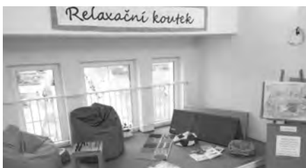
Nový relaxační koutek – skvělé místo pro odpočinek našich dětí.