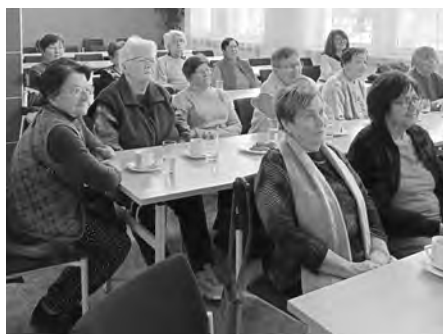
Seniorky si přišly na besedu poslechnout cenné informace, která se dobře starat o svůj sluch.

Seznámily se také s dalšími možnostmi kompenzace sluchových ztrát. První volbou v rám-