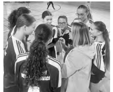
Hráčky třídy kvarta místního gymnázia sprádají strategické plány, nakonec stačily na získání bronzu.