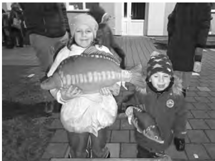
Kapře, kapříku, v zeleném triku, dej mi jednu šupinku, ať mám štěstí trošinku!