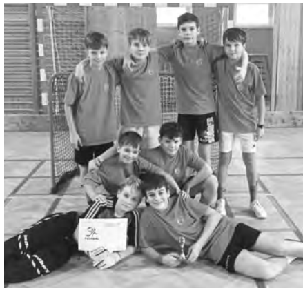
Tým mladších žáků neměl na florbalovém turnaji konkurenci, zasluženě si odnesl zlato.

Mgr. Lukáš Svoboda, Základní škola Velké Pavlovce