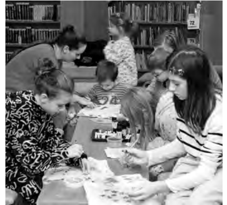
Knihovnice pořádala odpoledne plné vánočního tvoření.

V pátek třináctého jsme uspořádali v prostoru knihovny Předvánoční tvoření pro děti, kde si mohly menší i větší děti dle svojí fantazie vytvořit zimní vločku z barevného písku nebo si kreativně dotvořit vlastní vánoční vzory na pytlíček. Mezitím se vesele razítkovalo na budoucí vánoční papír a poslouchalo audio Vánoce u Spejblů. Ti menší si mohli kromě vánočně laděného razítkobraní namalovat vánoční baňky a ti nejzručnější usedli k výrobě vánočního stromku z vyřazených starých knih. Nakonec došlo i na koledy, čímž se stala atmosféra dokonalou. Děti odcházely s vlast-