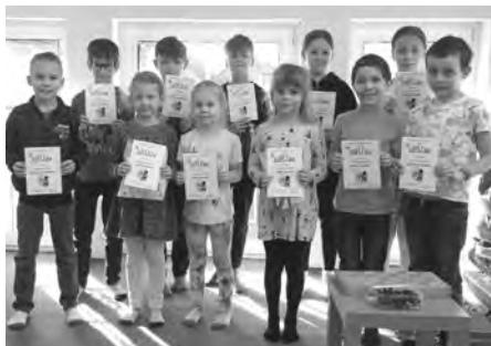
Malí velcí počtáři, už ví, že matematika je pozoruhodná věda.

Díky soutěžím tohoto typu můžeme odhalit matematický talent u našich žáků. Nejúspěšnější řešitelé z jednotlivých ročníků dostali diplom a věcnou odměnu.