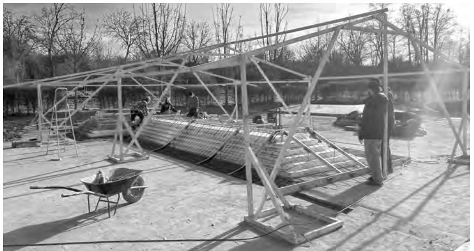
Staronový skatepark. Hlavně děti se těší, až bude vše hotovo. Hlavně bez úrazů!

S drobnými opravami a jednou větší vydržely