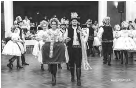
Letos zatančila velkopavlovická chasa českou besedu. Krásná podívaná.

Program tohoto plesu je rok co rok více méně neměnný. Inovace není třeba, osvědčil se. Zahájení bylo tak opět svěřeno nejmladším hodovním harcovníkům, omladině z folklorního souboru Sadováček při Mateřské škole Velké Pavlovice, jež je nadějným příslibem do budoucna, že u nás folkloru jen tak vane nedáme. Děti roztančily a rozezpívaly sál naprosto dokonale. O co menší špunti, o to intenzivnější energie. Svůj entusiasmus jako štafetový kolík předali nadšení caparti právoplatným členům chasy, kteří pak na parketu vkusně