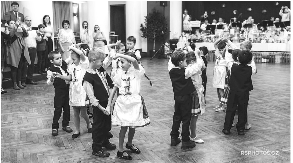
Bez tanečního vystoupení dětí ze Sadováčku by Krojovaný ples nemohl začít.

a tematicky vyzdobené sokolovny předvedli všem přítomným, kterak se tančí beseda, le- tos pojetí české.