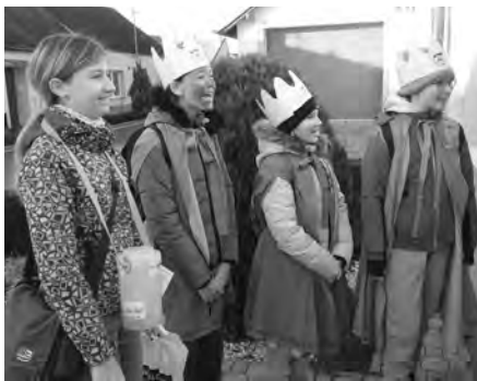
Tříkráloví zpěváci obcházejí domácnosti našeho města a s písničkou na rtu koledují...

Protože se již několik let tohoto „kolotoče“ připrav účastním, tak vám napíši ještě