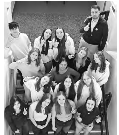
Není nad to, aby nám bylo (nejen) ve škole dobře. Být v pohodě je nejvíce!

Pátek dne 7. února 2025 se nesl na Základní škole Velké Pavlovice ve znamení wellbeingu