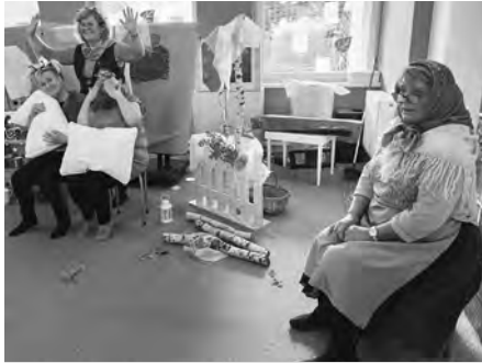
Z paní učitelek herečky. Pro dětičky si připravily představení o včelích medvídcích.

Kolektiv pedagogických pracovníků Mateřské školy Velké Pavlovice