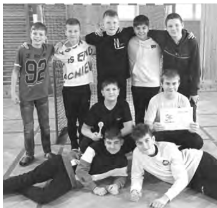
Starší žáci urvali bronz, také oni zvládají florbal na jedničku.