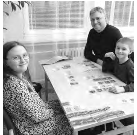
Deskové hry pro děti, pro celé rodiny ale i pro zkušené hráče. Bylo z čeho vybírat.

ním výtvořem, nejen s rukama umazanými od razítkovací barvy a především spokojené.