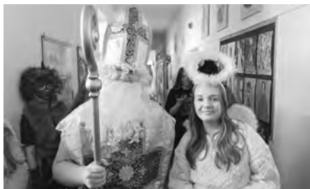
Základní školou prosvištěla mikulášská družina. Strašila pramálo, raději nadělovala.

Pedagogové Základní školy Velké Pavlovice