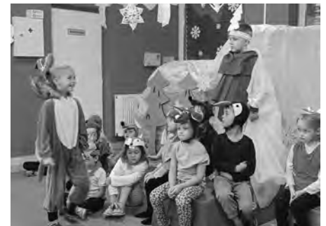
Stromček a zvířátka, toť název divadelního představení, které pro své kamarády sehrály děti z naší mateřinky.

Nacvičily společně divadelní představení a následně jej zahrály před publikem. Hereckými hvězdami se staly děti navštěvující kroužek Hrajeme si s pohádkou. Divadelní zpracování pohádky se tak v naší školce stalo krásným vánočním dárkem a překvapením.