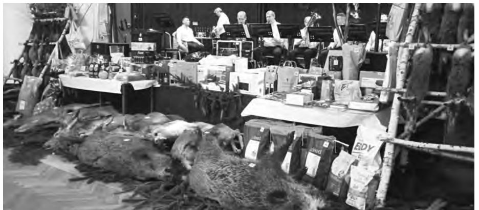
Myslivecký ples je jediná zábava tohoto druhu, odkud si můžete přinést základ na vynikající zvěřinový oběd!