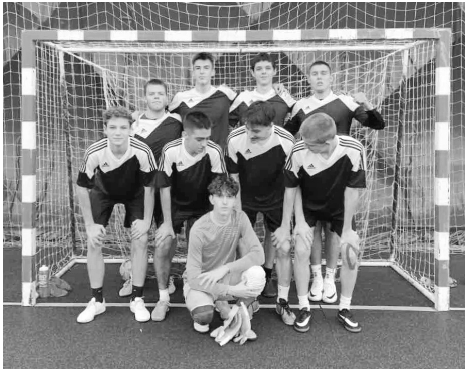
Futsalový tým našeho gymnázia míří výš ve Středoškolské futsalové lize.

Po náročném lyžování jsme se vrátili na chatu, kde nás čekal chutný oběd, což byl vždy