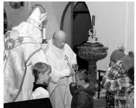
Mikuláš a andělé nadělovali i v kostele.

V kostele si děti mikulášský večer užily, s úsměvem a koledou na rtu, bez stresu, strachu a slz. Byly uvolněné, plné radosti, nadšení a v pohodě. Přesně takový advent bychom jim měli umět dopřát. Tak co, zkusíme to za rok jinak a lépe?