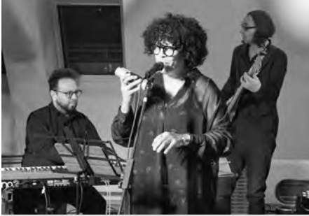
Hudební uskupení DUENDE koncertovalo v duchu charity.

V sobotu 7. prosince 2024 se konal ve výstavním sále Ekocentra Trkmanka již tradiční koncert uskupení DUENDE, který jako již také tradičně uspořádali členové Rotary klubu Valtice – Břeclav. Letošní výsledek této charitativní události ve výši 240.000 Kč bude využit na realizaci projektu Stavební úpravy Domova Narnie, který poskytuje služby dětem s těžkým mentálním a kombinovaným postižením a autismem ve správě Diakonie ČCE – středisko Betlém v Kloboukách u Brna.