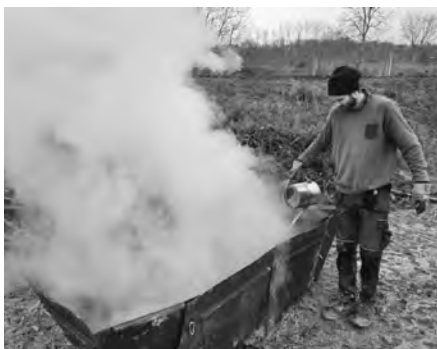
Na workshopu pro vinaře na téma biouhel nechyběla názorná ukázková výroba.

Uhlík v půdě váže živiny a důležité látky, podporuje rozvoj půdních mikroorganismů a má schopnost zadržet vodu. Biouhel je tradiční univerzální prostředek pro zlepšení úrodnosti půdy v rozvojových zemích Afriky nebo Asie, kde v extenzivním zemědělství nahrazuje mi-