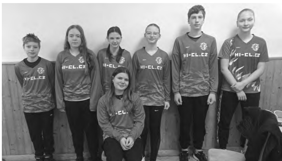
První uzlovačka letošního roku proběhla v Perné a vůbec to pro začátek nedopadlo špatně!

Losování pořadí přisoudilo našemu týmu starších žáků sedmou pozici. Šťastná sedmička pro náš tým bohužel moc šťastná nebyla.