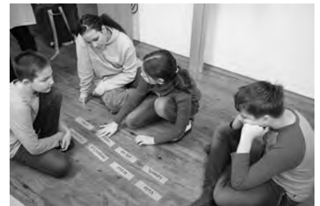
„Vaše krása nespočívá v účesech, šatech, ale ve vašem srdci.“ Kdyby si měly děti z dvouhodinového programu odnést pouze tuto větu, stálo to za to.

Třídní učitelé žáků 6. třídy Základní školy Velké Pavlovice