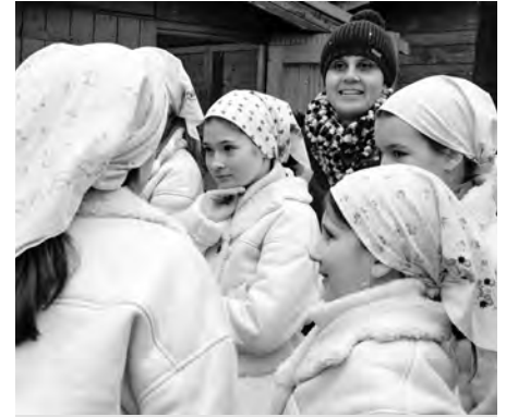
Koledovat na pódium přišla i děvčata z velkopavlovického folklorního souboru Floriánek.

Vánoční jarmark u radnice je každoročně příjemnou, vánoční atmosféru navozující událostí adventu ve Velkých Pavlovicích. Jsme nadšeni, že se nám díky vždy bohaté účasti