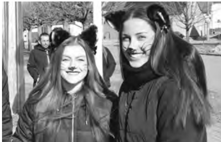
Do průvodu vyrazily i kočky. No uznejte, nejsou tyto holčiny opravdu kočky?

Kromě vína byla připravená i bohatá gastronomická nabídka, která odpovídala ostatkovým tradicím. Návštěvníci mohli ochutnat oblíbené pochoutky jako boží milosti, škvarky, různé pomazánky, polévky, guláše, jitrnice, jelita a další zabijačkové speciality. Skvělé počasí příjemně podtrhlo atmosféru dne. Ranní větrík v průběhu dne utichl a sluneční paprsky provázely celý průvod i degustace v jednotlivých sklepech.