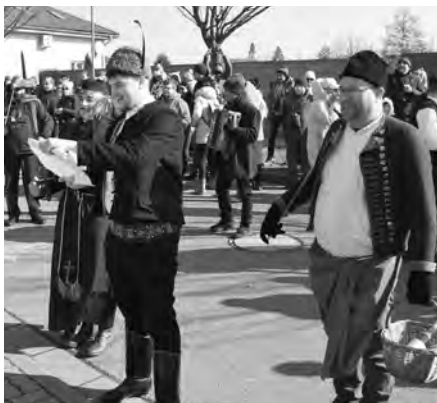
Ostatkový průvod dorazil před radnici, aby zde požádal starostu o povolení. Ten dal svůj souhlas a veselice mohla začít.

Další novinkou bylo oslovení spolku Velko-