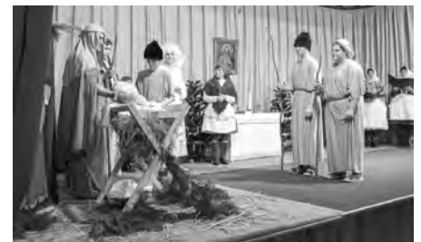
O adventu do města zavítal divadelní spolek Kadet s vánočním příběhem Ukradený betlém .

Na předvánoční kulturní aktivitu letos pozvalo město Velké Pavlovice své občany v brzkém adventním čase. V neděli 8. prosince 2024 do velkopavlovické sokolovny na divadelní představení Ukradený betlém . Divadelní ochotnický spolek Kadet ze Staroviček přivezl hru svého dvorního autora Petra Tomšů, která poněkud netradičním způsobem zpracovává známý betlémský příběh.