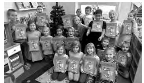
Z našich prvňáčků jsou velcí čtenáři a dostali z rukou pana ředitele svou první opravdovou knihu – Slabikář.