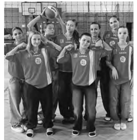
Tým starších žákyň ZŠ získal na adventním turnaji blyštivé stříbro.