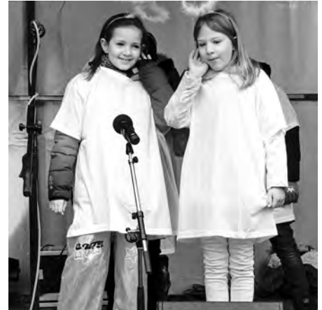
Zpěváčci z mateřinky zpestřili program na Vánočním jarmarku u radnice.

Společně jsme se naučili různé vánoční písně a koledy, provázané básněmi a říkadly, které jsme nejdříve předvedli rodičům na školní akci s názvem Předvánoční odpoledne ve školce.