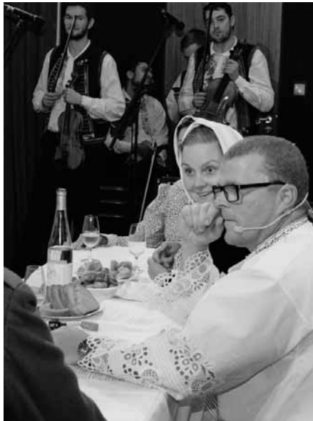
Radní města zasedají... Scénka Zarázení hory se letos mimořádně vydařila.

Ve folklorní sekci měla hlavní slovo cimbálová muzika Lašár a její hosté – verbíři z Hanáckého Slovácka, mladí verbíři a Presúzní sbor. Vystoupil také dětský folklorní krúžek Floriánek.