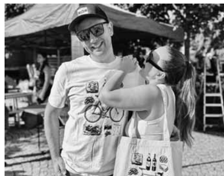
#poznemodrehory stylově! Jedině v modrohorském tričku, s taškou a kšiltovkou.