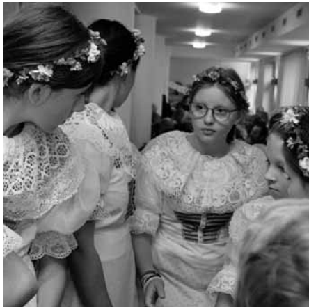
Děti z folklorního krúžku Floriánek tančily a zpívaly jako o život.

Ve folklorní sekci měla hlavní slovo cimbálová muzika Lašár a její hosté – verbíři z Hanáckého Slovácka, mladí verbíři a Presúzní sbor. Vystoupil také dětský folklorní krúžek Floriánek.