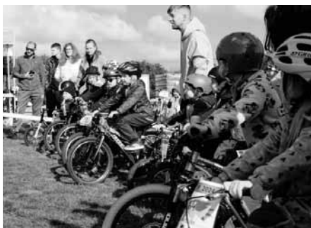
Sport děti baví, však vidíte, kolik se jich postavilo na startovní čáru. A zdaleka to jsou nejsou všechny.

A protože nejen sportem živ je člověk, připraveno bylo také bohaté občerstvení – domácí