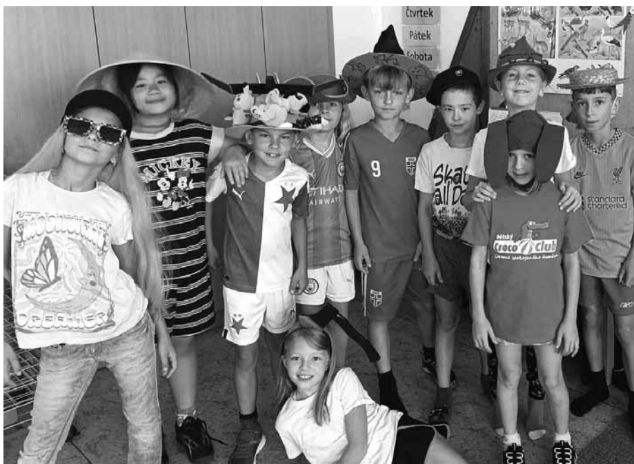
Jsme dostatečně šílení? Pokud ano, dílo se podařilo!