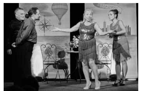
Let muzikálovým světem naše dříve narozené nadchnul. Takové cestování jim přišlo o sychravém podzimním dnu vhod.

Pomocí hudby se senioři mohli přenést do Londýna, Paříže, Maďarska, New Yorku nebo