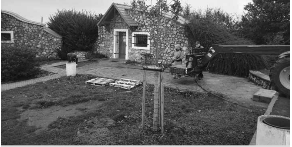
Kioskek pod rozhlednou bude mít nové zastřešené posezení.