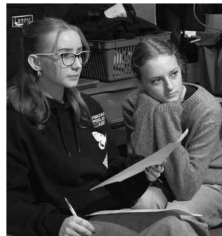
Bádání a odhalování nových informací je disciplína, která studenty skutečně baví.

Ve čtyřech skupinách se natočil podcast o historii kalendářů, zahráli si soutěžní hru z oblasti heraldiky, vyslechli si přednášku o zkoumání rukopisů z 18. až 19. století a v neposlední