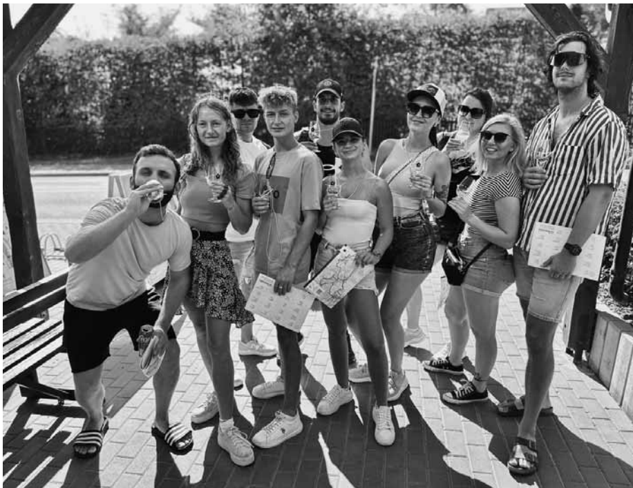
Putování za typicky podzimním nápojem burčákem bylo letos co se počasí týče vyloženě letní!

V rámci oblíbeného popupu Zaperlíme se představila hned dvě velkopavlovická vinařství. Se skvělým marhulovým vinným frízem na ledu zazářilo Vinařství Lacina a vynika-