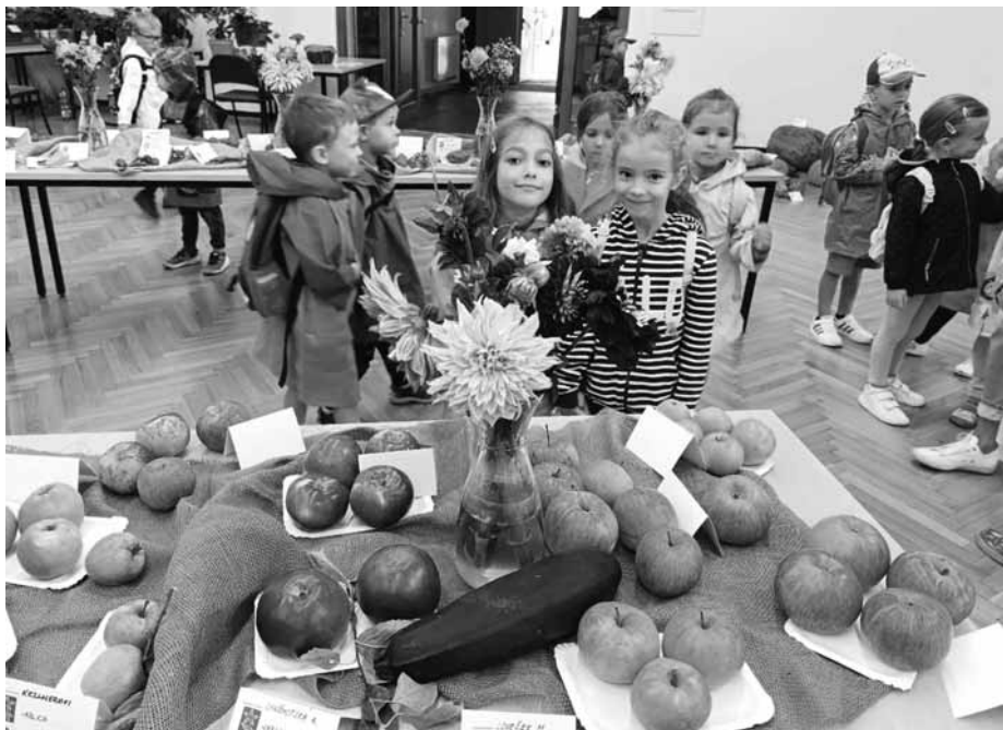
Nejen nádherná jablčka obdivovali předškoláci na zahrádkářské výstavě v Kobylí.

Kolektiv pedagogů Mateřské školy Velké Pavlovice