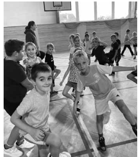
Tělocvik s profíkem? No prostě paráda, změna a hlavně zábava.

Tento přístup umožňuje, aby děti měly možnost pracovat na zlepšení své fyzické kondice pod vedením odborníka. Zapojení trenérky dává hodinám tělesné výchovy nový rozměr, kde se spojuje teoretické pedagogické vzdělání učitelů s praktickými dovednostmi profesionálky ze sportovního prostředí.