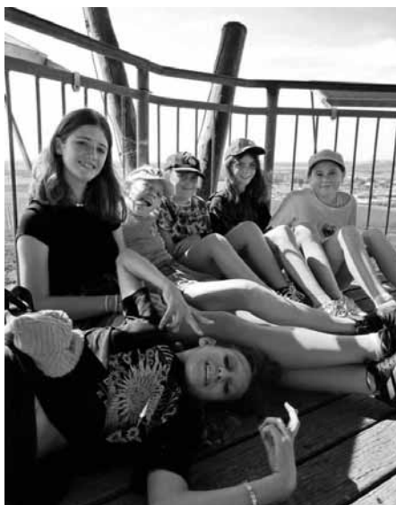
Nová škola, nový kolektiv. Věříme, že z těchto dětí budou dobří kamarádi.

Adaptační program byl záměrně umístěn do Velkých Pavlovic, do působiště nové alma mater primánek a primánů místní školy. S využitím turistické trasy naučné stezky Malá tajemství Velkých Pavlovic, která je v nabídce