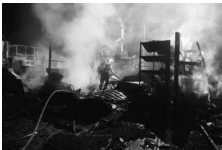
Velkopavlovičtí hasiči zasahují při požáru ubytovny v Šakvicích.

Jsou události, kdy se hasiči vrátí domů do několika desítek minut, ale někdy se příjezd zpět na hasičskou zbrojnici značně protáhne.