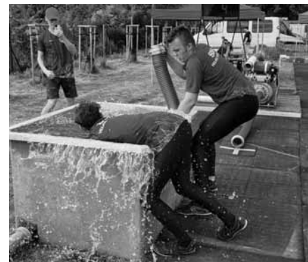
Požární útok je mokrá disciplína, ale s tím jsou hasiči v pohodě!

Sezóna Břeclavské hasičské ligy roku 2024 nám sice skončila, ale to neznamená, že jsme skončili s požárními útoky.