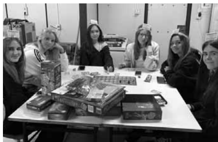
Nejlepší prostředek jak se dobře poznat? Během společných aktivit, třeba formou hraní oblíbených deskovek.

Noví studenti prvního ročníku Gymnázia Velké Pavlovice se od 11. září do 13. září 2024 intenzivně seznamovali. Jako místo k této akci přímo stvořené se ukázal Sportovní areál v Kobylí.