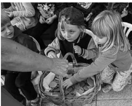
Vinobraní ve školce je akcí netradiční. A tak i občerstvení bylo tak trošku neobvyklé. Voňavé, perníčkové...

Soubor Sadováček při MŠ Velké Pavlovice téměř pravidelně zahajuje svým vystoupením sobotní program. Nejinak to mělo být i letos. Nejen děti, ale i my dospěláci, jsme se na vystoupení moc těšili. To letošní navíc mělo pro ně být i trochu jinak slavnostní. Bylo totiž plánováno, že ti, kteří už jsou v první třídě, ve společném pásmu symbolicky předají štafetu svým mladším kamarádům.