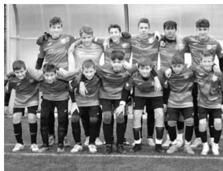
Fotbalisté z 2. stupně naší ZŠ si z Kobylí přivezli radost z druhého místa z fotbalového poháru škol okresu Břeclav.

Ve středu 2. října 2024 se Základní škola Velké Pavlovice zúčastnila okrskového kola fotbalového poháru škol okresu Břeclav, které se konalo na stadionu TJ Sokol Kobylí.