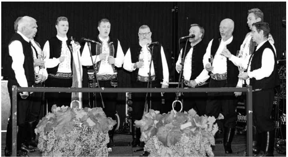
Místní Presúzní sbor nemůže na slavnostech vinobraní chybět.

Velkou podporu jsem měl v TONSTUDIU Rajchman. Ve čtvrtek večer bylo dohodnuto, že se budou připravovat obě varianty. Vnitřní i venkovní. V případě menšího deště bylo tedy možné přesunout program ze sokolovny ven.