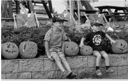
Přehlídka dýní a také dětské kreativity.

Děti si i přes velké nesnáze organizátorů způsobené velkým větrem užily kromě vyřezávání i všechny připravené aktivity. Jak ty tvořivé, které byly z důvodu větru zatíženy vším možným i nemožným, tak ty pohybové. Největší úspěch mělo jako obvykle florbalové a lukostřelecké stanoviště.