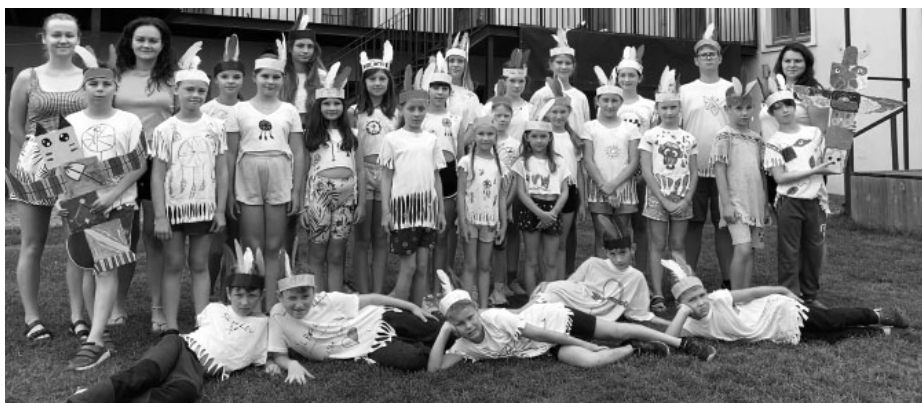
Malí táborníci si na ekocentru užili úžasné indiánské léto!

Program byl pro děti z mateřských a základních škol různorodý: táborníci vyráběli indiánské členky a mluvicí hůlky a totemy, vytvořili si krásná indiánská trička a prošli si naučné indiánské stezky, kde hledali velkonáčelník nebo poklad. Z organizačních důvodů složité přepravy byla bohužel zrealizována pouze jedna výprava za kakaovým bobem do Čokoládovny Herůfkovi na Čejči. Ale o nejrůznější atraktivitu u nás není nouze, a tak nechyběla třeba cesta na rozhlednu Slunečná