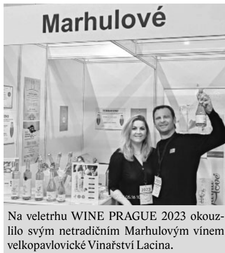
Na veletrhu WINE PRAGUE 2023 okouzlo svým netradičním Marhulovým vínem velkopavlovické Vinařství Lacina.

V prezentačním stánku se návštěvníci do hloubky dozvěděli vše o vínech v apelačním systému VOC Modré hory, ale i o pohostiněm srdci Moravy se skvělými turistickými cíli Modrých Hor, jako zrozenými pro výletování a ochutnávání. Lákavé pro návštěvníky modrohorského stánku bylo i last minute pozvání na následující víkendovou květnovou ryze terroir soutěžní přehlídku vín Modrohorská pecka 2023.