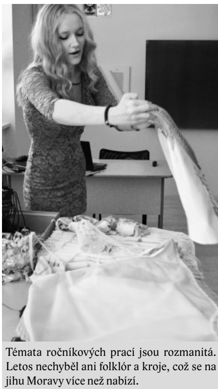
Témata ročníkových prací jsou rozmanitá. Letos nechyběl ani folklór a kroje, což se na jihu Moravy více než nabízí.

Studenti zpracovali témata z různých oblastí přírodních a technických nebo humanitních věd. Některá témata byla zaměřená na poruchy osobnosti, stres, použití zakázaných látek ve sportu, na návykové látky na vývoj plodu,