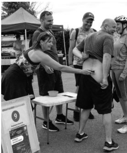
Na Expedici krajem André je vždy veselo!

Účastníci expedice si mohli vybrat, jakým způsobem se budou pohybovat a jakou trasu zvolí. Možnosti byly hned tři. Dvě byly určeny pro jízdní kola, jedna pro pěší turistiku. Nejdelší cykloturistická trasa čítala 42 kilometrů a vedla Hustopečemi, Kurdějovem, Horními Bojanovicemi, Němčičkami, Kobylím, Vrbicí, Bořeticemi, Velkými Pavlovicemi a Starovič-