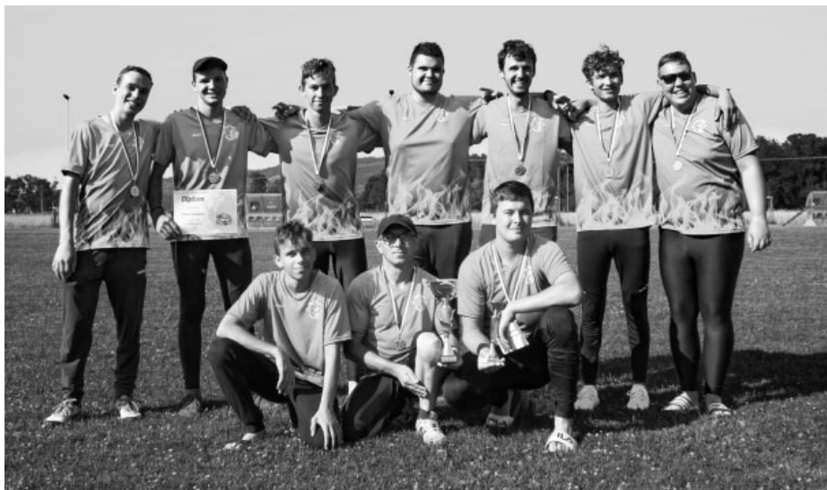
Tak toto je radost v přímém přenosu – velkopavlovičtí hasiči skončili na krajské soutěži v požárním útoku druzí. Ano, druzí! Blahopřejeme!

No a aby toho ale nebylo málo, v sobotu se konala ještě noční soutěž v požárním útoku. A co bychom byli za hasiče, kdybychom na soutěž nešli a oslavovali 2. místo na kraji jen doma