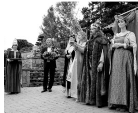
Toskánské odpoledne bylo letos vskutku nevšední událostí a podívanou. Potkat jste se zde mohli s postavami jako z pohádky či historického filmu.