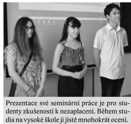
Prezentace své seminární práce je pro studenty zkušeností k nezaplacení. Během studia na vysoké škole ji jistě mnohokrát ocení.

ale také na lidové tradice a zvyky v obcích, nebo například na významné osobnosti obce z trvalého bydliště studenta.