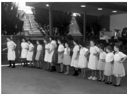
Na festivalu Dechovka pod Pálavou vystoupila pouze dívčí část Floriánku. Hoši verbovali ve Strážnici.

Floriánci si připravili dvě vystoupení, nejdříve zatančili část Moravské besedy a v další části programu vystoupili s pásmem Čerešničky – Išla Marína. Vystoupení musela zvládnout