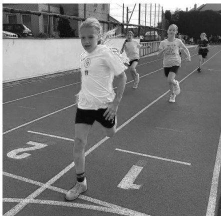
Plnou parou vpřed! V ideálním případě na nejvyšší stupínek bedny! Dle olympijského hesla „Rychleji, výše, silněji“.

Akce se zúčastnili nejen závodníci, učitelé, ale i žáci z 8. tříd a rodiče, kteří fandili a povzbu-