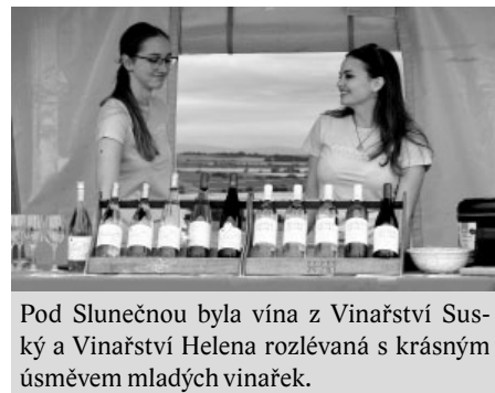
Pod Slunečnou byla vína z Vinařství Suský a Vinařství Helena rozlévaná s krásným úsměvem mladých vinařek.

kami, s cílem opět v Hustopečích. Kratší cykloturistická trasa čítala o 12 kilometrů méně, tedy 30, cestou jste tak minuli Kobylí a Vrbicí. Nejkratší 14 km trasa byla pěší trasou Husto-