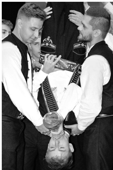
Typická scéna ze Zahrávek – volba stárků.

Kromě taneční zábavy s dechovou hudbou Lácaranka proběhla i oficiální volba stárků, sklepníků a kárníků. Velkopavlovická chasa děkuje všem návštěvníkům Zahrávek za podporu a účast.