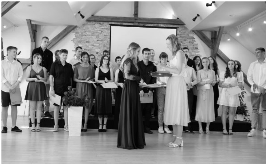
Žáci třídy 9. A se loučí s učiteli a kamarády ze základní školy. Nyní se rozletí do světa. Kéž se jim daří a jsou šťastní!

Do starých kolejí se vše vrátilo až v osmé třídě. To jsme si však už říkali, abychom konečně byli devátáci, i když jsme zatím vůbec netušili, co všechno přijde. Kromě vybírání třídní mikiny nebo pořádání školní diskotéky, což nebylo vůbec snadné, ale obojí se podařilo,