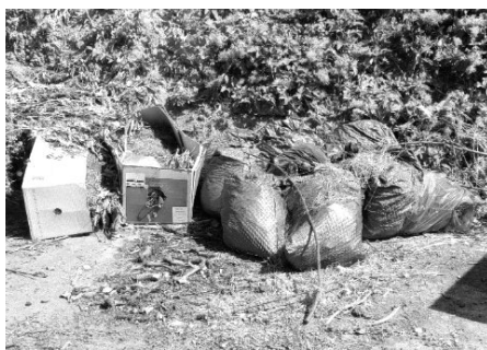
Příště znovu a lépe! Opravdu věříte tomu, že si příroda s igelitem a tvrdou papírovou krabicí jen tak poradí?

Je to tak jednoduché a prosté – bioodpad patří na místo tomu určené (na označené sběrné místo na zkratce), papír a plast do tříděného odpadu, který každé dva týdny odváží od domů pracovníci služeb města.