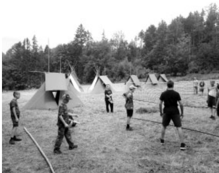
Jedním z bodů programu letošní vlčí expedice byl turnaj v ringu.

Hned po sněmovním víkendy odjíždíme na tři dny do Jeseníků. Zde jsme si pronajali od Arcibiskupských lesů Olomouc útulnou Medvědí chatu. Je umístěná mimo civilizaci v lese, bez elektřiny a vody, no prostě romantika pro trempy. Po příchodu na chatu hned vyrážíme