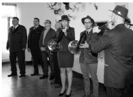
Vernisáž ozvláštnili trubači z Lesnické a dřevařské fakulty Mendelovy univerzity Brno.