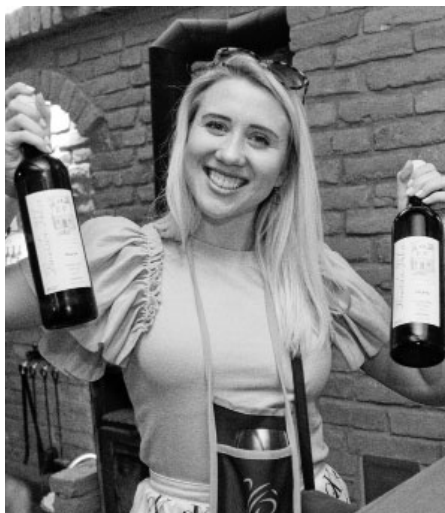
Tak co si dáme? Červené, bílé nebo dokonce oranžové?

znamu akce. My místní chápeme, že začátkem července většinou dozrávají naše oranžové Velkopavlovické meruňky, ale již méně lidí ví, že v našem kraji se dříve hojně pěstovala světlice barviřská označovaná jako „turecký šafrán“, která začátkem července kvete právě výraznou oranžovou barvou. Tato jednoletá