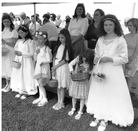
Farníci si připomněli mši svatou pod širým nebem svátek Božího Těla.

V neděli 11. června, na svátek Těla a Krve Páně, byla v devět hodin ráno sloužena na dvoře fary mše svatá. Věřící z Velkých Pavlovic, Němčiček a Horních Bojanovic se po bohoslužbě vydali průvodem do velkopavlovického kostela Nanebevzetí Panny Marie k uložení monstrance.