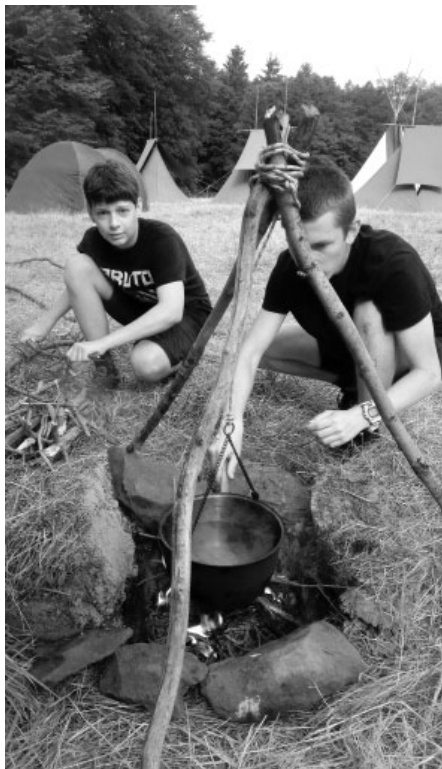
Guláš je nikdy neurážející dobrota. Ale kotlíkový guláš, to je delikatesa! Od našich Vlků dvojnásobná.

V polovině táboření se koná tradiční Sněm kmene s volbou nového náčelnictva, příznávaním Orlich per za vykonané činy dle Svitku březové kůry a povyšování do vyšších titulů lesní moudrosti. Letos byl udělen hned čtyřikrát titul Stopař. Také došlo na přijímání nových členů do kmene Vlků. Sněmu se zúčastnilo padesát Vlků a rodičů mladších členů, přišel i majitel louky se svým ukulele a potěšil nás spoustou písniček klasických trempsých