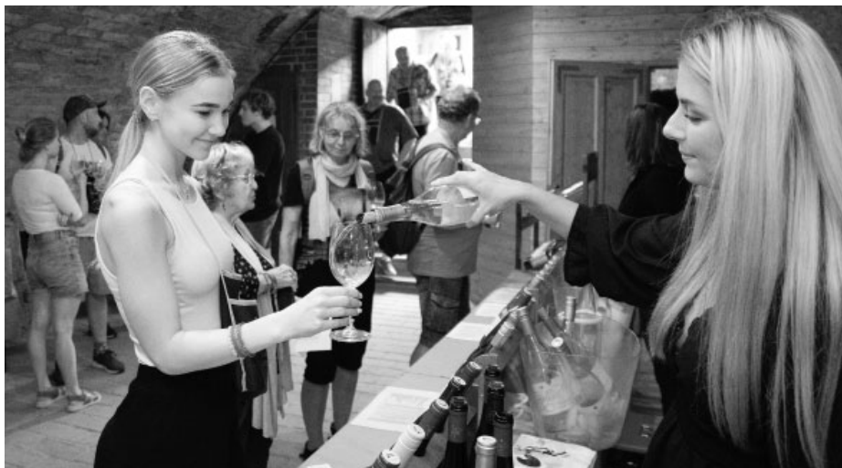
Svěží vína, krásné ženy – to je léto a Víno v oranžovém ve Velkých Pavlovicích!

znamu akce. My místní chápeme, že začátkem července většinou dozrávají naše oranžové Velkopavlovické meruňky, ale již méně lidí ví, že v našem kraji se dříve hojně pěstovala světlice barviřská označovaná jako „turecký šafrán“, která začátkem července kvete právě výraznou oranžovou barvou. Tato jednoletá