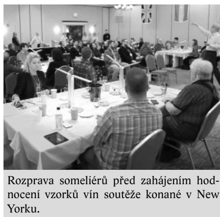
Rozprava someliérů před zahájením hodnocení vzorků vín soutěže konané v New Yorku.