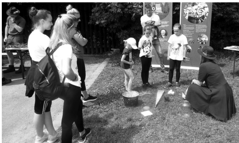
V rámci Mysliveckého dne se uskutečnila již tradiční osvětová a zároveň dobrodružná akce pro děti Po stopách pytláka Floriána, putování se soutěžemi.

S příjemně zaplněným žaludkem pak hravě vydržely sledovat další program. Tím byly ukázky výcviku loveckých psů. Představení byli nejen ohaři a barváři, ale děti byly nadšené z labradorů, se kterými jim manželé Suští ukázali nejen výcvik aportování, ale i dog dancing a canisterapii. Sokolník s orlem a střelba