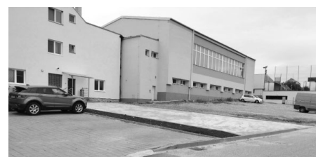
Stání pro automobily na místě bývalé budovy kina u pošty.

Práce probíhají i v mateřské škole. V suterénu budovy je prováděna výměna elektroinstalace a také výměna kotlů zajišťujících vytápění budovy a plynového ohříváče vody.