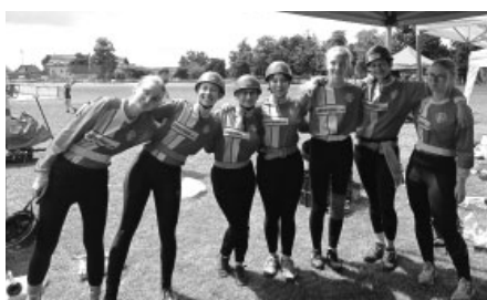
I bramborová medaile zachutnala našim ženám sladce. Čtvrté místo z teprve druhé soutěže je přeci úžasné, no ne?

Po soutěži následoval rychlý úprk zpět do Vel-