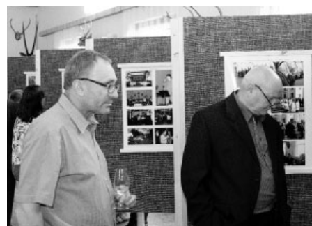
Zájem o výstavu fotografií předčil i ta neoptimističtější očekávání pořadatelů.

Všem, kteří se na přípravě vernisáže podíleli patří velké poděkování a uznání za skvělou práci. Poděkování za přípravu výborného občerstvení patří rodině Krejčířikové a rodině Konečné.