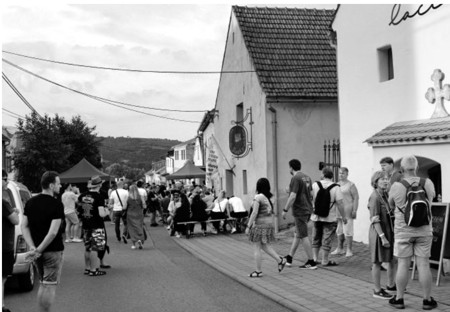
Návštěvnost letních otevřených sklepů je prý nižší... Zrovna tato fotografie mluví spíše o opaku.

Noční otevřené sklepy se vyznačují především jedinečnou atmosférou podvečera proměňující se ve vlahou letní noc. Nejinak tomu bylo i letos, kdy nám počasí přálo a víno si všichni mohli vychutnat i při venkovním posezení na dvoře nebo před sklepem. Pozitivem této akce je i mírně nižší návštěvnost, kdy se téměř vůbec nikde netvoří tlačenice a každý si tak může v klidu vychutnat pro něj to pravé víno a letní noční atmosféru. Vinaři se také snažili nabídnout zákazníkům produkty ušité na míru letní noci v podobě osvěžujících a čím dál oblíbenějších frizzante, tedy lehce perlivých vín, jako alternativa dominujícímu italskému