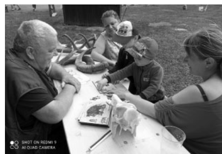
Děti se přišly na Myslivecký den nejen podívat, ale také si pohrát. Mohly si třeba poskládat puzzle se zvířátky z lesa.

Myslivci Velké Pavlovice tímto děkují sponzorům, všem, kteří se na Mysliveckém dnu podíleli, kuchařkám a kuchařům za jejich obětavou práci v kuchyni, ale i návštěvníkům za to, že přišli a svou účastí přispěli k úspěchu celého dne.