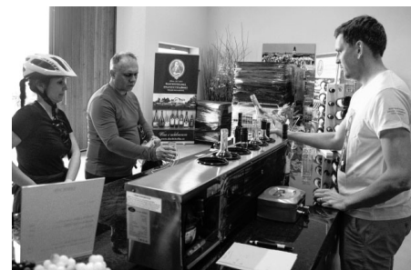
Šlechtitelka nabídla z odrůdy André tradiční červené, ale i růžové a frizzanté.

Další významnou zastávkou ve Velkých Pavlovicích byl turistický areál Nad Zahradami pod rozhlednou Slunečná. Zde si pro své návštěvníky Vinařství Suský a Vinařství Helena připravila bohaté, nejen vinné občerstvení. Víno, podávané krásnými mladými vinařkami, teklo proudem, hlad byl ukojen v tamním