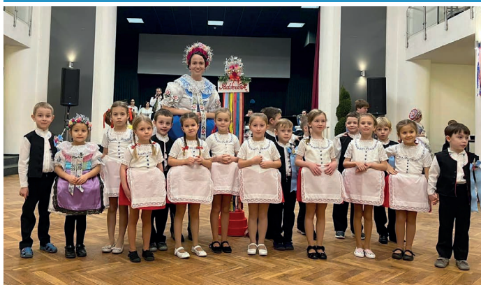
Krojovaný ples roku 2023, bez předtančení z repertoáru dětského folklorního souboru Sadováček by se rozhodně neobešel