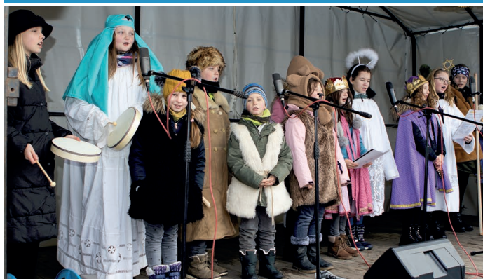
Vánoční jarmark u radnice je vždy příležitostí pro krásná vystoupení našich dětí