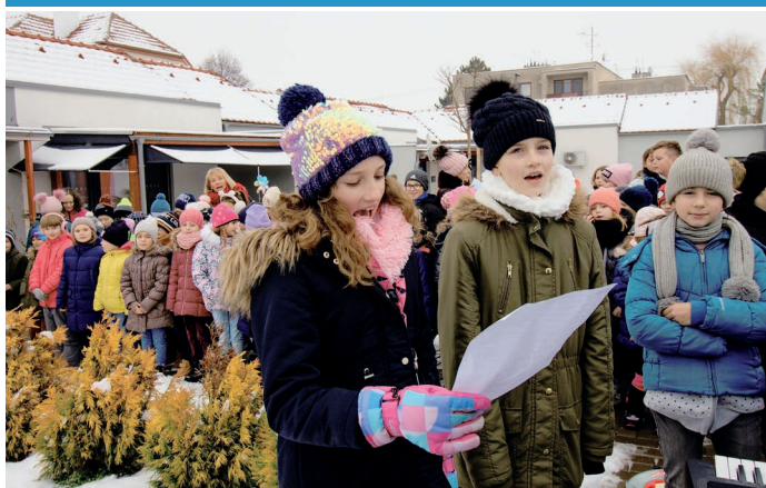
Vánoční zpívání seniorům s finanční podporou z projektu KomUNIta na nádvoří bytů pro seniory na ulici Brí Mrštíků