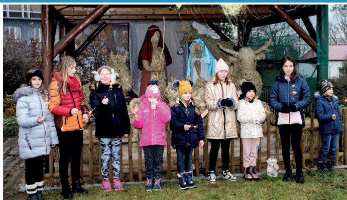
Premiéra – v naučné zahradě Ekocentra Trkmanka byl vystaven betlém ze slámy v životní velikosti, úžasná podívaná