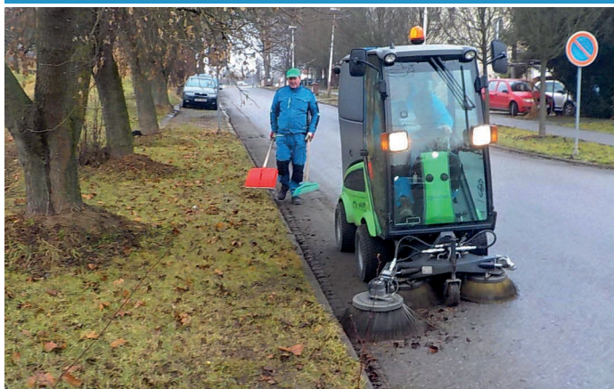
Ulice Brí Mrštíků – úklid vozovky odmetacím vozítkem