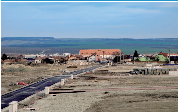
Areál bývalého zemědělského družstva – budování komunikací a chodníků