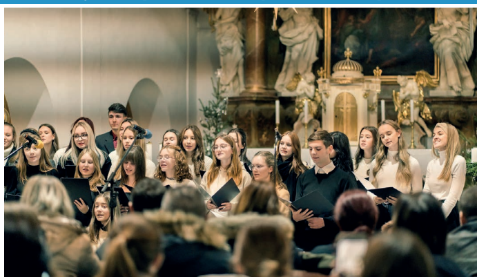
Vánoční ladění..., studenti místního gymnázia opět uspořádali v kostele vánoční koncert