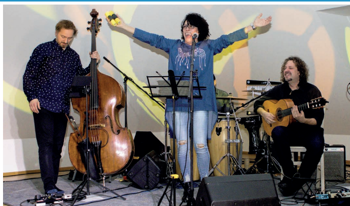
Předvánoční čas na Ekocentru Trkmanka každoročně vyplní už tradiční charitativní koncert hudebního uskupení DUENDE