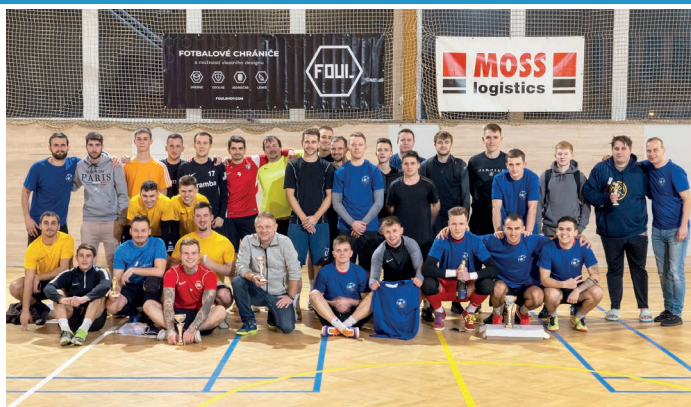
„Na Štěpána není pána“, avšak Štěpánského turnaje v malé kopané vždycky, rok 2022 nebyl výjimkou