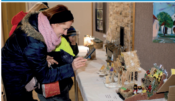
V rámci Vánočního jarmarku proběhla na radnici soutěžní výstava betlémů, které vytvořili děti i dospělí z našeho města