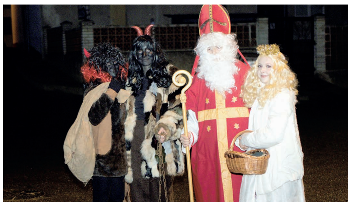
Mikuláš, anděl a samozřejmě banda umouněných čertů, bez této družiny si večer pátého dne měsíce prosince nelze ani představit