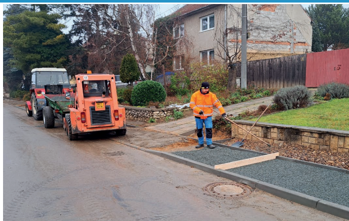
Ulice Starohorská – oprava chodníků