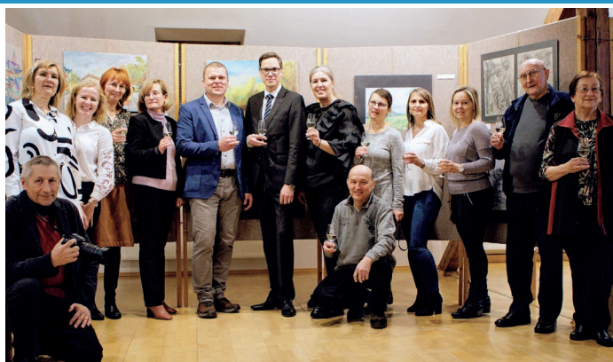
Velkopavlovický podkrovní sál byl svědkem vernisáže výstavy obrazů Plenér 2022 s tématikou Návraty do Velkých Pavlovic