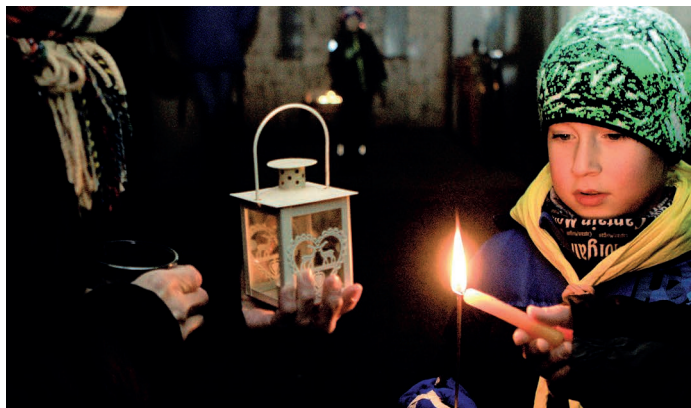
Velkopavlovická fara byla místem, kam si mohl každý přijít za Skauty pro Betlémské světlo