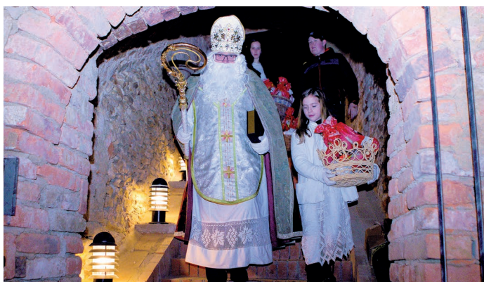
Advent, nebyl by úplný bez mikulášské nadílky a ta proběhla i na samotné faře