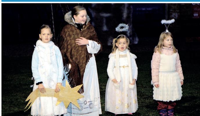
O vánočních svátcích ožil dvůr velkopavlovické fary dětským divadelním ztvárněním příběhu o narození Ježíše Krista