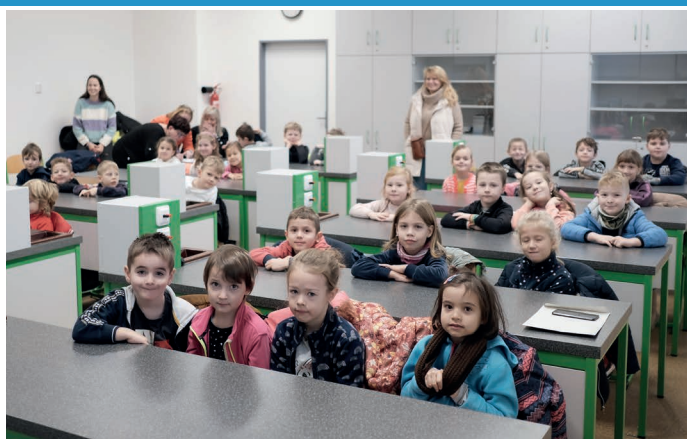
Základní školu v rámci projektu Modernizace infrastruktury ZŠ Velké Pavlovice navštívily děti z místní mateřinky