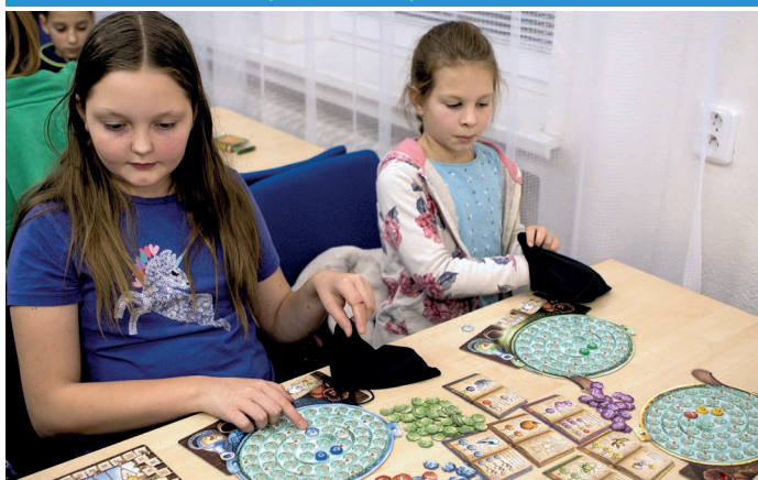
Městská knihovna a nadšení deskohráči uspořádali v zasedací místnosti na radnici akci Deskové hry pro zimní dny