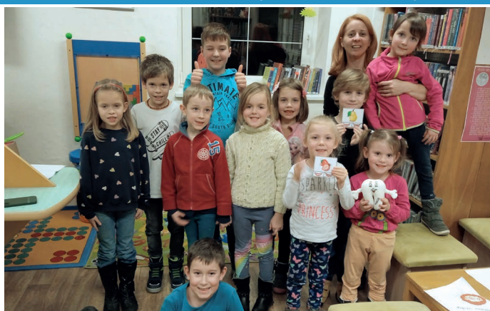
Setkání dětského čtenářského klubíku RaČte s dětmi knihovně s knihou Velké čištění zubů v ZOO