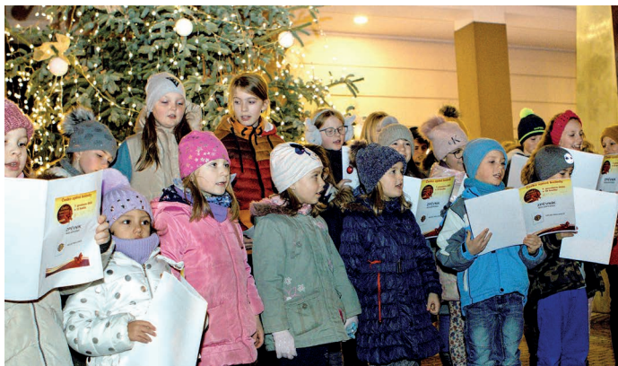
Celostátní akce Česko zpívá koledy 2022 zpříjemnila adventní čas