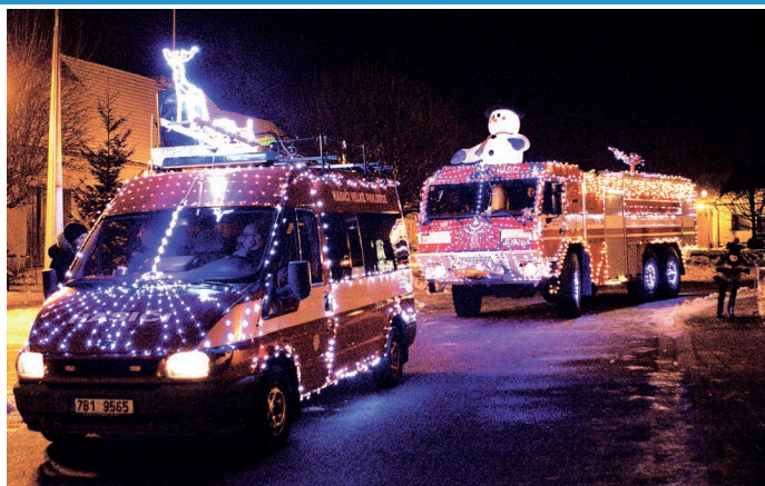
Hasiči uspořádali v rámci Vánočního jarmarku u radnice tradiční adventní krasojízdu městem