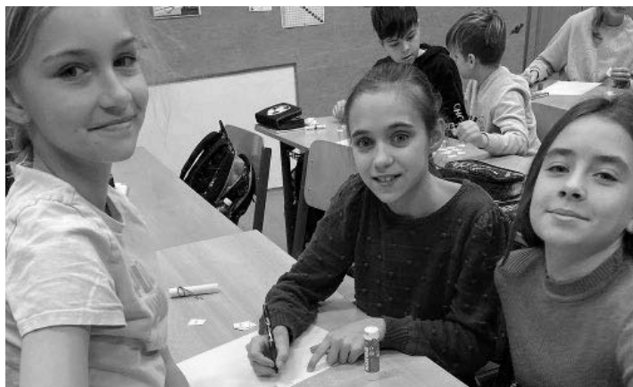
Hrátky se slůvky a rýmy, které děti splétaly do svižné a rytmicky znějících říkadel a básniček, zaujaly.