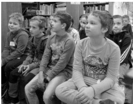
Žáci čtvrtých tříd se ocitli ve světě Ronji, dcery loupežníka.

Jak už je u nás v knihovně zvykem, nenechali jsme děti jen pasivně sedět a poslouchat, byť zajímavé věci o autorce a knihách, anebo úryvky z knihy. Pěkně jsme je i zvedli ze židlí, aby si nacvičily loupežnická gesta a poté se rozdělily do dvou loupežnických band, kde to začalo od vzájemné nevráživosti a došlo až po sprátelení dvojic. Tedy přesně jako v linii příběhu.