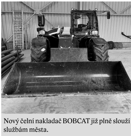
Nový čelní nakladač BOBCAT již plně slouží službám města.

Technické vybavení Služeb města Velké Pavlovice je bohatší o čelní nakladač BOBCAT, který zefektivní práci při výstavbě a údržbě města. Nakladač dodala vysoutěžená firma GRONTECH-AGRO s.r.o., Hodonín za 2.901.822 Kč včetně DPH.