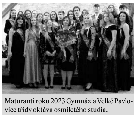
Maturanti roku 2023 Gymnázia Velké Pavlovice třídy oktáva osmiletého studia.

Okamžik, kdy připíná třídní učitel studentovi na klopku saka či na okraj výstříhu svěžích dívčích šatů stužku se slůvkem „Maturant 2023“ a nezbytným mottem, se nezřídka stává jedním z těch, který se nesmazatelným písmem zapíše do paměti každého z nás. Je to chvíle přelomová, je to pomyslný most mezi dětstvím a dospělostí, mezi bohémským studentským životem a zodpovědností. Rozverně mládí je najednou postaveno před první obrovskou životní výzvu – je nyní skutečně a plně zodpovědně samo za sebe. Zkouška z vědomostí středoškolského studenta, zkouška vytrvalosti, přístupu, systematičnosti, pevné vůle to je maturita – zkouška dospělosti.