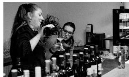
Vinařství Buchtovi uspořádalo premiérový Svatomartinský večer s cimbálem. Mladá vína, nutno podotknout, že nejen ta, tekla proudem!

Věříme, že všichni milovníci vína, kteří mezi nás na Svatomartinský večer ve Vinařství Buchtovi přišli a vydrželi do brzkých ranních hodin, byli ráno odpočatí a svěží a vydali se bez ztráty kytičky vstříc Svatomartinským otevřeným sklepům roku 2022, pořádaných velko-