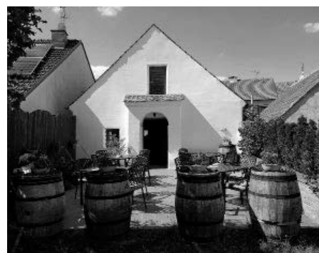
Historický habánský sklep rodiny Lacinovy na ulici V Údolí, jak ho neznáme – z vyvýšené terasy ve dvorku.