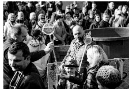
Svatomartinské otevřené sklepy roku 2022 byly dle tradice zahájeny na náměstí u radnice. Nechyběl přípitek mladým vínem, sv. Martin, husa a ani tolik oblíbená krasojízda zemědělské techniky.

Všem zúčastněným děkujeme za návštěvu a projevenou důvěru v naše vína a celoroční práci. Moc si Vaší přízně vážíme a těšíme se