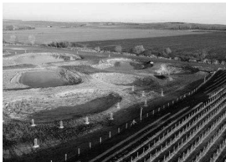
Nové vodní plochy na Záblatské jsou již zkolaudovány.

Celá akce byla spolufinancována dotačními prostředky. V případě výstavby vodní nádrže činí náklady 12.907.971,98 Kč, z toho dotační prostředky z programu Podpora opatření na drobných vodních tocích a malých vodních nádržích - 2. etapa ve výši 8.708.000 Kč (vyčerpáno ale pouze 8.645.865,34 Kč z důvodu změny podmínek).