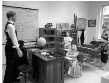
Rádi byste se na chvíli vrátili do dětství, do školních lavic? Navštivte muzeum obce Vrbice.