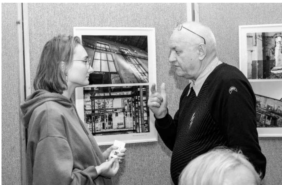
Diskuse vystavujících fotografů nad snímky svými i kolegů, fotografů amatérů, jejich díla ve valné většině případů dosahují profesionální kvality.