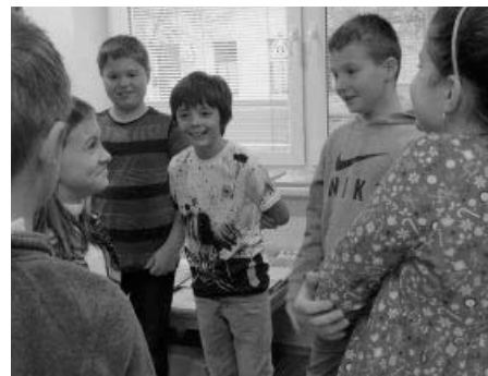
Během besedy v knihovně si děti vyzkoušely i loupežnická gesta.

V rámci hledání pokladu si děti z obou band provětraly i své znalosti ohledně hledání knih podle autorů v knihovně a našly díky tomu části mapy. A i tentokrát oběma třídám ve-