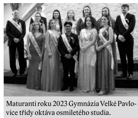
Maturanti roku 2023 Gymnázia Velké Pavlovice třídy oktáva osmiletého studia.