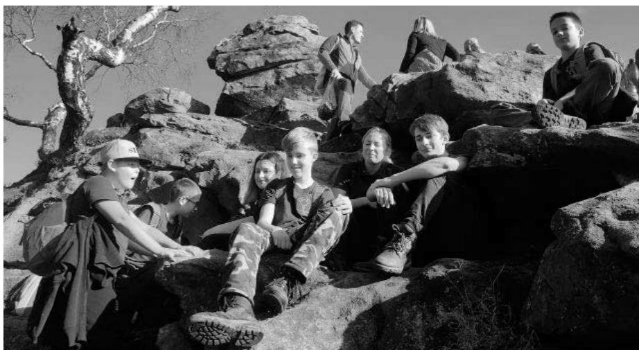
Žďárské vrchy jsou bohatě posety roztodivnými skalními útvary s nejvyšším vrcholem Devět skal. Ani ten neunikl naší poznávací výpravě.