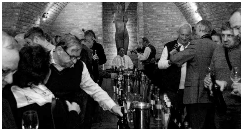
Vína ročníku 2022 mají co do kvality dobře nakročeno. Přítomní se ve svém hodnocení předháněli v superlativech.

ké Pavlovice. K příjemné náladě opět skvěle hrála cimbálová muzika Vinica.