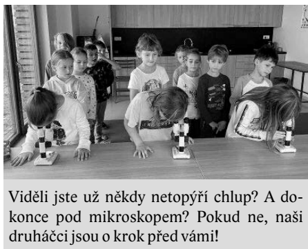
Viděli jste už někdy netopýří chlup? A dokonce pod mikroskopem? Pokud ne, naši druháci jsou o krok před vámi!