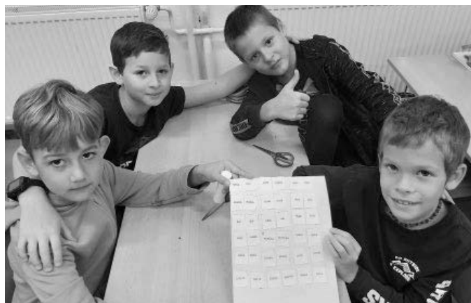
Básnička? To je přece jednička!

Festival „Den poezie“ se koná napříč celou republikou na počest narození Karla Hynka Máchy od 7. do 20. listopadu. Proto jsme se zapojili i my na 1. stupni, a to 16. listopadu 2022 projektovým dnem.