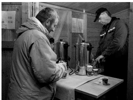
Lampionový průvod v režii našich hasičů bez lahodného svařáčku? Nemyslitelné!

Když se v roce 2012 poprvé po letech konal lampionový průvod, rozhodně organizátoři netušili, že stojí u zrodu nové a do budoucna velmi oblíbené tradice, která z pohodlí domova vytáhne s nadšenými dětmi i rodiče a prarodiče. A vůbec všechny, kteří se chtějí dobře pobavit, setkat se s přáteli a známými, sousedy, zažít něco neobvyklého a ještě si dát nějakou tu laskominu na zub.