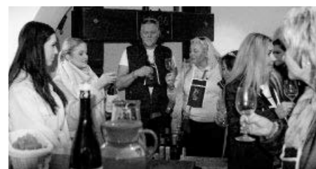
Svatomartinské víno je už samo o sobě výjimečné, o to výjimečnější, naservíruje-li vám jej krásná dívka s titulem Miss České republiky 2021.

na další setkání, třeba již 6. května 2023 na Májových otevřených sklepech!