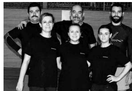
Volejbalový turnaj Velkopavlovické smeče 2022 – místní smíšené družstvo s názvem Hlávci.

Zápasy se hrály od devíti hodin dopoledne