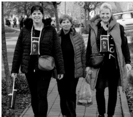
Není to skvělé, využít akci Svatomartinských otevřených sklepů k dámské jízdě?

I my jsme si proto na přivítání účastníků akce připravili menší oslavu na pódiu před radnicí, kde zahrála velkopavlovičká cimbálová muzi-