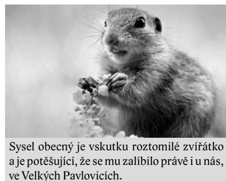
Syselec obecný je vskutku roztomilé zvířátko a je potěšující, že se mu zalíbilo právě i u nás, ve Velkých Pavlovicích.

kách SYSLI NA VINICI a SYSLI V SADU naleznete pod webovou adresou * https://www.syslinavinici.cz/znamky