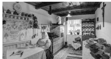
Muzeum obce Kobylí vás ochotně nechá nahlédnout až do kuchyně!