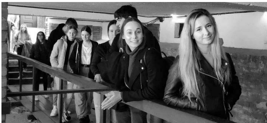
Podzemní výlet maturantů do Prahy se stal na velkopavlovickém gymnáziu každoroční a velmi vítanou tradicí.

Druhý den jsme začali úžasnou snídaní ve formě švédských stolů, bohatý výběr sladkých a slaných pokrmů nám dodal spoustu ener-