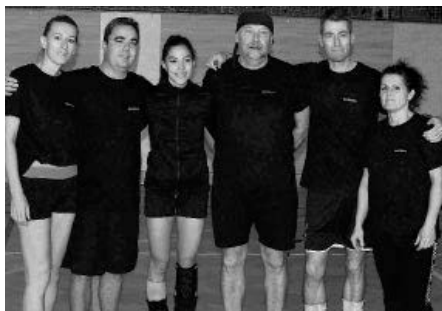
Volejbalový turnaj Velkopavlovické smeče 2022 – místní smíšené družstvo s názvem Velké Pavlovice.

S devíti body turnaj vyhrálo již podruhé družstvo Moravského Žižkova a odvezlo si putovní pohár. Družstva Velkých Pavlovic se ziskem sedm a pět bodů skončila na druhém a čtvrtém místě. Dambořice se šesti body braly třetí místo. Umístění na pátém místě s velkou radostí přijalo družstvo Velkých Bílovic, které se smíšených turnajů