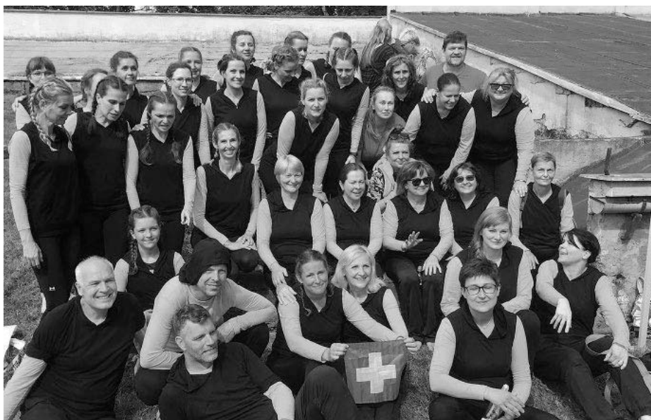
Cvičení naší velkopavlovické jednoty sokolské, dále župy Slovácké, Švýcarské a Rakouské po hromadném vystoupení na Sokolgymu v Brně.