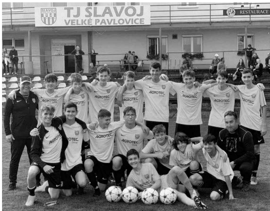
Nově vzniklé a nadějně družstvo DOROSTU TJ Slavoj Velké Pavlovice.

STARŠÍ ŽÁCI vstoupili do nové sezóny výrazně oslabeni odchodem silného ročníku 2007 a proto je hlavním úkolem družstva udržet krajskou soutěž i pro příští sezónu. Druž-