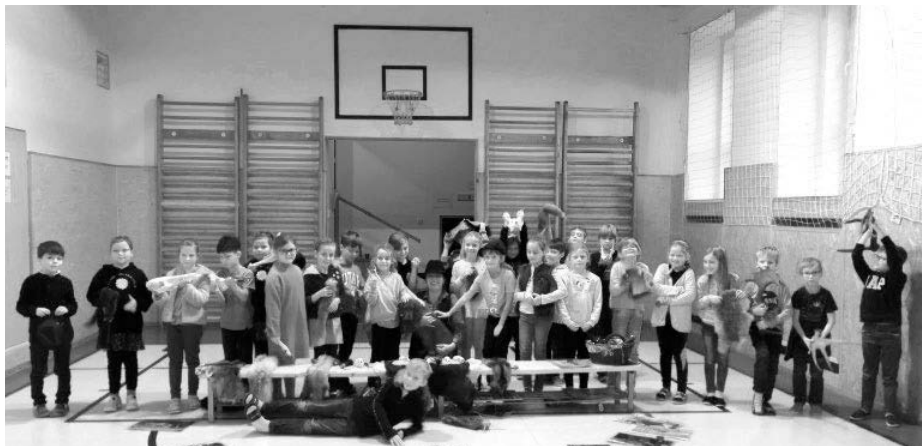
Nejedno z těchto dítek si po poutavé přednášce na téma myslivosti natěšeně řeklo – chci být jedním z nich!