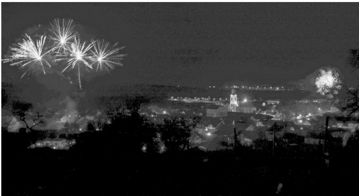
Silvestrovský, či chcete-li novoroční, ohňostroj rozzářil temnou půlnoční oblohu. Byla to krásná podívaná.

Pro ohňostroj je nezbytným předpokladem existence střelného prachu. Střelný prach byl podle historiků objeven v sedmém až devátém století našeho letopočtu ve starověké Číně. Legenda vypráví o čínském kuchaři, který při kuchtění omylem smíchal směr síry, ledku a dřevěného prachu. Střelný prach okamžiči