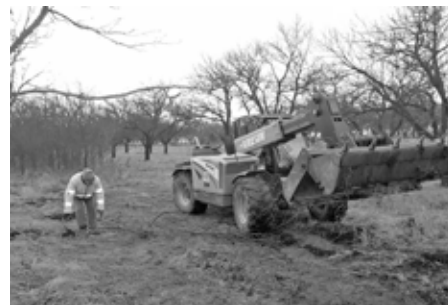
Městský meruňkový sad prokoukl. V únoru byl řádně vycištěn a omlazen.

Se začátkem měsíce února využili zaměstnanci městských služeb relativně slušného počasí a pustili se do čištění meruňkového sadu na obecních pozemcích. Ze sadu odstranili náletové dřeviny a prořezali poškozené stromy.