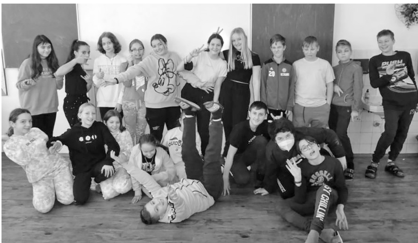
Užít si den v megapohodlíčku? Toť sen všech žáků i z vyššího druhého stupně základky.