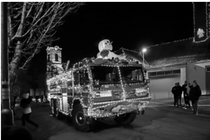
Všem přihlížejícím se právě tají dech, vánočně vyzdobená a do dále svítící Tatrovka opouští hasičskou zbrojnici.