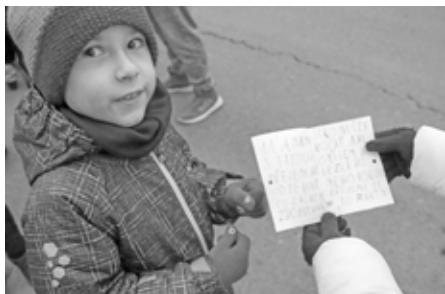
Děti si přišly před vánoční radnici vypustit balóčky vánočních přání Ježíškovi. Ty školou povinné svá přání sepsaly vlastnoručně.

o své vysněné dárky a nemoc nemoc, poslaly je nejkratší možnou cestou do rukou toho nejpovolanějšího.