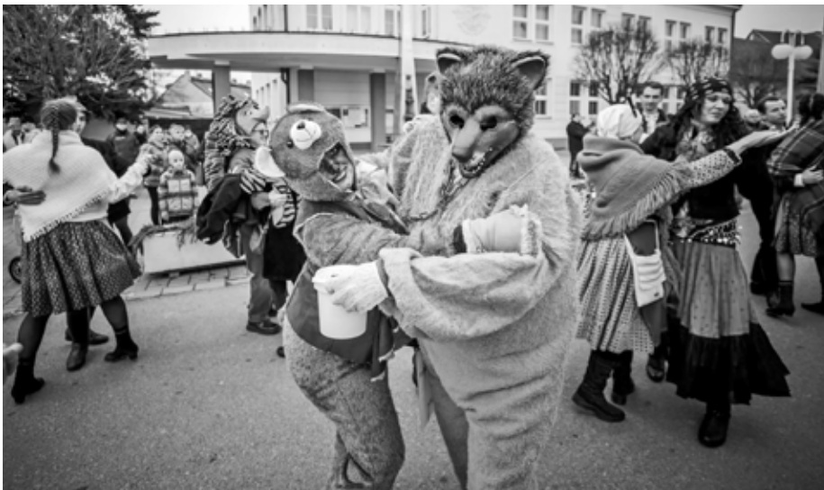
Ostatky jsou oslavou hojnosti, nejen jídla a pití, ale také hojnosti tance, dovádění a veselé nálady.