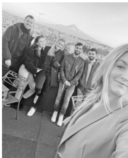
Další projekt Erasmus plus, tentokrát na italském ostrově Sicílie, ve stínu sopky Etna. Tak tomu se říká zážitek na celý život.

A to je pro mě smysl života. Obklopovat se lidmi, kteří jsou pro mě inspirací, velkou motivací a dělat pro sebe a pro své okolí jen to nejlepší a posouvat se někam dál.