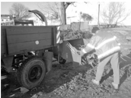
Vánoční stroky se proměnily v mrazu-vzdornou peřinu.