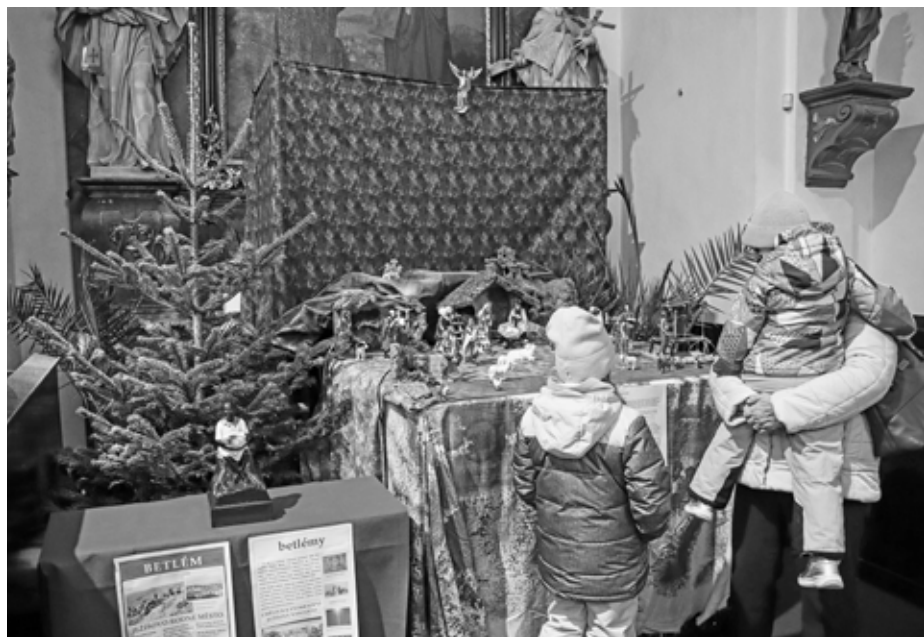
Vánoce bez Betlémku? Nемыslitelné. Nesmí chybět, stejně jako stromeček či talíř sladkého cukru.

V Praze mohli lidé poprvé spatřit jeslič-