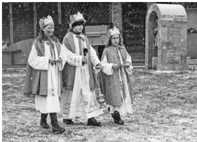
Bez Kašpara, Melichara a Baltazara by se betlémské vyprávění rozhodně neobešlo.