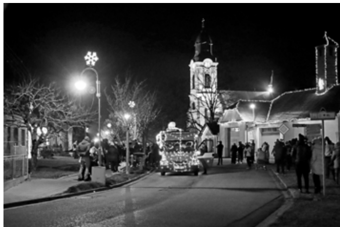
Hurá, hurá, už jedou!!! Především děti byly ze svítící Tatrovky se sněhulákem na kapotě štěstím bez sebe.

rou zpestřila místním adventní čas a zkrátila čekání na Ježíška.