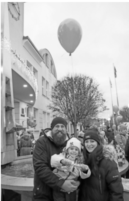
V roce 2021 utvořily nejpočetnější skupinu účastníků akce Vánoční jarmark u radnice rodiny s malými dětmi.

Přestože se o čtvrté adventní neděli roku 2021 nekonal klasický a všemi tolik oblíbený vánoční jarmark, před velkopavlovickou radnicí se v poměrně hojném počtu sešli obyvatelé Velkých Pavlovic, především pak rodiče s menšími dětmi.