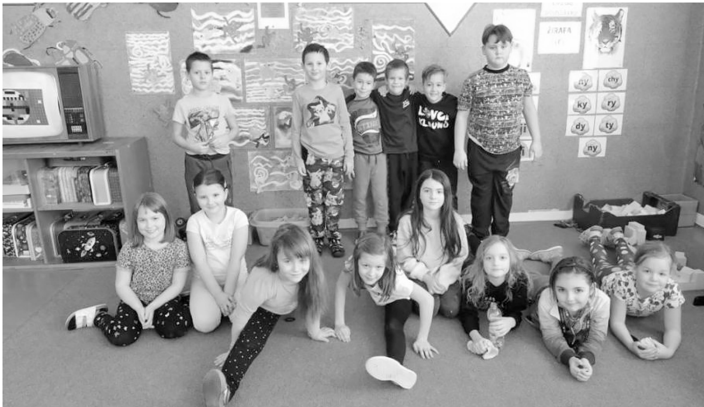
V teplákách dorazili v rámci projektového dne všichni školáci. Na této fotografii jsou to žáci z prvního stupně.