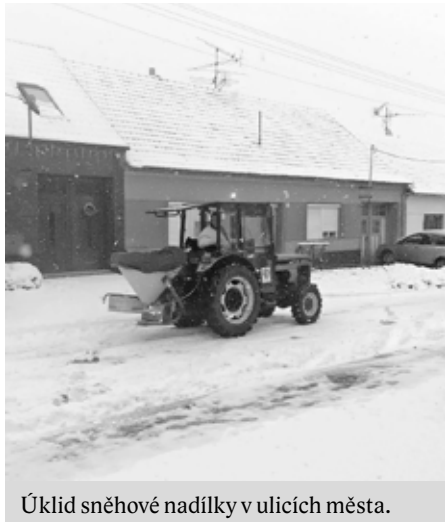
Úklid sněhové nadílky v ulicích města.

Předpovědi meteorologů se vyplnily a pár dnů po Mikuláši zasypaly jižní Moravu přívally sněhu. Zaměstnanci služeb města však tato kalamita nezaskočila a s nastalou situací si poradili na výbornou. Od časného rána byli s veškerou technikou v terénu a neúnavně uklízeli. Zametací vůz udržoval bezpečnou schůdnost chodníků, traktory s radlicemi a nakladače zase silnice.