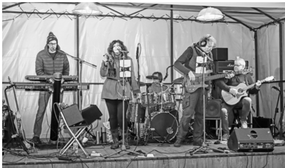
O krátký doprovodný hudební program se s bravurou postarala skupina Windband z Podivína. Nutno podtrhnout, že byla skvělá!

„Pět, čtyři, tři, dva, jedna, teď!“ Ozvalo se z reproduktoru a nebe nad hlavou zaplnila nekonečná spousta balónků ověčených množstvím tajných vánočních přání. Děti si, navzdory všem příkazům a zákazům a celé pandemii covidu, napsaly Ježíškovi