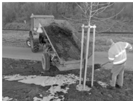
Pracovníci služeb města rozvázejí mulč k mladým sazenicím stromků nedaleko vlakové zastávky.

V pátek 7. ledna 2022 mrzlo až praštělo. Zrána některé venkovní teploměry ukazovaly bezmála 10 stupňů pod nulou. Natolik nízká teplota si žádala pořádně se obléci. My lidé to pořešíme po vlastní ose, teplá bunda či kabát to spraví. Ale co stromy ve volné přírodě? Navíc, máme-li na mysli mladé, nedávno vysazené křehké sazenice náchylné k promrznutí? Ty si žádají speciální péči spočívající třeba právě v ochraně pomocí mulče. Mulč krom mrazu navíc chrání půdu před erozí, zabraňuje vypařování vody z půdy, svým rozkladem jí dodává živiny a tlumí růst plevele. Chrání také kořeny rostlin a cibulky před chladem a před poškozením. Mulč také slouží jako úkryt pro různý hmyz a podporuje aktivitu žíhal a půdních mikroorganismů. Pracovníci služeb města jej během promrzlého dne rozvezli ke stromkům nacházejícím se u cyklostezky podél železniční tratě, nedaleko vlakové zastávky.