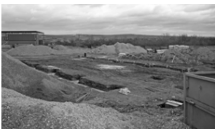
Služby města Velké Pavlovice se budou na léto stěhovat do nového.

V měsíci listopadu 2021 začaly práce na budování nového technického zázemí pro Služby města Velké Pavlovice. Jedná se o výstavbu zpevněné plochy a halu pro technické služby města na pozemku města,