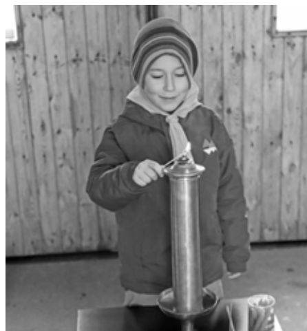
Skauti si ochotně ukrojili ze svého štedrodenního času proto, aby mohli držet stráž při rozdávání Betlémského světla. Děkujeme!