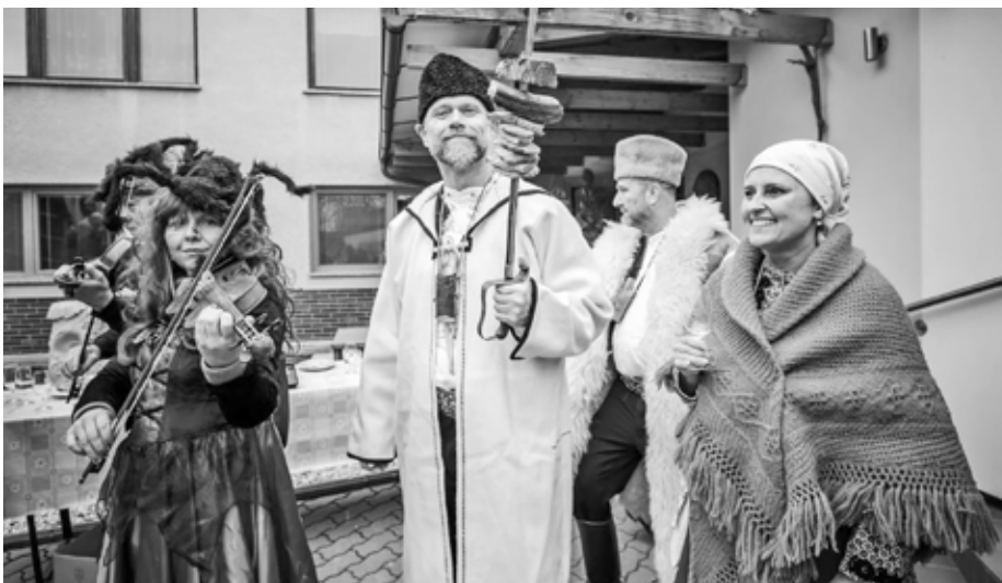
O Ostatcích si můžete dát všeho, co hrdlo ráčí a žaludek unese. Nemáte právě chuť na ku sдобře prostřelého špeku stáhnutého rovnou ze šavle?