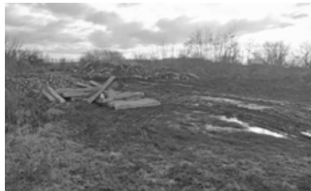
"Hrůdek" poklizen. Skládka zmizela.

několik let materiál, který se „ještě někdy“ může hodit. Betony, kameny, rozbité panely, stavební suť apod. Bohužel se vytvořila na Hrůdku skládka odpadu (dá se říci...) a postupně jej zavážel kdokoli čímkoliv. Bylo tak nutné řešit jeho vyklizení. Vedoucímu Služeb města Velké Pavlovice panu Janu Havránkovi se podařilo dohodnout využití materiálu pro stavební účely další osobou. Ona získala materiál, město nebude muset platit drtičku anebo skládkovné. Dříve bylo místo vyhrazené pro uskladňování oplocené a uzavřené. Nyní bude příjezd k tomuto místu znemožněn betonovým hrazením.