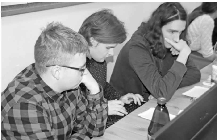
Studenti velkopavlovického gymnázia na Dějepisné soutěži roku 2021. Tentokrát jim místo Chebu stačilo dorazit do nedalekého Brna a klání si užít prostřednictvím internetu.