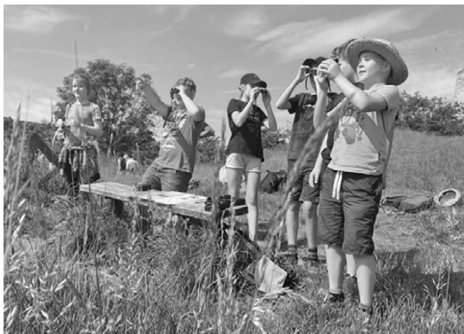
Environmentální programy pro děti, nejlépe pod širým nebem, to je „alfa a omega“ činnosti velkopavlovického ekocentra.

Tříkrát týdně se můžete přidat na jógu paní Anety Pavlíňákové nebo paní Petry Cavalla-