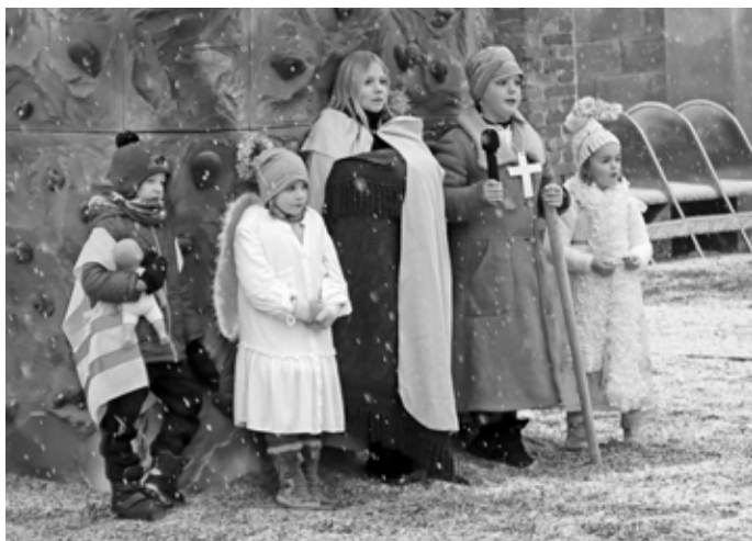
Dvůr velkopavlovické fary se stal místem, kde se odehrál příběh narození Ježíška. Role si rozdělily děti.