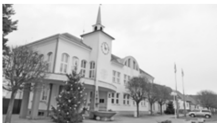
Vánoční strom před radnicí k nám doputoval z Dolních Bojanovic.

V neděli 28. listopadu 2021 začal advent a naše městečko se postupně proměnilo vánoční výzdobou. Jako každoročně byl rozsvícen vánoční strom před radnicí, který sem byl pár dnů předem dopraven z nedalekých Dolních Bojanovic. Při vjezdu do Velkých Pavlovic všechny vítal krásně nazdobený stromeček na kruhovém objezdu, nechyběla ani světelná výzdoba na lampách veřejného osvětlení, bohatě nasvícena byla i spousta rodinných domů a jejich zahrádek. Aby toho nebylo málo, přišel místostarosta se zajímavou novin-