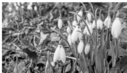
Bílé jako sníh, a přesto zvěstují jaro – květy sněženek každoročně netrpělivě vyhlížíme.