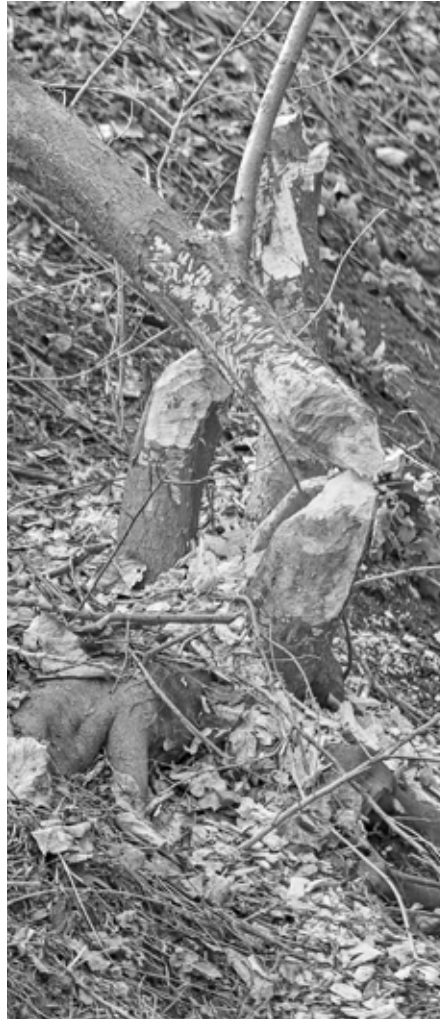
Toto je jednoznačný důkaz, že se ve fotografované lokalitě nachází bobr evropský. Nemějte mu to za zlé, prostě si nemůže pomoci, hráze jsou jeho pudovou vášní.

Při pohledu na bobra si nelze nevšimnout ani obrovských, nápadně oranžových hlodáků, které jsou pro něho důležitým pracovním nástrojem. S jejich pomocí dokážou bobří porazit strom s kmenem o průměru přes půl metru. Postupují přitom systematicky a kmen ohlodávají rovnoměrně ze stran ve výšce ně-