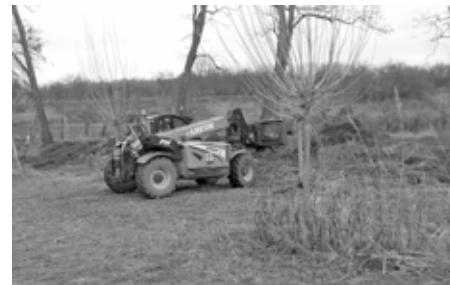
Odstraněné dřeviny ještě posloužily, byly rozdrčeny na cenný mulč.

Pracovníci Služeb města využili během zimního měsíce ledna příznivého počasí v době vegetačního klidu a dali se do odstraňování křovin, náletových dřevin a suchých stromů v biocentru Zahájka. Na likvidaci větví využili sběrný a drtící vůz Zago. Podrcená hmota byla dále využita jako mulč u vysazených stromů.