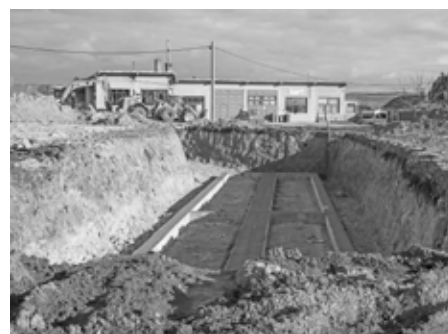
Ještě před pár měsíci zde bylo kdysi věhlasné zemědělské družstvo. Za nějaký čas zde budou nové rodinné domy. Jó, časy (a místa) se mění...