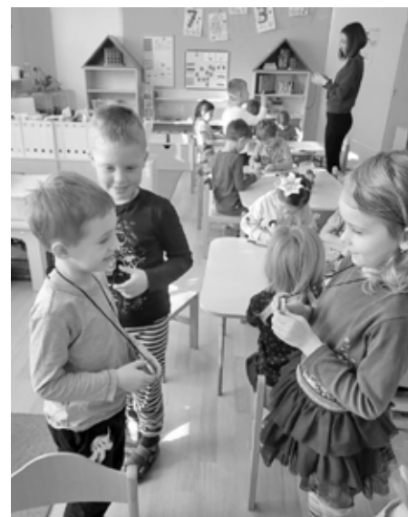
Jak si vyrobit ozdoby na krk ze dřeva? Nebo dokonce loutku? Zeptejte se dětí z mateřinky. Měly totiž možnost si tuto nádhernou práci vyzkoušet.

Kolektiv zaměstnanců Mateřské školy Velké Pavlovice