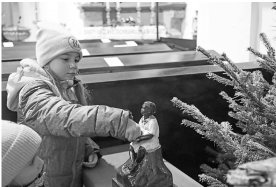
Stačí vhodit drobnou minci a úsměv na dětské tváři jest vykouzlen! Uklánějící se černoušek je v kostele vyhledávanou kratochvílí.

K oslavám vánočních svátků nerozlučně patří stavění Betlému. Ať už menších v domácnostech, tak těch větších v kostelech a chrámech. Jeden takový byl od začátku adventu až do lednových dnů k vidění také ve velkopavlovickém kostele Nanebevzetí Panny Marie.