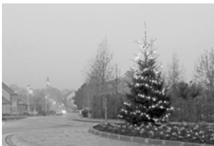
Vánoční strom na kruhovém objezdu před Hotelem Lotrinský.

kou. Pro ukrácení čekání na Vánoce pověsil každý den na vánoční strom před radnicí nějakou tu mlсотu či drobnůstku... Především děti byly ve střehu a nález předvánočního dárečku jim působil velkou radost.