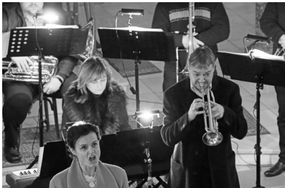
Vánočně vyzdobený velkopavlovický kostel hostil hudebníky novoročního koncertu komorního souboru Musica Animae, tedy „hudby z duše“.