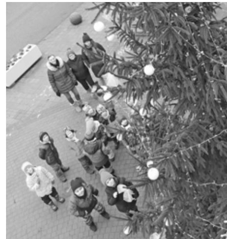
Našly jsme bonbóny! Děkujeme!

trošku kouzelný. Každý den se na něm totiž objevilo nějaké to malé překvapení. Ten, který měl oči na stopkách, mohl mezi jeho pichlavými větvíčkami objevit třeba cukrovinku. Není tedy divu, že se náměstí se stromem stalo pravidelnou zastávkou vycházek dětí z mateřské školy. To bylo radosti, když občas něco sladkého objevily! A nezapomněly ani na poděkování do okna panu místostarostovi, který tuto adventní kulišárnu vymyslel!