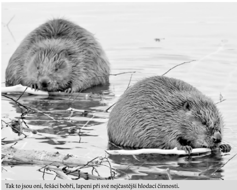
Tak to jsou oni, fešáci bobří, lapení při své nejčastější hlodací činnosti.

úprava a doplnění textu: Karolína Bártová