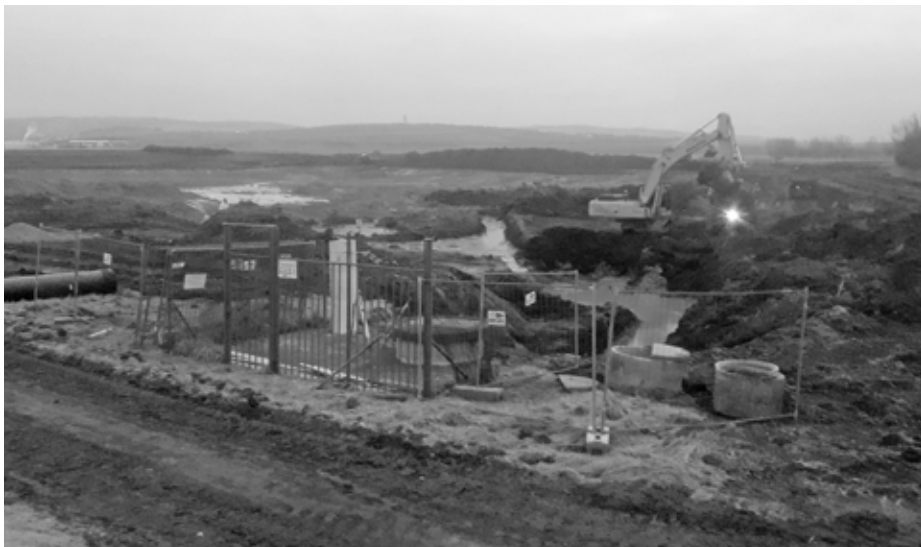
Začátkem ledna se opět rozjely práce na budování nových vodních ploch v lokalitě Zábłatská.

O budování nových vodních ploch a také o před nedávnem ukončený projekt Povodí Moravy – prodloužení říčky Trkmanky, se začali zajímat také reportéři hlavního zpravodajského pořadu Události z České televize, kteří o těchto významných akcích s pozitiv-