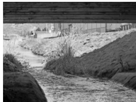
Nebylo zbylí, stovka metrů Trkmanky musela jít pod zem.

Už jste se někdy zamysleli, například při zkoumání leteckého snímku areálu vinařské firmy Vinium, a.s., nad tím, kam se najednou ztratilo koryto říčky Trkmanky? Část toku (bezmála 100 metrů) je schováno doslova a do písmene pod zemským povrchem. Překlenutí Trkmanky mostním systémem bylo zahájeno firmou Geotest Brno roku 1979.