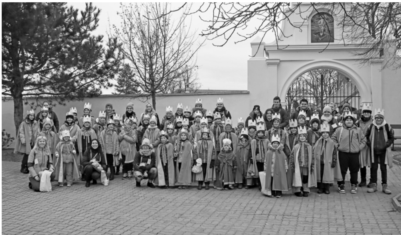
Bylo nás skoro padesát a všichni jsme rádi coby Tři králové koledovali, zima nezima, mráz nemráz, vždy s úsměvem a koledou na rtu.