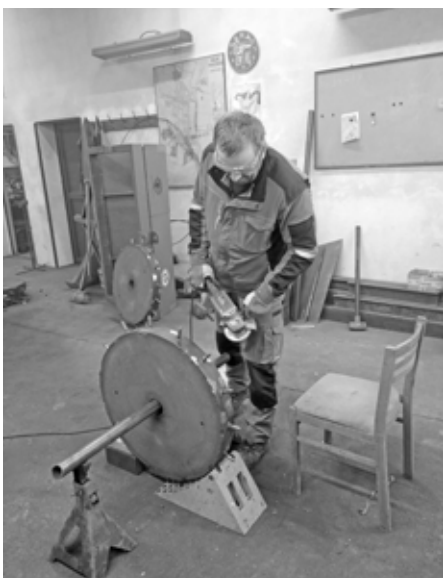
Oprava provzdušňovacího válce v dílně Služeb města.

Zima je ideální období k opravám a údržbě nářadí. Zaměstnanci Služeb města letos krom mnohého dalšího opravili i provzdušňovací válec na fotbalové hřiště.