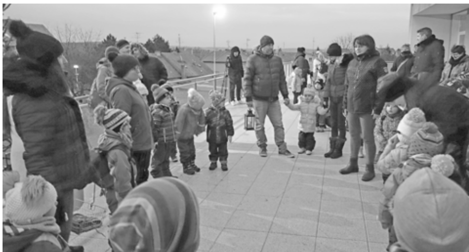
Advent je časem těšení a časem pohádkových kouzel, především pro děti. Ve školce si jej užily plnými doušky.

Jako každý rok, tak i v roce loňském nás potčil návštěvou Mikuláš s Andělem, no ani čert nezůstal za dveřmi. Tato trojice procházela školkou a postupně navštívila všechny třídy naší školky. Nejprve se zastavila u těch nejmladších – Motýlků, dále zamířila za dět-