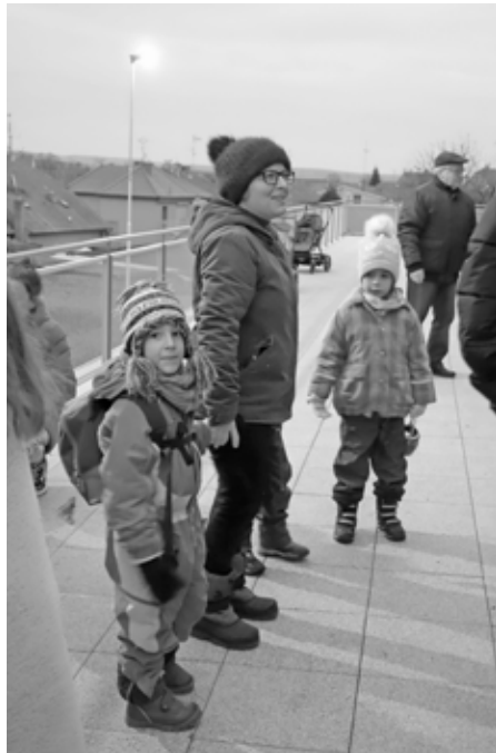
Radostné odpoledne ve vánočním duchu nepatřilo jen dětem školkou povinným, ale také jejich rodinným příslušníkům.

mi do třídy Sluníček, ze třídy Kuřátek se vydala do tříd předškoláků. Uvítali je i v Kofátkách a Mikuláš se svojí družinou nevynechal ani třídu Berušky. Protože v naší školičce jsou jen hodné děti, čert měl smůlu. Žádného hříšníka ve školce nenašel, tak odcházel s prázdnou.