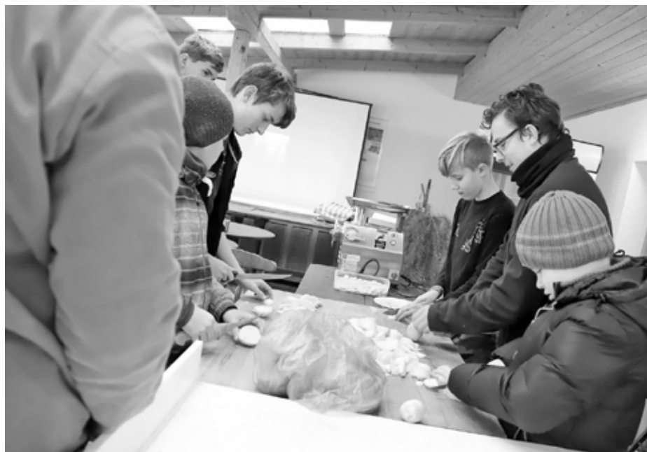
Na zabíjačku je třeba nespočet cibulí. Hlavně se nad tou prací nerozplakat!

U pracovního stolu pod pergolou se už formovala parta, která měla za úkol nabít do střev řezníkem připravený prejt a zašpejlovat pevně a neprodyšně druhý konec střev. A na konci této linky již zase další dobrovolníci nakládali hotové jitrnice do lavoru a odnášeli je na dvorek, kde je ukládali do kotle na uvaření. Tady pak musel velmi zodpovědný