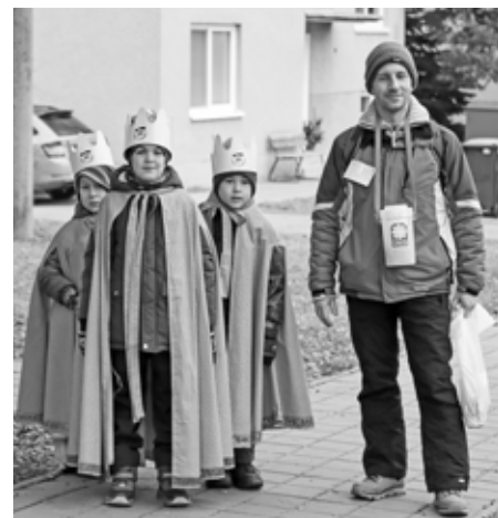
Takových tříkrálových družinek jste mohli v sobotu 8. ledna potkat po městě nespočet.