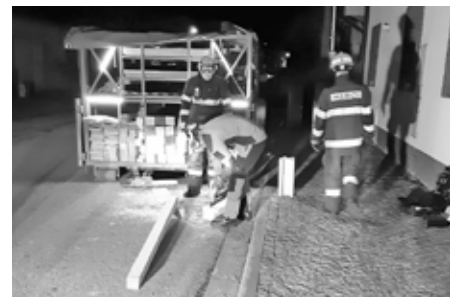
Velkopavlovičtí hasiči „hasili požár“ v podobě zajištění zborcené stěny ve vinném sklepu.

Ve čtvrtek 13. ledna po půl sedmé večer zasahovali hasiči ve Velkých Pavlovicích u vodovodní havárie. Podle původního oznámení se mělo jednat o čerpání vody ze zatopeného sklepu. Na místě však zjistili, že došlo k poškození stěny a podlahy. Přivolaný statik zhodnotil situaci a doporučil zajistit část prostoru. Pomocí dřevěných trámů zapažili narušenou stěnu, aby nedošlo k jejímu zborcení. Zásah ukončili před dvacátou druhou hodinou.