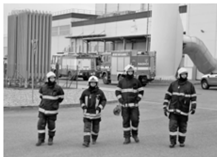
Velkopavlovičtí hasiči při náročném zásahu v Hustopečích.

Pět hasičských jednotek se podílelo na likvidaci požáru v hustopečské firmě vyrábějící krmivo. Nejednalo se o typický požár, kde by šlehal plameny, ale o zahoření suroviny na výrobu krmiv ve výrobní lince. Velkopavlovičtí hasiči se podíleli na vyhazování sypaného materiálu ze zásobníku, který je součástí linky.