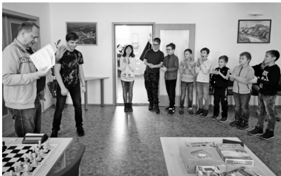
Slavnostní vyhlášení výsledků novoročního šachového turnaje žáků do 15 let Šachového kroužku při ZŠ V. Pavlovice.

současní, anebo bývalí členové šachového kroužku při ZŠ Velké Pavlovice. Hrání se v neděli 3. ledna 2022 v důstojných prostorách zasedací místnosti Městského úřadu Velké Pavlovice.