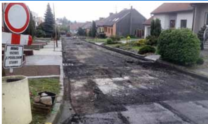
Zahájení rekonstrukce vozovky na ulici Kpt. Jaroše.