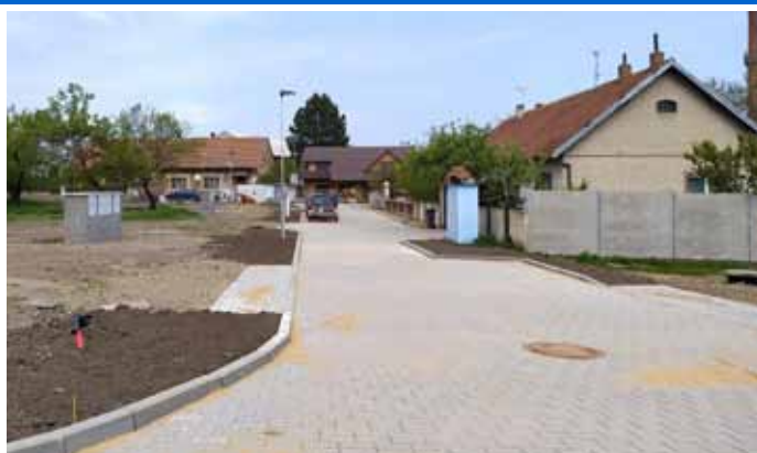
Nová komunikace ke stavebním parcelám na ulici Tovární.