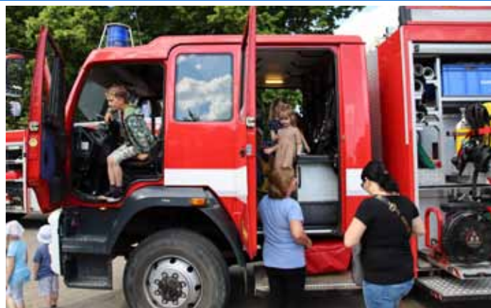
Hasičská oslava Mezinárodního dne dětí se odehrála před hasičskou zbrojnicí a náměstí.