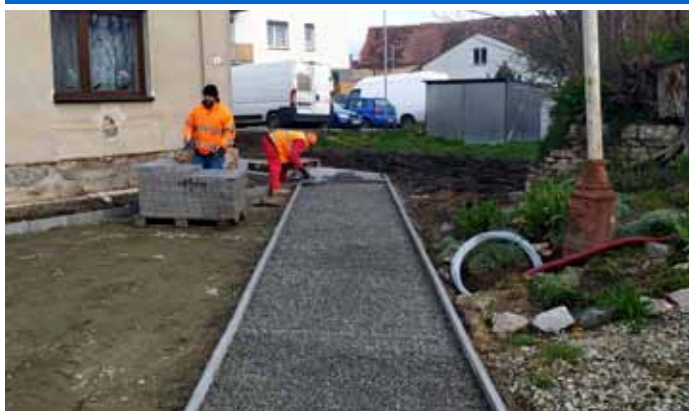
Rekonstrukce chodníku na ulici Tovární.