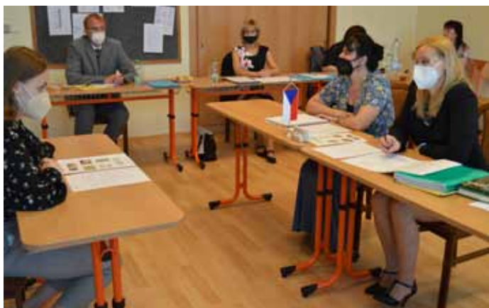
Gymnázium – ústní maturitní zkoušky ve znamení pandemie.