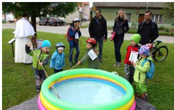
Noc kostelů 2021 byla jednou z prvních akcí po uvolnění přísných opatření v souvislosti s COVID-19.