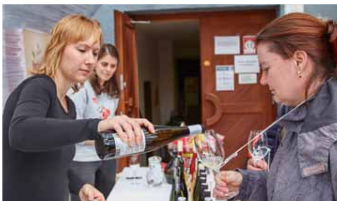
Velkopavlovičtí vinaři uspořádali akci Májová otevřená žudra 2021.