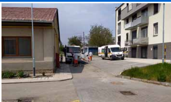
Firma Stavby a údržba silnice Břeclav opravila komunikaci u nového bytového domu na ulici Tovární.