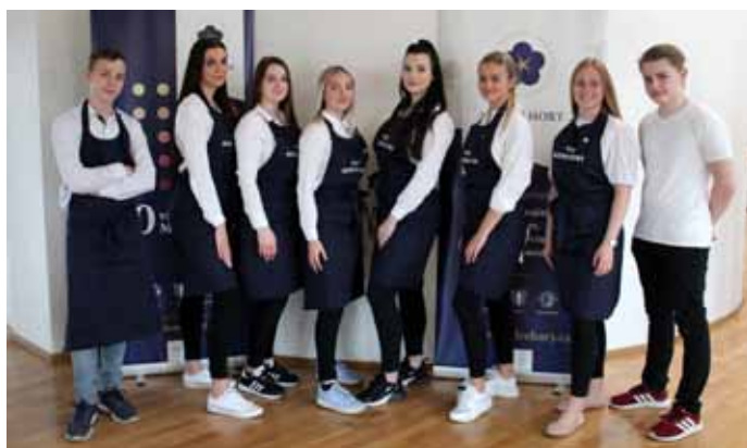
Na degustaci vín pro 6. ročník soutěže 30 vín Modrých Hor nalévala vzorky místní mládež.