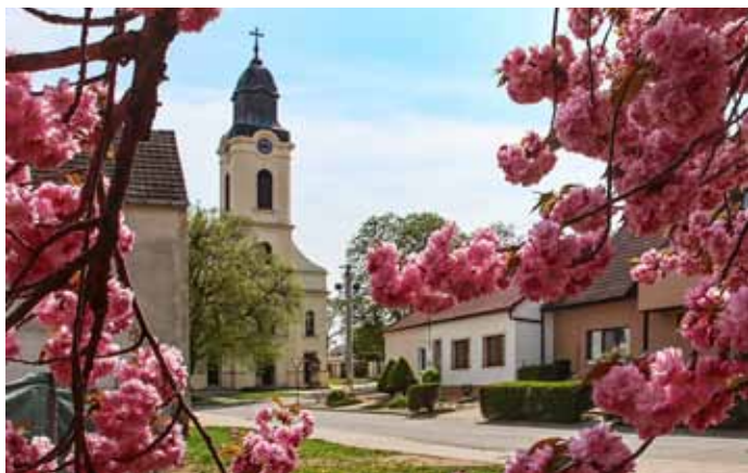
Rozkvetlé sakury v parčíku „za Crhákovým“ na ulici Bezručova.