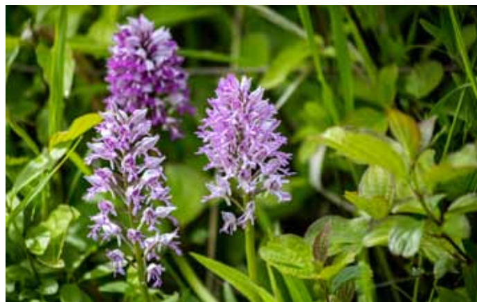
V lokalitě Súdňý rozkvetla orchidej Vstavač vojenský.