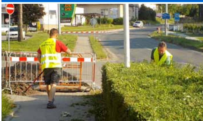
Pracovníci služeb města provádí údržbu zeleně v ulicích Velkých Pavlovic.