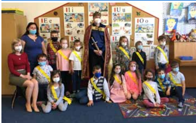
Základní škola & Městská knihovna – Pasování prvňáčků na čtenáře – 1.A třída.