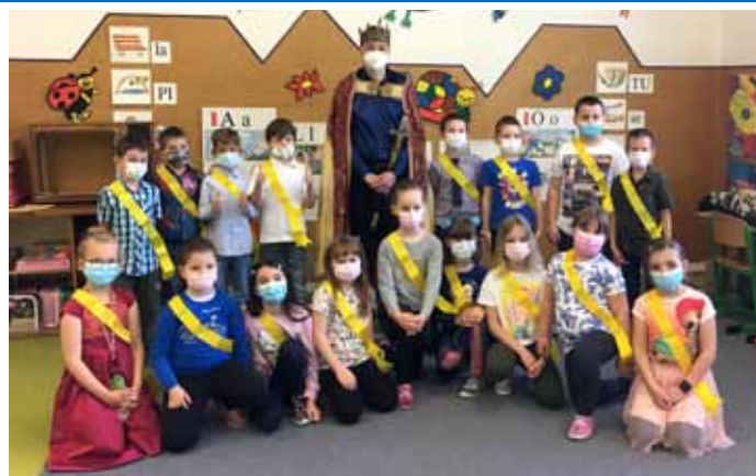
Základní škola & Městská knihovna – Pasování prvňáčků na čtenáře – 1.B třída.