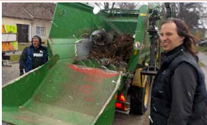
Svoz rostlinného odpadu z ulic města s následným zkompostováním vozem Zago.