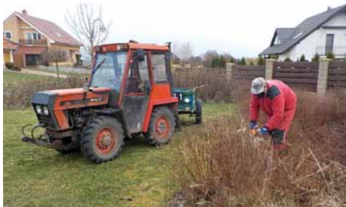
Jarní úprava městské zeleně na veřejných prostranstvích.