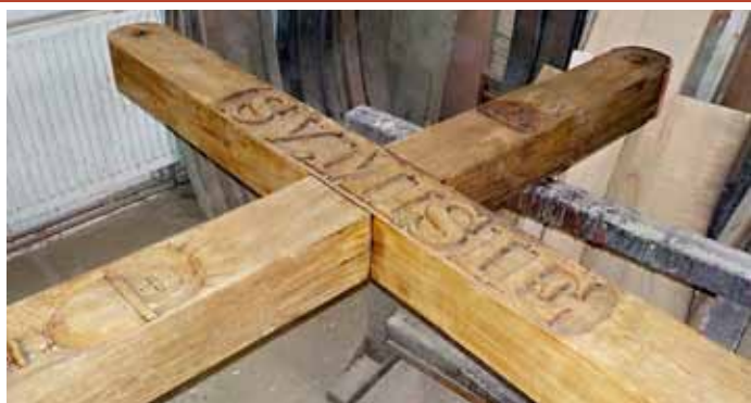
Kříž sv. Misie z roku 2002, který zdobí zelené prostranství na ulici Dlouhá, prošel už podruhé renovací; stejně jako minule ji provedli pracovníci služeb města.

Spousty dalších fotografií ze všech akcí a pracovních aktivit ve městě najdete na oficiálních webových stránkách města Velké Pavlovice – www.velke-pavlovice.cz