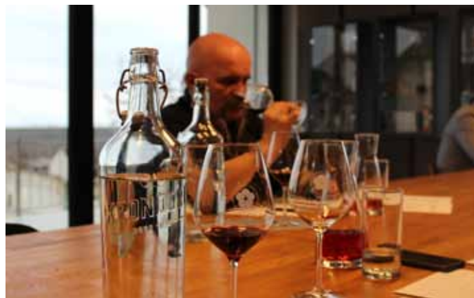
I. zatřídování vzorků vín pro certifikaci VOC Modré Hory v roce 2021.