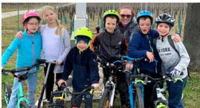
Což takhle si vyrazit po stopách křížků v okolí Velkých Pavlovic? Zkuste to stejně jako naši malí farníci.