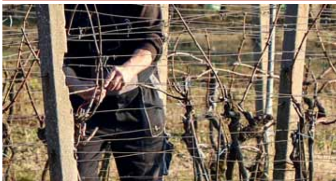
Typický obrázek jarních dnů u nás ve Velkých Pavlovicích; vinohradníci se dali do stříhání a vázání keřů révy vinné.