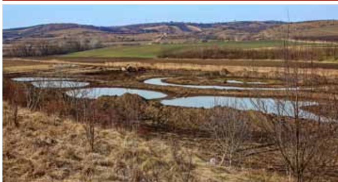
Okolo koryta říčky Trkmanky vznikají tůně, najdete je směrem k obci Bořetice.