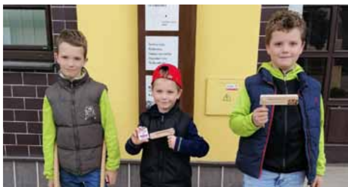
Páni kluci se vypravili do terénu; s hrkači a řehtačkami nahradili vyzvánění kostelních zvonů, které tak jako každé Velikonoce oněměly, odletěly do Říma.