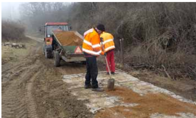
Oprava polní cesty v lokalitě Čechanzle – Vintrlík.