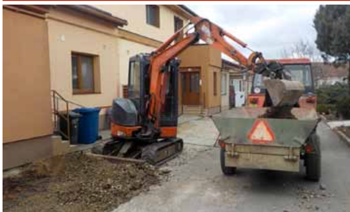
Oprava komunikace a budování nových parkovacích míst na ulici Tovární.