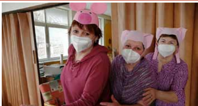
Také mateřinka vyučovala distančně – paní učitelky zahrály dětem on-line divadélko.