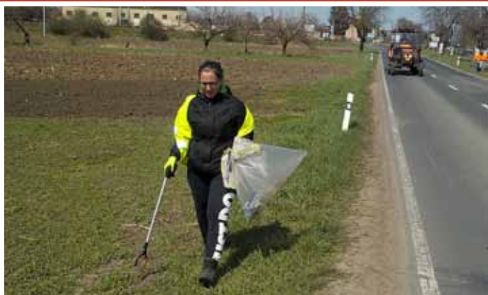
Velký jarní úklid města – sběr odpadků podél komunikace směrem k obci Rakvice.