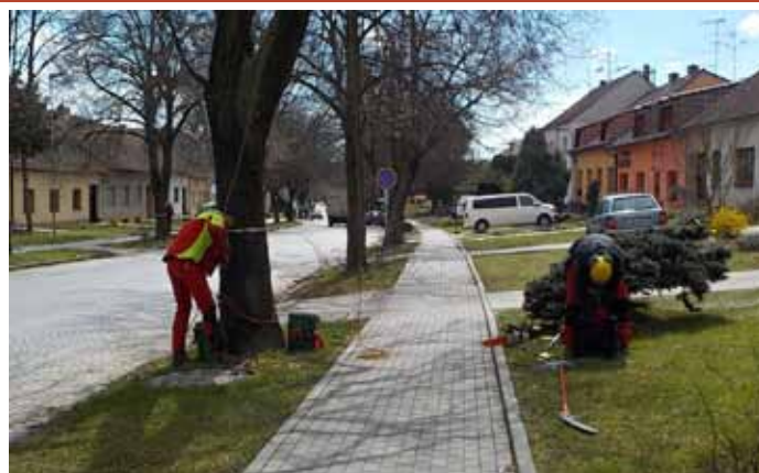
Specializovaná firma Arbo-team provedla na ulici Hlavní ozdravný řez v korunách vzrostlých lip.