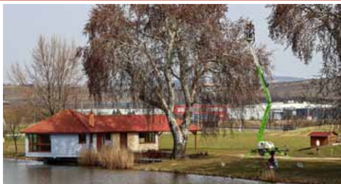
Pyl z jehnědů topolů okolo našeho rybníka se stane základem léků proti alergiím; jejich užití však předcházeli náročný sběr cenného materiálu pomocí vysokozdvizných plošin.