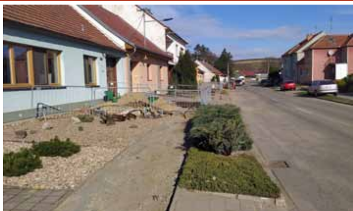
Generální oprava plynovodu v ulici Pod Břehy.