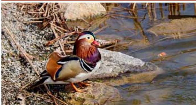
Exoticky vyhlížející kachnička mandarínská si oblíbila vody velkopavlovického zámeckého rybníka u ulici Nádražní.