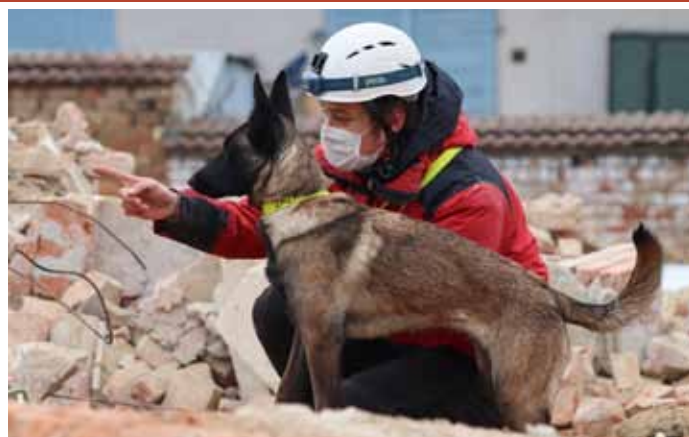
Profesionální psovodi a jejich záchranářští psi cvičili v troskách po demolici budovy kina vyhledávání zasypaných osob.