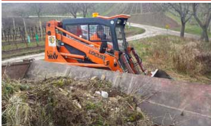
Úklid černé skládky vytvořené vyvezením nepotřebného stavebního materiálu a sutí v trati Francle.