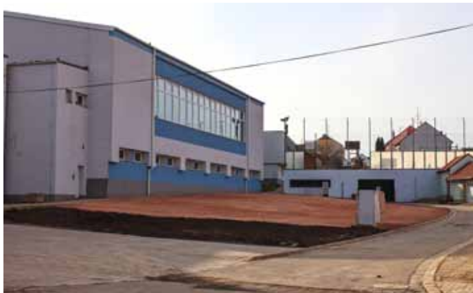
Na místě, kde ještě nedávno stávalo zchátralé kino, bylo vybudováno provizorní parkoviště.