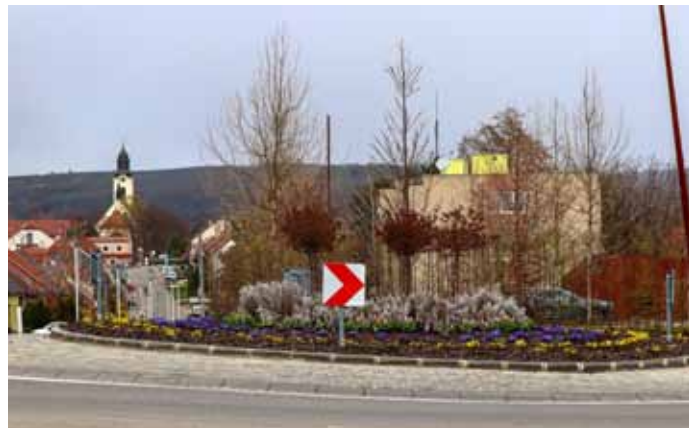
Kruhový objezd na křižovatce ulic Brněnská, Dlouhá a Za Dvorem rozkvetl záplavou jarních květů.