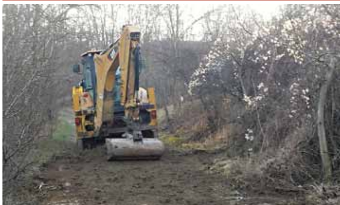
Oprava polní cesty v trati Súdňý.