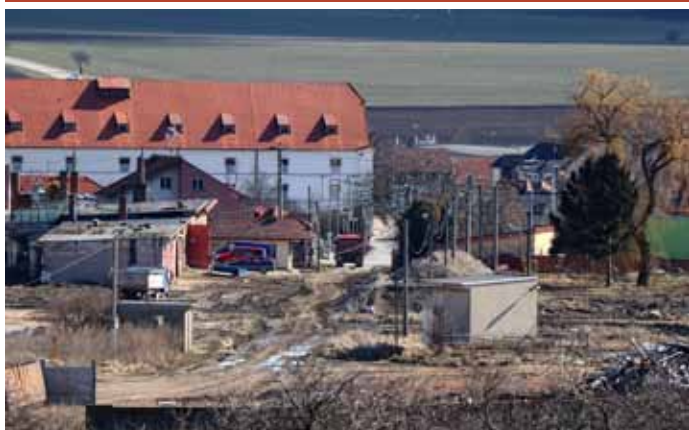
Areál věhlasného velkopavlovického JZD už nenajdeme, na jeho místě zanedlouho vyrostou nové rodinné domky.