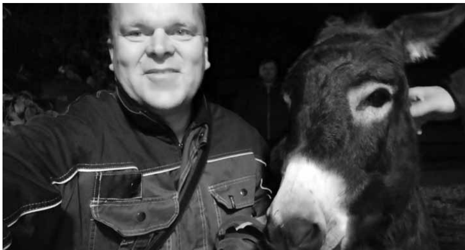
Tak to je mimořádné selfie! Komu se kdy poštěstí se vyfotit s oslem?

Bobra jste někdy chytali? Tak si představte, že i s tím jsme se seznámili. Bylo to na Vrbici a v živé paměti mám, jak byl natlačený v rohu u roletových vrat garáže. Proč byl bobr až kdesi na Vrbici, nevím. Žádost o odchyt nám byla oznámena skoro v noci, kolem dvaadvacáté hodiny, telefonicky a my jsme na hasičské zbrojnici řešili, zda to oznámit operáčnímu, anebo ho prostě chytit jen tak. Přeci jenom je třeba myslet i na zadní vrátka. Kdyby se něco stalo, aby to bylo ošetřeno – pracovní úraz apod. Rozhodli jsme se, že odchyt oznámíme radiostanicí operáčnímu a tak se také stalo. Ten si nechal oznámení ještě jednou zopakovat a raději nás odkázal na telefonní hovor. První dotaz byl, zda jsme náhodou nepožili alkohol. Když jsme mu řekli, že ne, že jsme byli skutečně osloveni, tak nám řekl, že nikam nepojedeme, protože na to nemáme odbornou způsobilost. Tak jsem mu řekl, že mám kurz na odchyt toulavých zvířat. Přesto nám výjezd nezaregistroval. Ale to bychom nebyli my, abychom se nešli na bobra podívat a odchytit jej. Odchyt proběhl přehozením deky přes něj, „zachumlováním“ a umístěním do vinohradnické bedny. Slavnostně jsme jej pak vezli k Trkmance, kde jsme ho vypustili. Až někdy budete s hasiči a budou vás chtít zakrýt dekou, možná z ní toho bobra ještě ucítíte. (Blbost..., už je vypraná.)