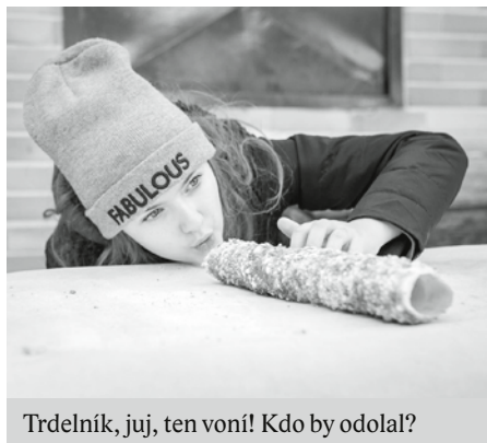
Trdelník, juj, ten voní! Kdo by odolal?

V místní gastronomii se jen zřídka kdy setkáte se surovinami, které by nebyly lokálního původu. Kromě vinohradů u nás totiž najdete také úhledné zahrádky plné zeleniny a ovoce nebo rovnou celé ovocné sady, z jejichž plodů vznikají ty nejlepší pochutiny po celý rok.