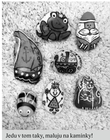
Jedu v tom taky, maluju na kamínky!

To jsme si tak jednou začátkem letních prázdnin s manželem vyrazili na výlet na koly. Zastavili jsme se v Bořeticích pod rozhlednou a zasedli za stůl posvačit. Na stole ležel pěkně namalovaný kamínek. Jeho nález nás potěšil a vzbudil v nás zvědavost a spousty otázek. Kdo ho namaloval? Kdo ho tu nechal? Zapomněl ho zde někdo? Kdo ho bude hledat? Proč je ze spodní strany jakési číslo?