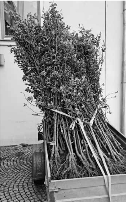
Díky dotacím získaných Ekocentrem Trkmanka na výsadbu stromů jsou zelené plíce našeho města opět o něco silnější a vzduch, který dýcháme, zdravější.

seminářů, mezinárodních konferencí, divadelní desetidenní pobytový tábor a další.