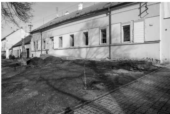
V roce 2017 proběhla na faře výměna oken a byla zateplena fasáda.