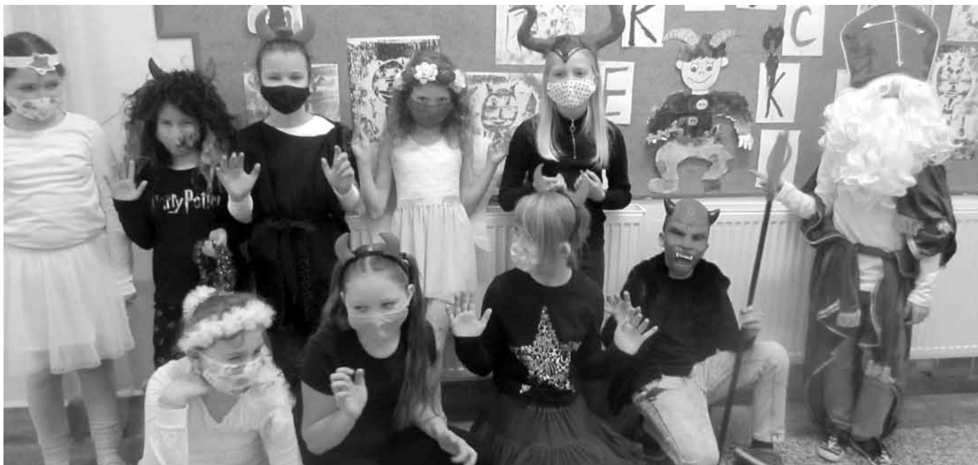
Mikuláš připravil pro žáky Základní školy Velké Pavlovice balíčky se sladkou nadílkou. Mikuláše si žáci základní školy Velké Pavlovice užili, i když mnohé nešlo za rouškou ani poznat. To pak měl i čert problém, koho strčit do pytle!