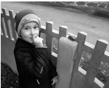
Pšššt, posílám dál putující kamínek, hlavně ať mě nikdo nevidí...

ni procházka cca hodinu a půl činí dvacet pět kamenů (a to některé už jsem fakt přehlížela, abychom je nevybírali všechny). Dnešní cesta do školy (po měsíci) šest kamenů. A takto bych mohla pokračovat. Už jsem dokonce slyšela od dětí větu: „Mamí, pojďme radši pěšky.“ „Proč? Vždyť je škaredě a mrholí.“ „To nevádí, já chci hledat kameny.“ Takže pozor, hledání začíná být návykové.