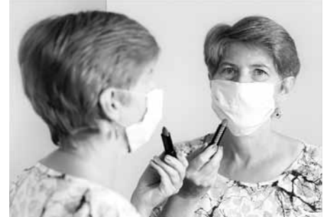
Hádat autora této fotografie je pro mnohé z vás určitě hračka. František Kobsa? Bingo!

ní straně. V hlavním menu odkazů hledejte ve spodní části lištu s názvem – Výstava „Vnější a vnitřní zrcadlení“ – on line prezentace a vydejte se na prohlídku virtuální výstavy. Přejeme vám příjemný zážitek.