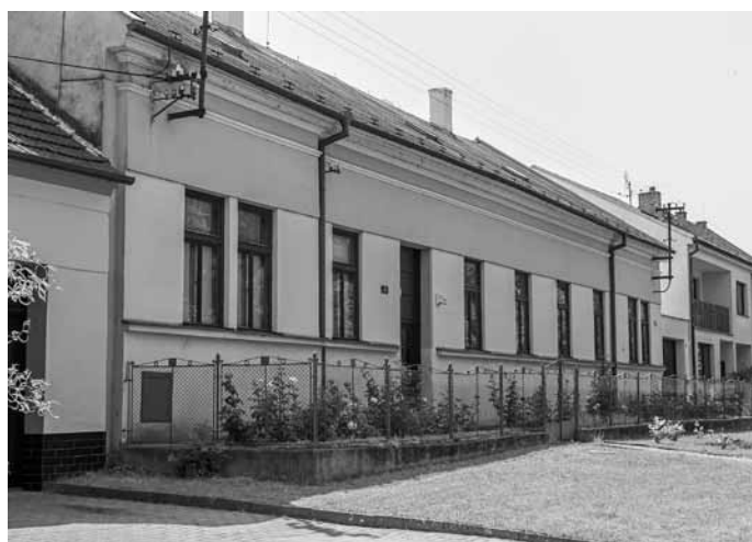
Fara za faráře Antonína Střelce (1984–2003).