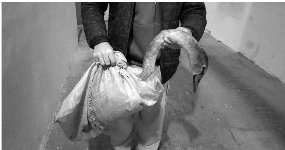
Labuť, která uvízla v obrovské kaluži, se podařilo zachránit díky profesionálnímu zásahu strážnice Ivy Rathouské.

Ve vteřině projde hlavou tisíc myšlenek, jakým způsobem labuti pomoci i když si každý řekne, že se jedná jen o labuť, která přece nemůže ublížit. Nicméně k oznámení se vydala