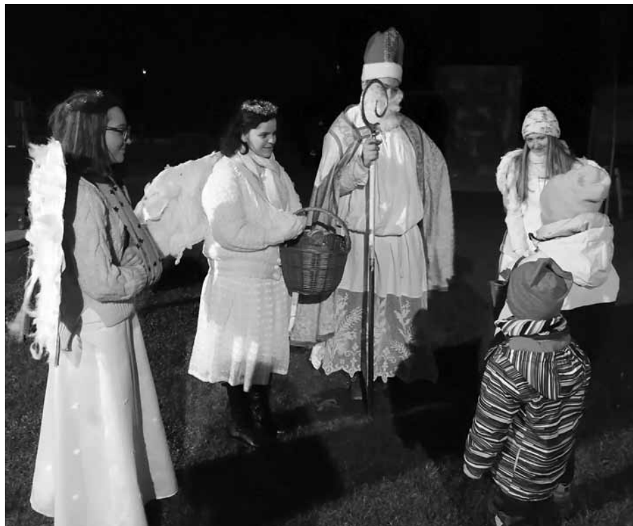
Svatý Mikuláš a andělé uposlechli vládní nařízení a raději oželili tradiční nadílku uvnitř kostela. Venku na čerstvém vzduchu, a hlavně bez roušek, se rozhodně lépe a svobodněji dýchalo.