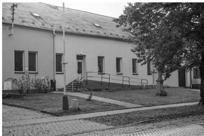
Budova velkopavlovické fary dnes.