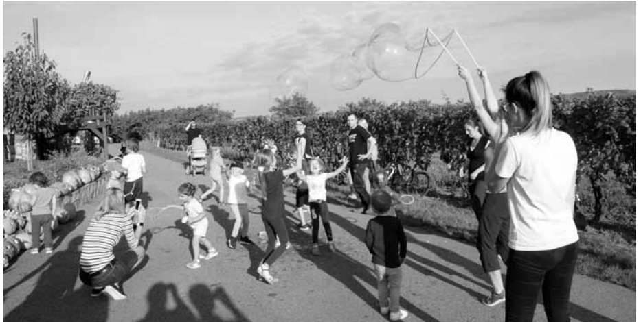
Spousta bublin, spousta radosti! Jak vidno, Veselé dýňobraní nemusí být vždy jen o dýních.

Protože prutů na opékání a místa u ohně nebylo neomezeně, aby se děti nenudily, než se na ně dostane řada, byl právě vhodný čas vytáhnout letošní překvapení. Tím byly bublifuky na obří bubliny. Knihovnice se snažila o vytvoření co největších a nejdelších bublin a děti se zase snažily co nejrychleji ji bublinu prasknout. Což vzhledem k nevelkému rozdílu