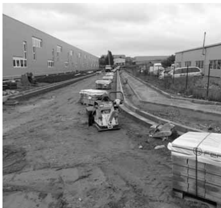
Stavba vozovky v průmyslové zóně.

Společnost PORR, a.s. a její dodavatelé pracovali na přelomu měsíců září a října ve výstavbě komunikace a inženýrských sítí v průmyslové zóně. Celá akce byla původně rozdělena na dvě etapy, nakonec však bylo dohodnuto, že bude stavba provedena bez rozdělení. Termín dokončení I. etapy byl stanoven na 30. listopadu 2020 a je pravděpodobné, že v tomto termínu budou dokončeny etapy obě dvě.