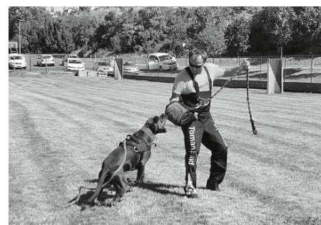
Ukázka nácvičku obrany psů plemene bandog.