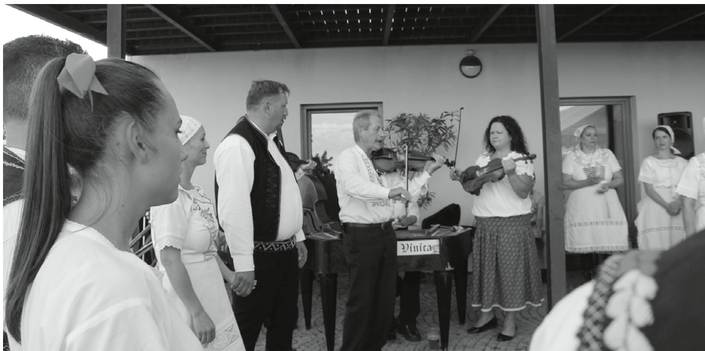
V rámci kulturního doprovodného programu byli všichni návštěvníci potěšeni tóny cimbálové muziky Vinica. To ještě vůbec netušili, že neuplyne mnoho dnů, a bude zpěv v naší zemi zakázán. Dějí se nám tu ale věci!