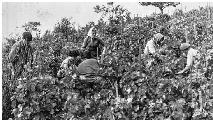
Takto vypadalo vinobraní před léty.