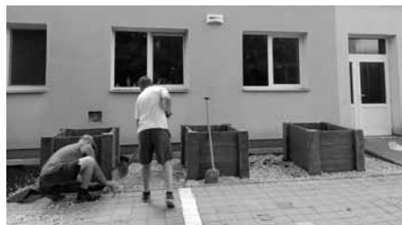
Zahrada mateřské školy – prostranství okolo vyvýšených záhonků bylo vysypáno oblázky.

V areálu mateřské školy byla odebrána zemina v místech, kde byly vybudovány vyvýšené záhonky. Okolí záhonků bylo vysypáno oblázky.