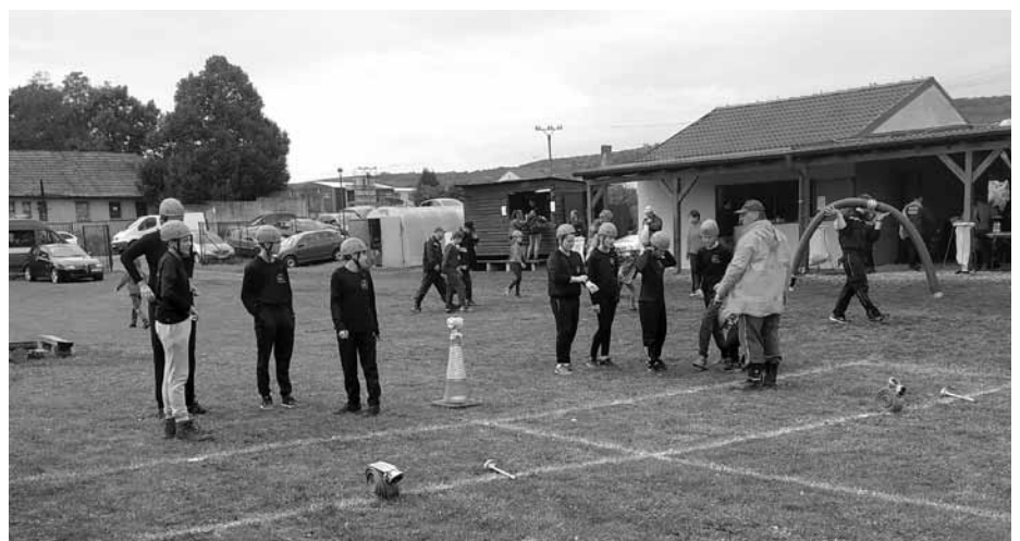
Velkopavlovický hasičský dorost na zářijových kláním příliš neoslňl. Dal si úkol – vše napravit o jarních soutěžích.