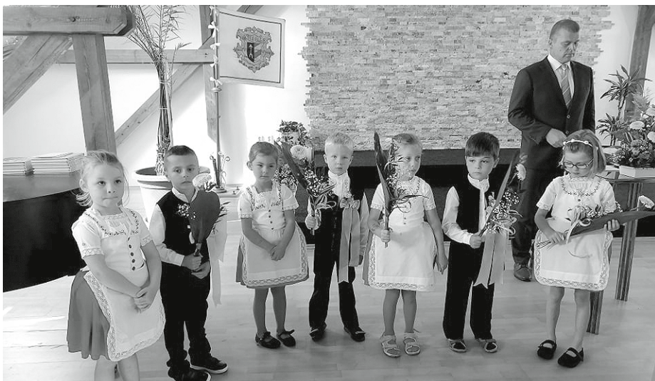
Občanský obřad Vítání občánků si už snad bez písniček a říkadel v podání krojovaných dětí ze školky nedokážeme představit.

Naši nejmladší "nováčci" z Mateřské školy Velké Pavlovice překonali slzičkové období, už si zvykli na odloučení od maminky.