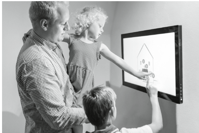
Děti jsou fascinovány pohyblivými obrázky na zdech sklípku.