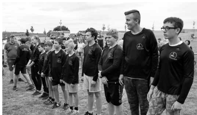
Velkopavlovický hasičský dorost.