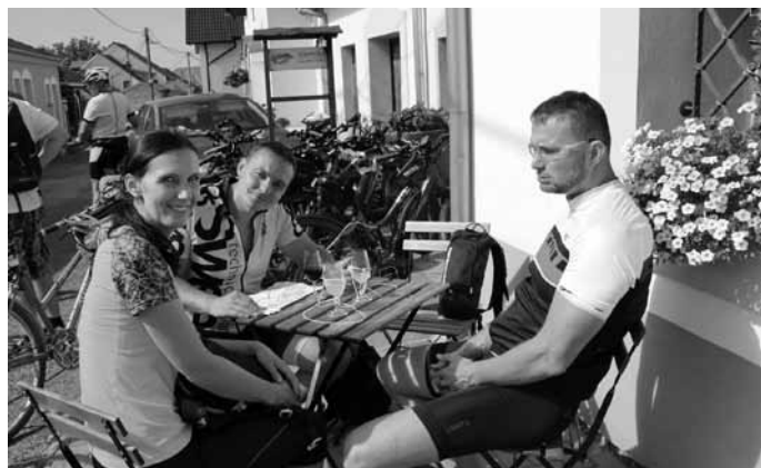
Jednou z příjemných burčákových zastávek byla i sklepni vesnička Kraví hora u sousedů v Bořeticích.