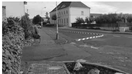
Křižovatka u benzinky po úpravě dopravního značení.

Křižovatka ulic Tovární, Za Dvorem a Nádražní dostala nový rozměr. O úpravě nepřehledné a nejasné křižovatky se debatovalo dlouho. Jeden z prvních návrhů úprav pochází z roku 2008 a je možné, že už byly nějaké nápady i dříve.