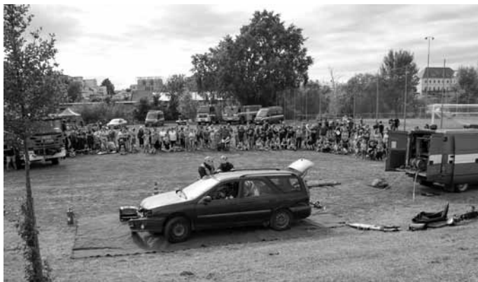
Ukázka vyproštění zaklíněné osoby z osobního automobilu.