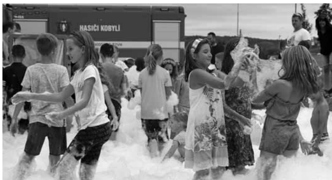
Nejskvělejší bod oslavy – pěnové „sněhové“ závěje, které ani trošku nestudily.