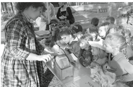
Školčata se podívala, jak z ovčího rouna vznikne klubko vlny. Zázrak!

Ve čtvrtek dne 10. září 2020 se děti tříd Kotátek a Berušek Mateřské školy Velké Pavlovice zúčastnily výletu do Hustopečí, na akci s názvem "Den plný aktivit pro děti, kroužky,