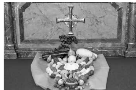
Pokud jste neměli čas se do kostela vypravit, můžete se pokochat alespoň těmito fotografiemi...