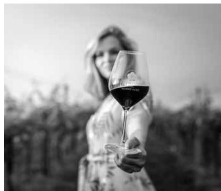
Modré Hory - pro našince domovina, pro návštěvníky kouzelný ráj na zemi.

Než se letošní červená vína dostanou na trh, poleží si aspoň 18 měsíců v sudech. „Počkat se vyplatí. Pro netrpělivé doporučuji sáhnout po starších ročnících nebo šťavnatých rosé vyráběných ze stejných modrých hroznů, jen jiným technologickým postupem,“ doporučil Stávek.