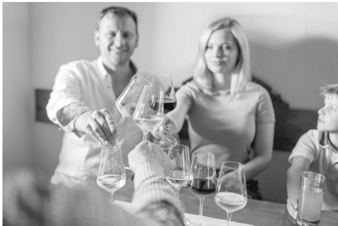
Dospělí jsou fascinováni opojnou chutí vynikajících vín.

Inspirací k interaktivní prohlídce rodinného habánského sklepa bylo Lacinovým Loisium v rakouské vinařské oblasti Wachau. „ Jsou tam kilometry chodeb, které jsou čas od času protkané nějakým zajímavým interaktivním prvkem. Například v kádi na hrozny promítají, jak vypadalo vinobraní ve Wachau před sto lety. Synovi se zase líbilo, když mohl v průhledech v barikových sudech pozorovat, jak dušičky lisují hrozny. Chtěli jsme zkrátka udělat něco, co by bavilo úplně všechny, “ přiblížil vinař.