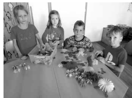
Kdo má rád skládání ze stavebnic, je v družině ve svém živlu.