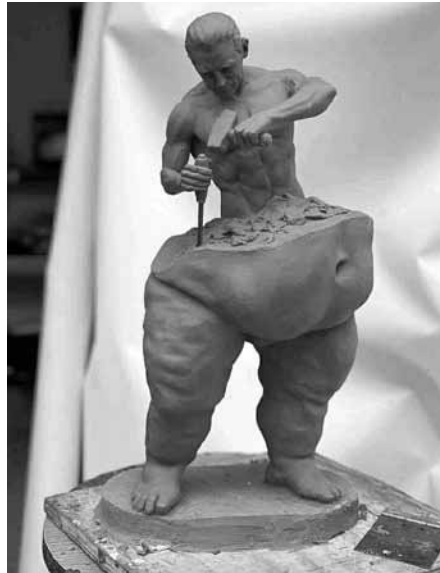
Otékají vám nohy? Možná máte problém s lymfatickým systémem. Začněte jej řešit.

Je důležité neopomenout na nutnost spolupracovat ale i s internisty, angiology, flebology, onkology, chirurgy. Velice důležitá je vůle a přesvědčení klienta, že se stav může zlepšit. Pro maximální délku efektu se nesmí zapomínat i na péči v domácím prostředí, jako je péče o kůži, nošení kompresivních punčoch