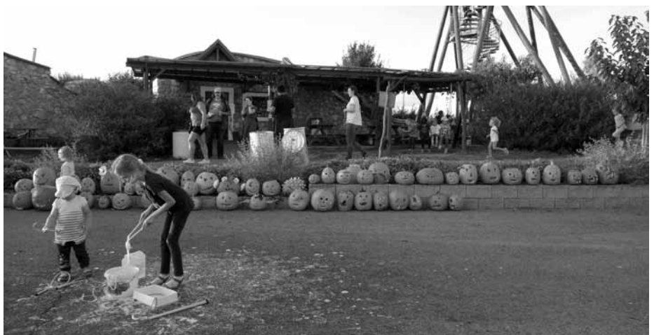
Oranžoví svítící podzimní strašáci rozzářili po soumraku prostranství pod Slunečnou. Podzimáčky s roztodivnými obličejí byli nadšeni především překvapení turisté.