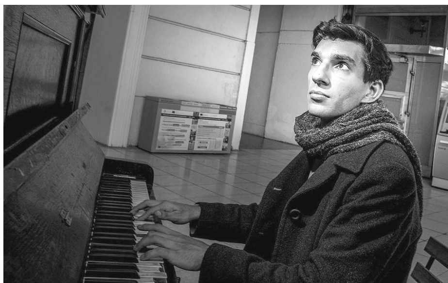
Slavný klavírista Robert Ferenc byl naším městem okouzlen. Nyní se na své posluchače u nás těší v čase adventním.

V neděli, dne 13. září 2020, si obdobné vystoupení mohli vychutnat také milovníci hud-