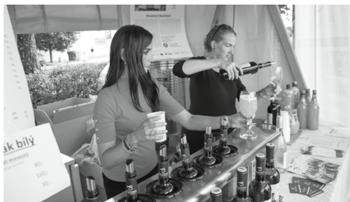
Burčák – bez něj by ani Velkopavlovické vinobraní ani Zarážení hory s burčákovou zábavou opravdu být nemohly.