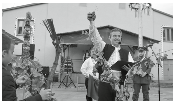
Hora zaražena, teď už zbývá jenom vinobraní. Doufejme, že bude letošní sklizeň bohatá a vína ročníku 2020 kvalitní a lahodná.