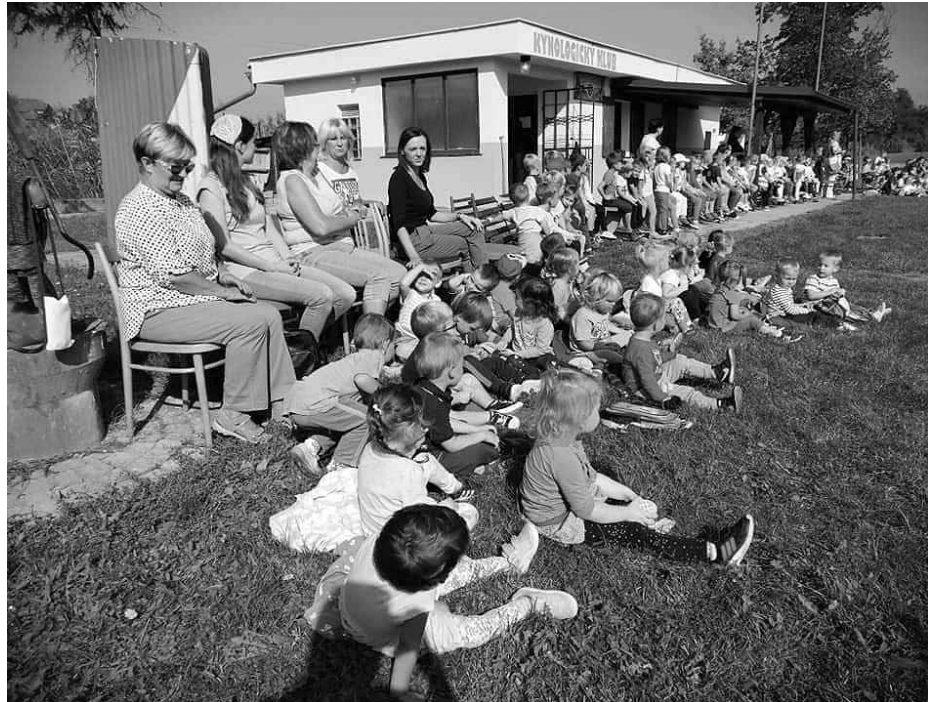
Děti pejsky milují. Díky našim kynologům se dověděly, že pes není jen milý kamarád, ale také šikovný pomocník, který nám dokáže zachránit i život.