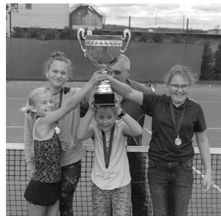
Zlaté holky z velkopavlovického Tenisového klubu Slavoj. Že by budoucí „Kvitky“?