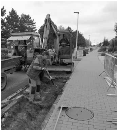
Budování nových podélných stání na ulici Dlouhá.

V ulici Dlouhá byla pracovníky služeb města v závěru letošního září vybudována poslední místa na parkování vozidel. Tyto plochy na frekventované ulici byly zhotoveny pouze tam, kde to bylo dohodnuto s majiteli přílehlých rodinných domů. Náklady u použité zámkové dlažby jsou vyšší, ovšem tento druh umožňuje částečné vsakování dešťové vody do půdy.