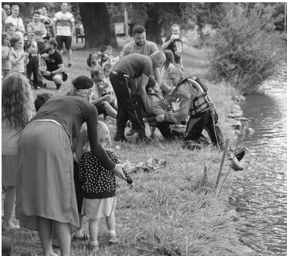
Ukázka záchrany tonoucího z vod rybníka.