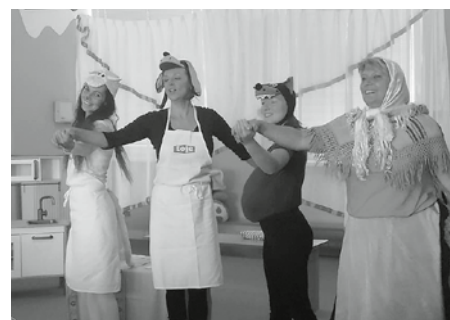
Paní učitelky v rolích nejen protagonistů pohádky Jak pejsek s kočičkou pekli dort, ale hlavně v naprosto nových rolích herců dětského divadélka.

Krásné podzimní dny všem přeje kolektiv Mateřské školy Velké Pavlovice