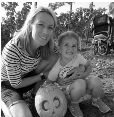
Také letos se neslo Veselé dýňobraní pod rozhlednou Slunečná na vlně veselé nálady. Děti ani rodiče úsměvy nešetřili.