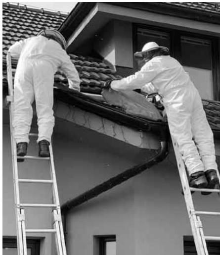
Likvidace vosího hnízda, i k takovým nepříjemným událostem voláme hasiče.

V úterý (17. září 2020) brzy ráno (5:22) vyjžděli velkopavlovičtí hasiči k požáru bytu na ulici Růžová ve Velkých Pavlovicích. Z hasičské zbrojnice vyjelo prvně vozidlo MAN CAS 20 se čtyřmi hasiči a minutu poté i Tatra 815-7 CAS 30 se třemi hasiči. S ohledem na krátkou vzdálenost byli na místě požáru téměř ihned.