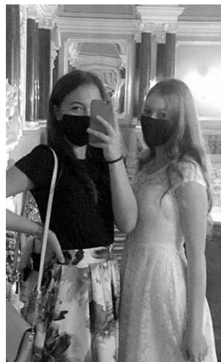
Netradiční selfičko z Mahenova divadla. V době koronaviru – jak jinak než s rouškou.