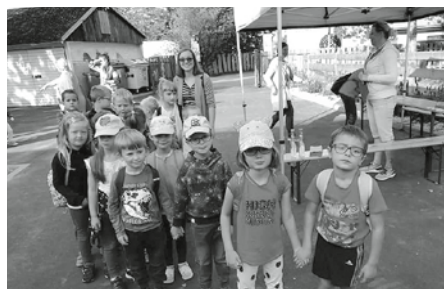
Děti z mateřinky navštívily Veletrh zájmových aktivit v hustopečské Pavučině.

sport a zábava". Jednalo se o projekt MAP II vzdělávání SO ORP Hustopečsko. Místo konání CVČ Pavučina - Hustopeče.