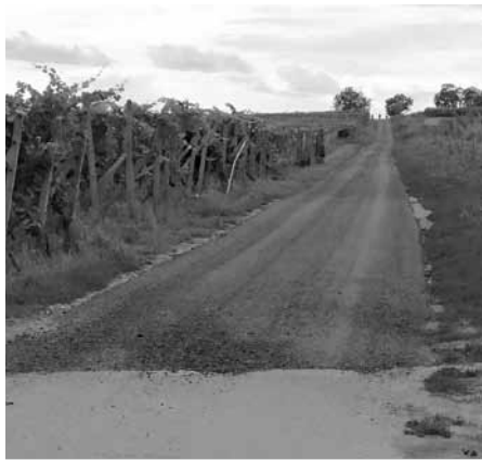
Opravená cesta, která je současně cyklotrasou Krajem André mezi Velkými Pavlovicemi a Starovičkami.

Kdo má v oblíbě cyklistiku a používá při výletech k Pálavě cestu přes viniční tratě směrem na Starovičky, může být spokojen. Starovičským a Velkopavlovickým se podařilo v srpnu letošního roku zpevnit kompletně úsek cesty z Velkých Pavlovic až do Staroviček. Komunikaci, po které vedou dvě cyklotrasy, je nyní možné bez větších problémů využívat i po dešti. Opravu prováděla společnost STRABAG. Na opravě úseku ležícím na katastru města Velké Pavlovice se finančně podílela společnost Mandloň s.r.o..