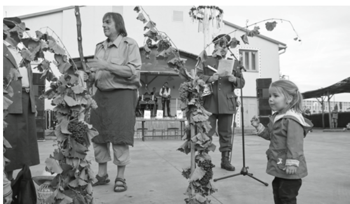
Mňam! Sladký hrozník plný sluníčka a zdravíčka je prostě neodolatelný! Jen aby se hotař s obecním policajtem nedivali!