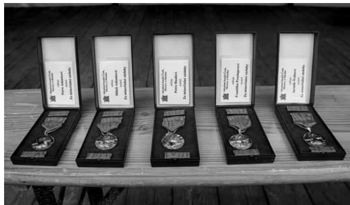
Čestné medaile pro oceněné hasiče ze SDH Velké Pavlovice.