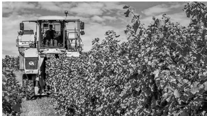
Takto vypadá vinobraní v současné době.