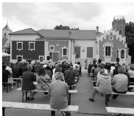
Nové Muzeum Senica – dříve byla tato budova letohrádkem, poté sokolovnou a dnes se v jejích prostorách můžete dozvědět spousty zajímavých poznatků z historie i současnosti města Senica a okolí.

Snahou Města Senica bylo vytvořit moderní expozici se všemi technologickými vymoženostmi, která svou interaktivností zaujme