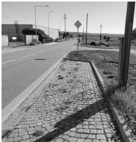
Ulice Hodonínská – budování zatravněného prostranství mezi chodníkem a parkovištěm.

V ulici Za Dvorem, u parkoviště před bytovým domem, byl upraven terén tak, aby mohl být následně - jen pouhý den na to, postaveny sloupky a natažen drátěný plot okolo pozemku v majetku města.