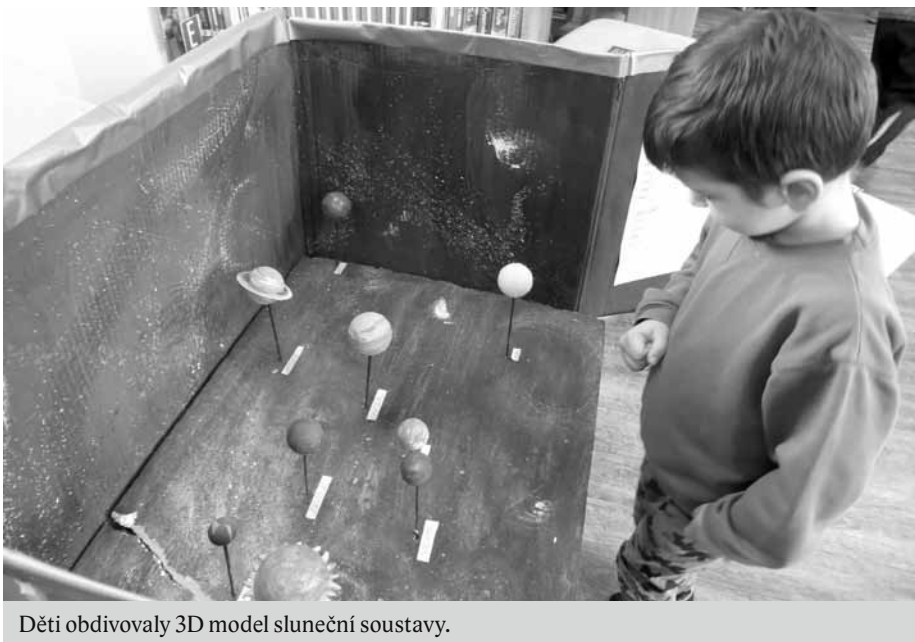
Děti obdivovaly 3D model sluneční soustavy.

Pak musely prokázat velitelce posádky (knihovnici) svou fyzickou zdatnost a dovednosti nezbytné pro let do vesmíru. Pak už stačilo jen usednout do raketoplánů, připoutat se a vyrazit do Sluneční soustavy s tenkou knížečkou Vladimíra Sochy Cesta do vesmíru.