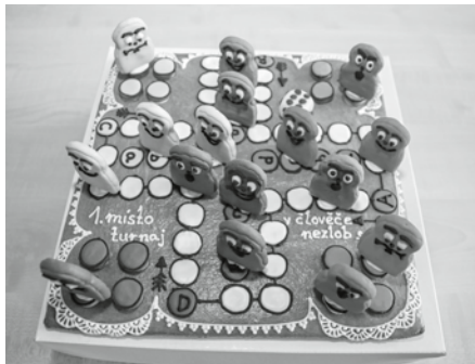
Úžasné, co říkáte? Škoda takového umělecké dílo rozkrájet a slupnout.