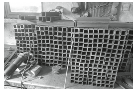
Kovové konstrukce potřebné k výrobě nového kvalitního posezení.

V letošním roce by mělo být hotovo a k dispozici tolik stolů a lavic, aby vyšlo posezení pro hosty kolem celého tanečního sóla (hřiště za sokolovnou). Lepené smrkové desky byly dodány zdejším firmou – Stolařství Miroslav