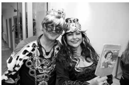
Kdo by neznal pohádku o Sněhurce? A její zlé maceše...