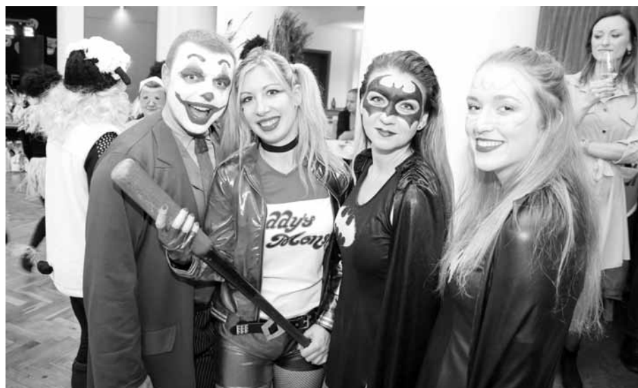
Šibřinkové masky s příchutí amerického filmového průmyslu a Hollywoodu.