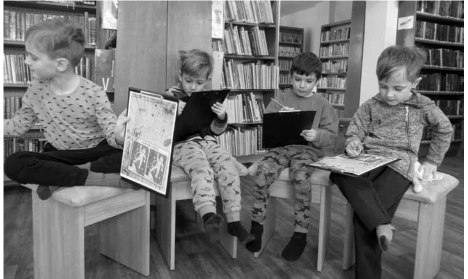
Během besedy děti vyplnily hravé kvízy a poslechly si poutavé čtení.

A jak náš společný výlet do vesmíru vypadal? Nejprve si děti vybraly kartičku, kterou postavu ze známých kosmonautů (včetně zvířecích představitelů) budou představovat. Dozvěděly se tak o slavných astronautech jako byli Armstrong, Glenn, Gagarin nebo „náš“ Remek. A také, že do vesmíru necestovali jen lidé, ale i pes a šimpanz.