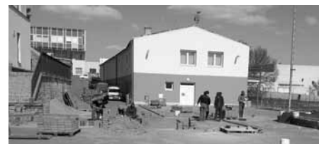
Oprava vozovky a parkoviště u vstupu do Vinných sklepů Františka Lotrinského.

Areál TJ Slavoj Velké Pavlovice se v měsíci dubnu dočkal další rekonstrukce, tentokrát předláždění prostor zámkovou dlažbou, a to příjezdové komunikace do areálu a také parkoviště před vstupem do Vinných sklepů Františka Lotrinského. Zde se dříve velmi často pohybovala těžká technika, která způsobila značné poškození povrchu a prohloubeniny. V rámci předláždění proběhla i výměna odtokových žlabů, které byly zborcené a nefunkční.