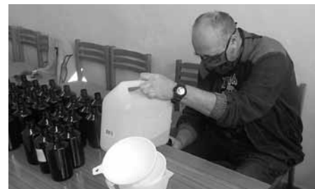
Lahvování bezoplachové dezinfekce Anti-Covid na ruce pracovníky Služeb města.

Antibakteriální tekutina byla na radnici doručena ve velkoobjemových 25 litrových kanystrech, bylo ji tedy třeba nalahvovat do PET lahví a opatřit samolepkou s návodem k použití. Těto činnosti se zhostili pracovníci Služeb města.