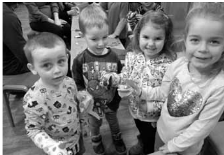
Což takhle si v knihovně vyrobit ponožkového maňáška?