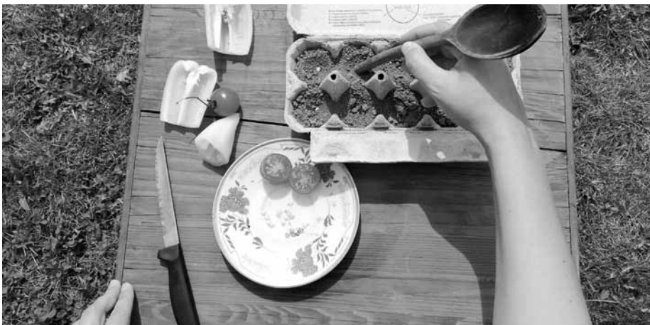
Což takhle si vypěstovat v kartónku od vajíček své vlastní sazeničky rajčat či paprik?