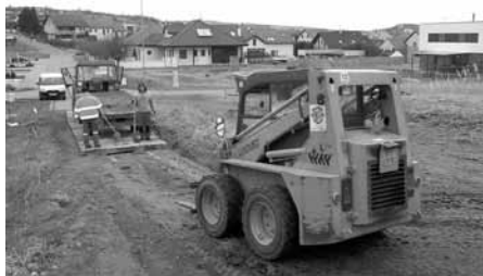
Vozovka na ulici Kopečky bude čistější, díky zpevnění přilehlé polní cesty betonovými pražci.

Koncem letošního února se pracovníci Služeb města pustili do záslužné činnosti – pokládka zpevňujících betonových pražců na polní cestu v trati Ostrovec, s vjezdem do obytné zóny Kopečky. Tím se výrazně sníží vytažování bláta a nečistot na zámkovou dlažbu místní komunikace, což jistě nejvíce ocení občané bydlicí právě v této lokalitě.