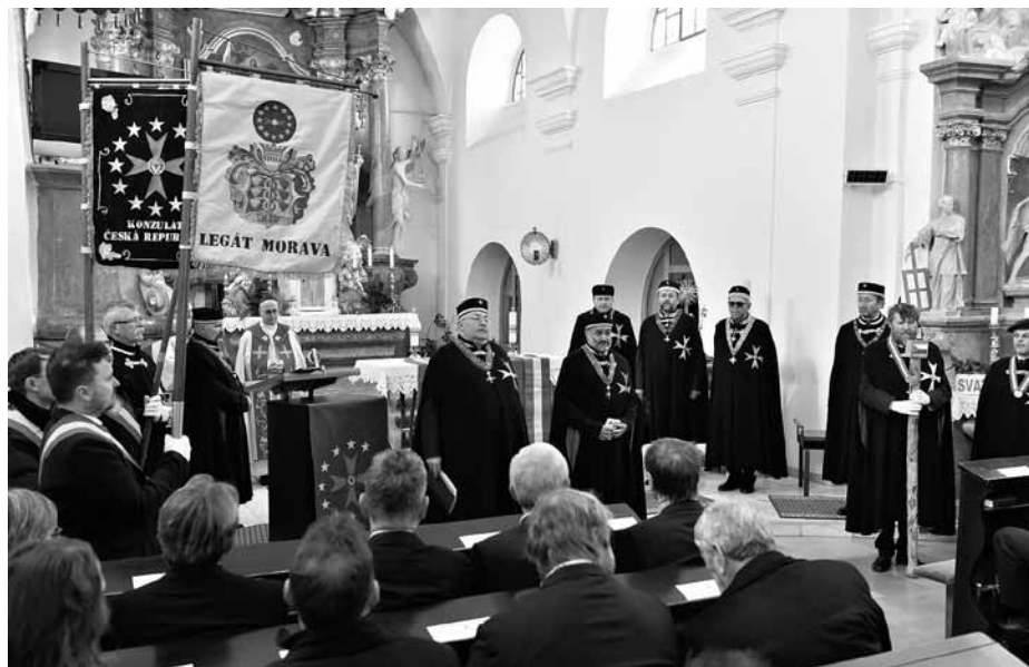
V rámci rytířské slavnosti, konané v důstojných prostorách velkopavlovického kostela Nanebevzetí Panny Marie, byli do řádu přijati noví členové.