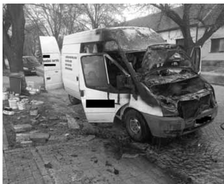
Požár auta je obvykle hodně velká „rychlouka“, během pár mžiků je na popel.

hořícího vozidla na hasičskou zbrojnici a v té době ještě kabina ohněm zasažena nebyla. Už víte, proč chtějí hasiči při kolaudacích dveře z garáží, které jsou součástí domu, se zvýšenou odolností proti požáru? Není to kvůli nim, je to kvůli vám!