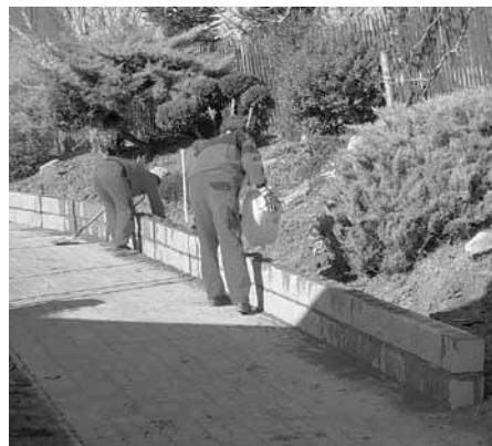
Stavba zpevňovací zídky podél chodníku za prodejnu COOP.