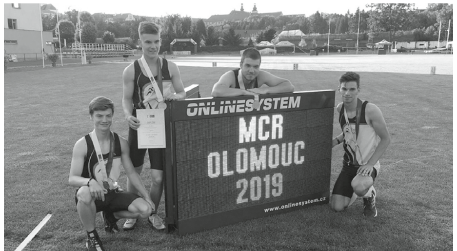
Mistrovství ČR v Olomouci, rok 2019 – stříbrná medaile zacinkala ve štafetě 4× 100 m.

Chtěl jsem zkusit něco nového, konečně nekoaktivního. Atletika nabízí mnoho rozdílných