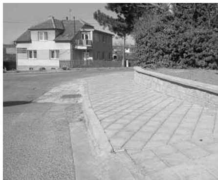
Chodník na křižovatce ulic Herbenova a Náměstí 9. května.

Začátkem dubna byly obnoveny práce na chodníku, který vede z ulice Herbenova na Náměstí 9. května. V pondělí 6. dubna 2020 byla dořezána dlažba, která potom byla zhutněna, aby byl chodník průchozí. Další práce jsou nyní ze strany města opět pozastaveny, než bude provedena výstavba oplocení soukromého pozemku.