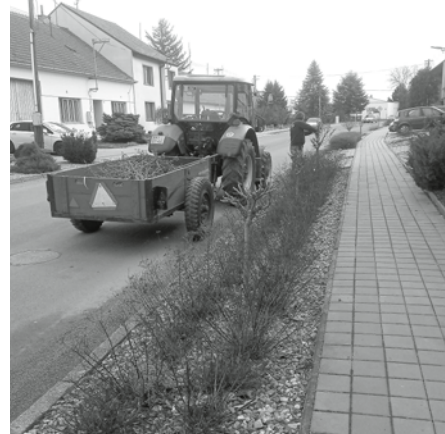
Ulice Pod Břehy – zahradnické práce v měsíci únoru.

Málokdy se dostanou pracovníci Služeb města k údržbě zeleně v průběhu měsíce února. Avšak počasí se v letošním roce příliš ročním obdobím a jeho zákonitostmi neřídí. Proto bylo možné se i v polovině února namísto odklízení sněhu a solení komunikací zabývat takovými činnostmi, jakými jsou zahradnické práce.