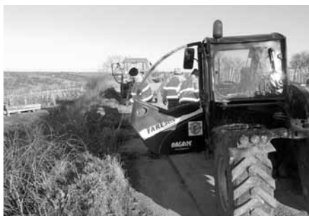
Vinařská trať Stará hora – oprava zpevněné polní cesty.

Také začátkem měsíce března využili pracovníci Služeb města vhodného relativně teplého počasí a před zahájením jarních prací ve vinnících se pustili do opravy polní cesty ve vinařské trati Stará hora.