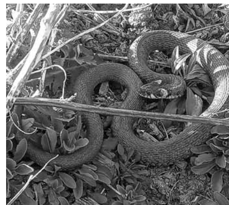
Nádherné stvoření! Tohoto hada není třeba se obávat. Je naprosto neškodný.

V neděli, dne 12. dubna 2020, se na dvorku jednoho velkopavlovického rodinného domu vyhřívala téměř metrová užovka. Hasiči byla šetrně odchycena do kbelíku a odvezena do volné přírody, tam kam patří a kde jí bude nejlépe.