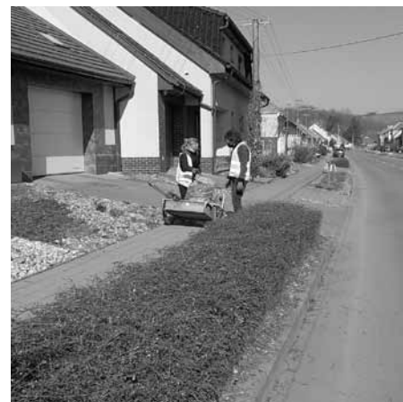
Pracovníci Služeb města se starají o zeleně v ulici Pod Břehey.

sledkem. Začátkem letos tolik prosluněného měsíce dubna se pracovníci pustili do práce s údržbou předzahrádek na ulici Pod Břehey. Předzahrádky jsou chloubou našeho města a mnoho návštěvníků nám jejich malebnost, uhlazenost a upravenost závidí.