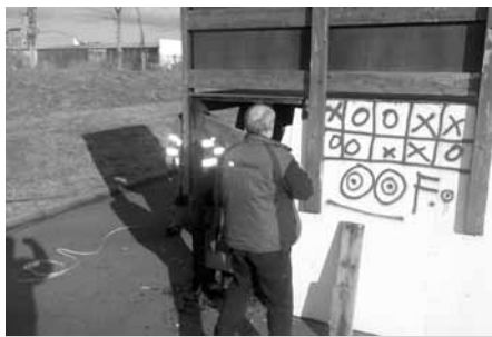
To se bude vyvádět! Jen pozor na úrazy! Bezpečnost a zdravý rozum na prvním místě.

Pracovníci služeb města využili takřka jarně příjemného, teplého a slunečného počasí konce února a pustili se do opravy prvků pro freestylové sporty ve skateparku u Trkmanky. Po této generální opravě je skatepark řádně připraven na další sezónu.