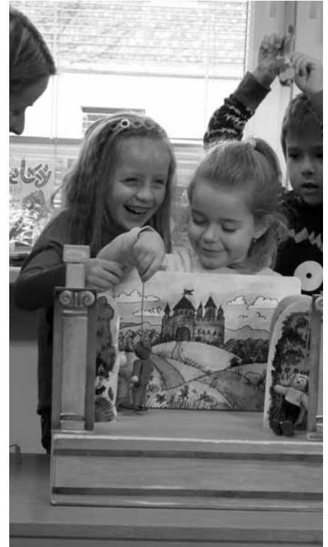
Na březnovém RaČte si děti společně zahrály s loutkami příběh přečtený knihovnicí