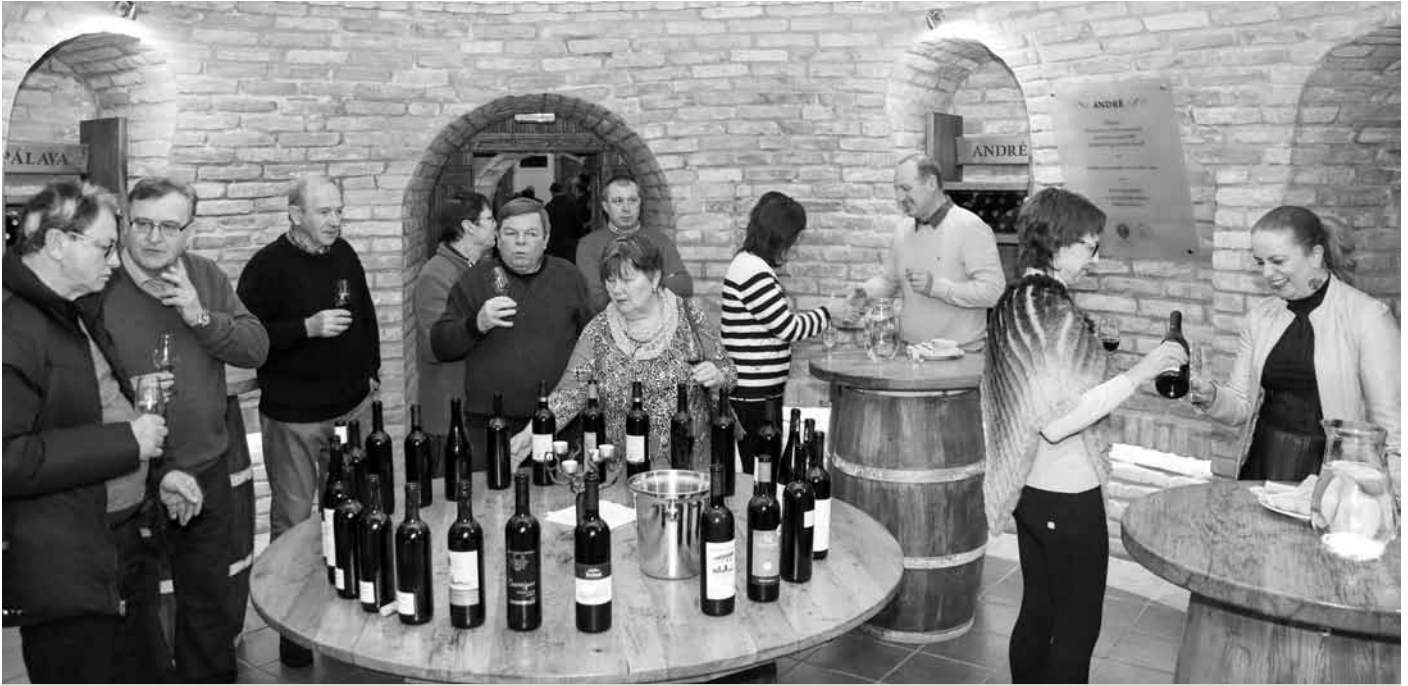
Vinné sklepy Františka Lotrinského jsou již tradičním zázemím pro konání komorního setkání O víně při víně.