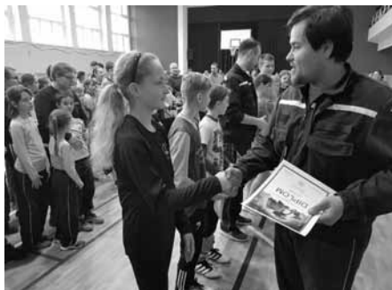
V uzlovací soutěži v Moravské Nové Vsi obsadilo naše družstvo starších žáků čtvrtou příčku.

Velkopavlovičtí mladí hasiči se v sobotu 7. března 2020 vydali na soutěž do Moravské Nové Vsi. Soutěž pod názvem „Neoveská hala“ se skládala ze štafety požárních dvojic a uzlovací štafety. Mladí hasiči vyslali do boje jeden tým starších žáků, který po osmém místě ze štafety požárních dvojic a čtvrtém z uzlování, skončil v celkovém součtu na pátém čtvrtém místě.