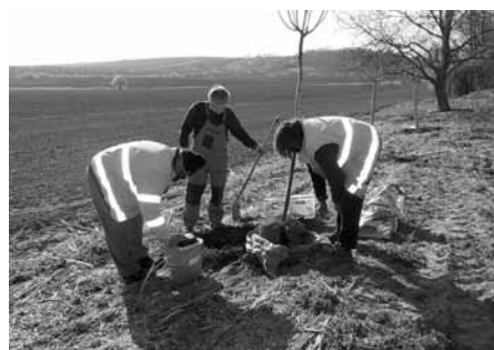
Výsadba mladých stromků za hranicemi města.

Začátkem dubna vysadili pracovníci Služeb města v katastru nové vzrostlé sazenice stromků, kterými doplnili stromořadí a aleje. Tato výsadba tvoří základ biokoridorů v extravilánu města. Výsadba krajinné zeleně ve větším měřítku proběhla v rámci projektu Založení krajinných prvků v k.ú. Velké Pavlovice I na konci roku 2018 a další rozsáhlá výsadba bude následovat v rámci projektu Založení krajinných prvků v k.ú. Velké Pavlovice II.