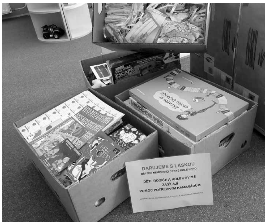
Tento balík našitých roušek a dárečků byl doručen dětské nemocnici v Černých polích v Brně.