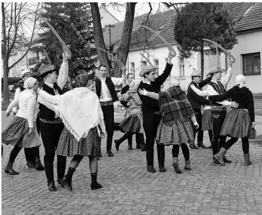
Hanákoslovácký krúžek se protančil celým městem, na snímku na ulici Hlavní před Rodinným vinařstvím Krejčířík.

zazpívali a zatančili u hospodářů ve Vinařství u Krejčířků, ve Vinařství u Lubomíra Zborovského a v Hotelu Lotrinském. Hodně dobře jsme se všude poměli, vynikající ochutnávky vína, sem tam nějaká slivovica – meruňkovi- ca, boží milosti, donuty, chleba se škvarka- ma nebo různými domácími pomazánkami, snacky, chlebičky, slané tyčinky, buchty... no prostě ostatky tak, jak mají být. I stárek měl