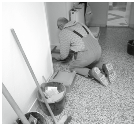
Oprava toalet v budově velkopavlovického gymnázia v období jarních prázdnin.