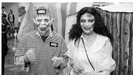
Že by trestanec z nedobytné vězeňské pevnosti Boyard s obětí jeho krvežíznivého běsnění?