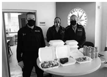
Vynikající obědové menu velkopavlovické Restaurace Vinopa si v čase pandemie koronaviru den co vychutnávali policisté z nedalekých Hustopečí.