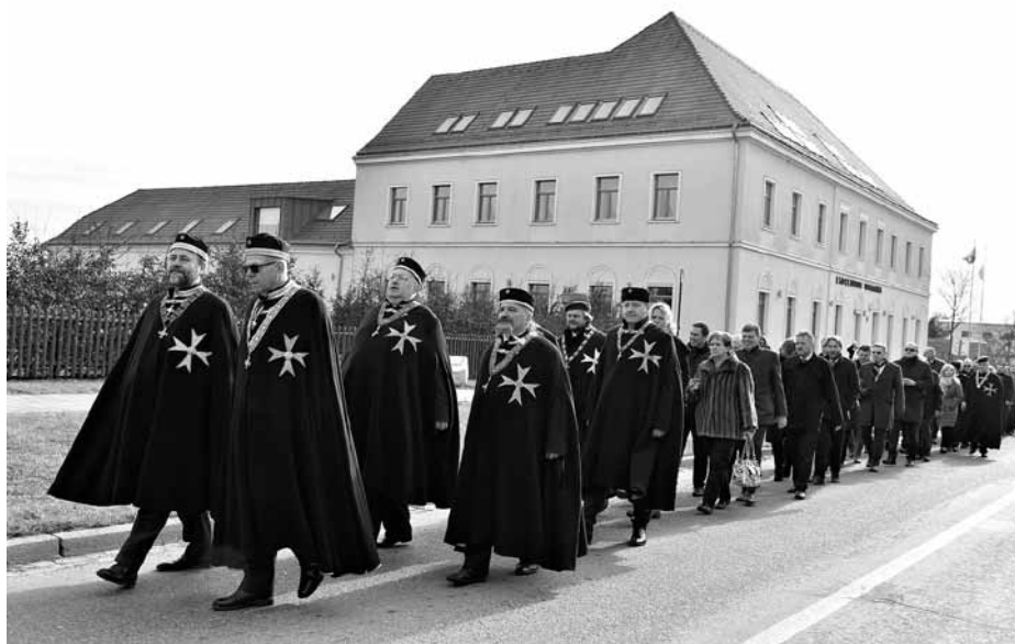
Slavnostní a na výsost důstojný průvod rytířů vína městem Velké Pavlovice.