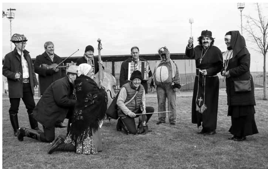
Velkopavlovické ostatky byly společně s průvodem zahájeny na nádvoří Ekocentra Trkmanka.

V letošním roce jsme navštívili a popřáli vel- kou úrodu, hodně zdraví rodině i dobytku,