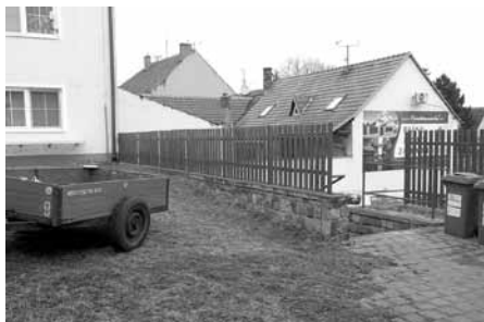
Oprava plůtku u bytovky na ulici Boženy Němcové.

Latkový plot u bytového domu v ulici Boženy Němcové poznamenal zub času, a tak bylo nutné poškozené části vyměnit. Opravy plotu se zhostili koncem února zaměstnanci Služeb města.