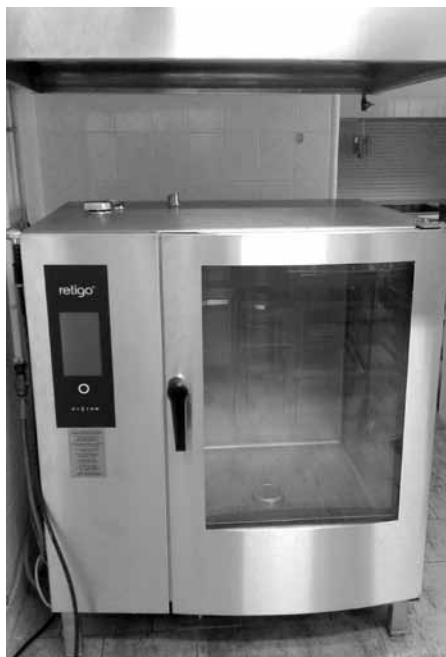
Nový konvektomat – školní jídelna ZŠ.

Proto byl pořízen nový, a to za částku 453.000 Kč a v současné době je již nainstalován. Jakkmile se žáci, studenti a personál vrátí do škol, bude už fungovat a tak si bez jakékoliv technické přestávky všichni opět dobře pochutnají.