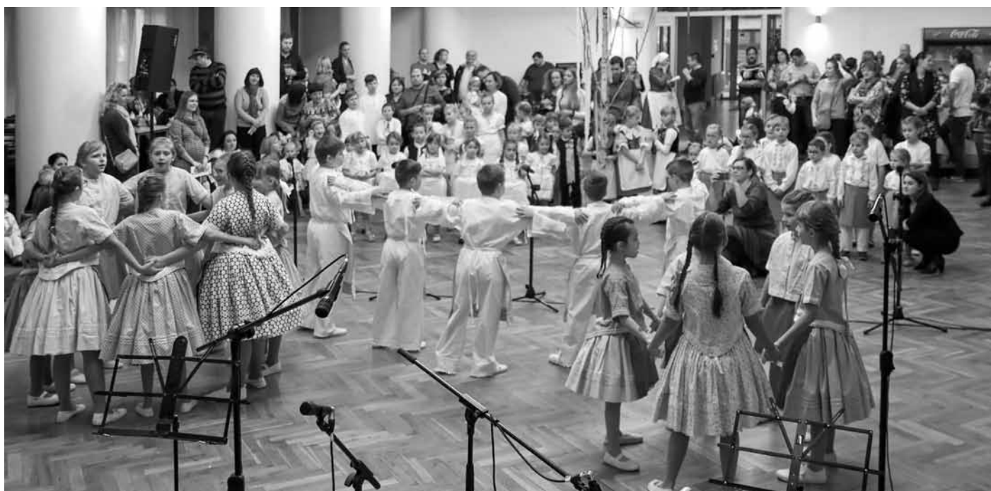
Veselo hodečky! Ale že nás bylo, co říkáte? Neuplyne mnoho vody a půjdeme hrdě v čele průvodu o skutečných krojovaných hodech...