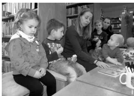
Co by to bylo za čtenářský klub RaČte bez předčítání z pěkné dětské knížky. Tentokrát to byla Zuzanka a ježeček.

Období nemoci se projevilo i na účasti pravidelného setkání klubu RaČte s dětmi pro děti předškolního věku. A tak jsme v listopadu sešli v knihovně v takovém „rodinném kruhu“ sedmi dětí a jejich doprovodu.