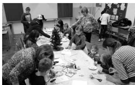
Všichni účastníci Předvánočního tvoření si z akce odnesli krásnou, vkusnou a hlavně vlastnoručně vyrobenou výzdobu.

výročí „sametové revoluce“. Žáci si pod vedením svých učitelů připravili mnoho zajímavých výtvarných i literárních prací, které si mohli hosté prohlédnout v přízemí v budově 2. stupně, kde byla nainstalována výstava žákovských prací s názvem 30 let svobody. K vidění zde byly dobové tiskoviny a knihy, psací stroj, mixér, staré fotoaparáty, diapositivy a další zajímavé předměty. Děti určitě zaujala i velmi pěkná výstava „retro“ hraček v budově 1. stupně. Atmosféru celého dne dotvořila předvánoční výzdoba školy, o kterou se postaraly paní učitelky a vychovatelky školní družiny.