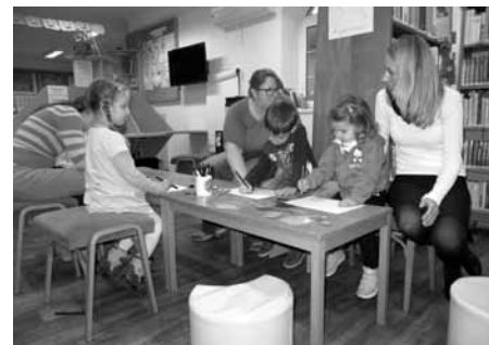
Klub RaČte je příjemným místem k setkávání a pohodovým chvílím. Proto jej velmi rády navštěvují i maminky.