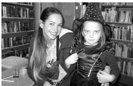
Na Halloween v knihovně dorazily maminky s dcerami.