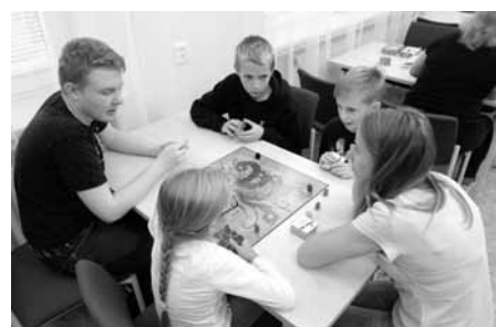
Deskové hry? Dokáží pěkně protočit mozkové závity! Jedna vynikající strategie střída druhou...

šli a donesli si dobrou náladu a ochotu zkoušet nové hry, ale také že se chovali ke hrám velice ohleduplně. Poděkování patří i vedení města, které nám zapůjčilo zasedací místnost na MÚ, a také všem přátelům, kteří dali všanc nejen své vlastní hry (které doplnili naše soukromé hry), ale také i ochotu a čas a pomáhali nám vysvětlit pravidla.