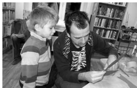
Na párty mezi knihami nechyběli ani tatínci se svými pány kluky.