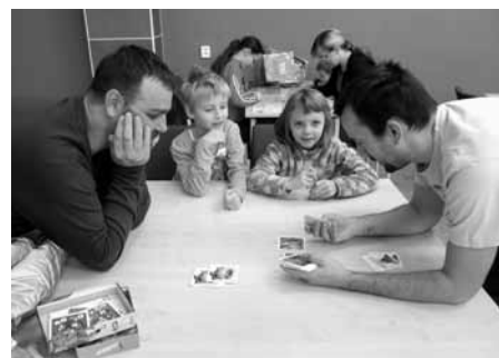
A jak se hraje tato hra? Profíci z klanu a přátel Gawlů vás rádi zasvěτί.

A co dodat na závěr? Že podle pořadatelů se akce moc povedla. Snad to podobně hodnotí i všichni, kdo si přišli „hrát“. Všem návštěvníkům děkujeme – malým i velkým, že nejen při-