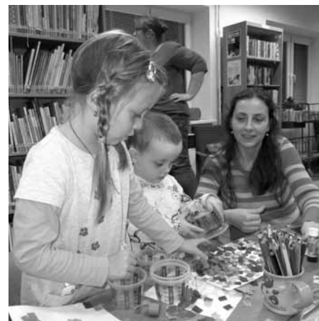
Jaký je podzim? Stačí natrhat na malé kousičky pestré papíry z barevné složky a odpověď je na světě. Přece kouzelný!