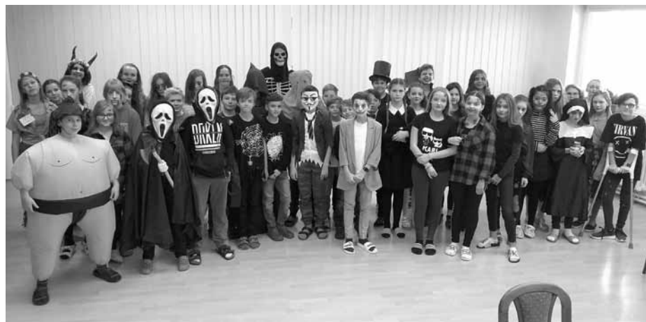
Především žáci nižšího stupně gymnázia se s neskrývanou radostí a nadšením vystrojili do roztočivých kostýmů, aby se aktivně zúčastnili Halloweenského tematického dne.

architektuře, jídle a také o zážitcích a vtipných historkách, které se mu na cestách přihodily.