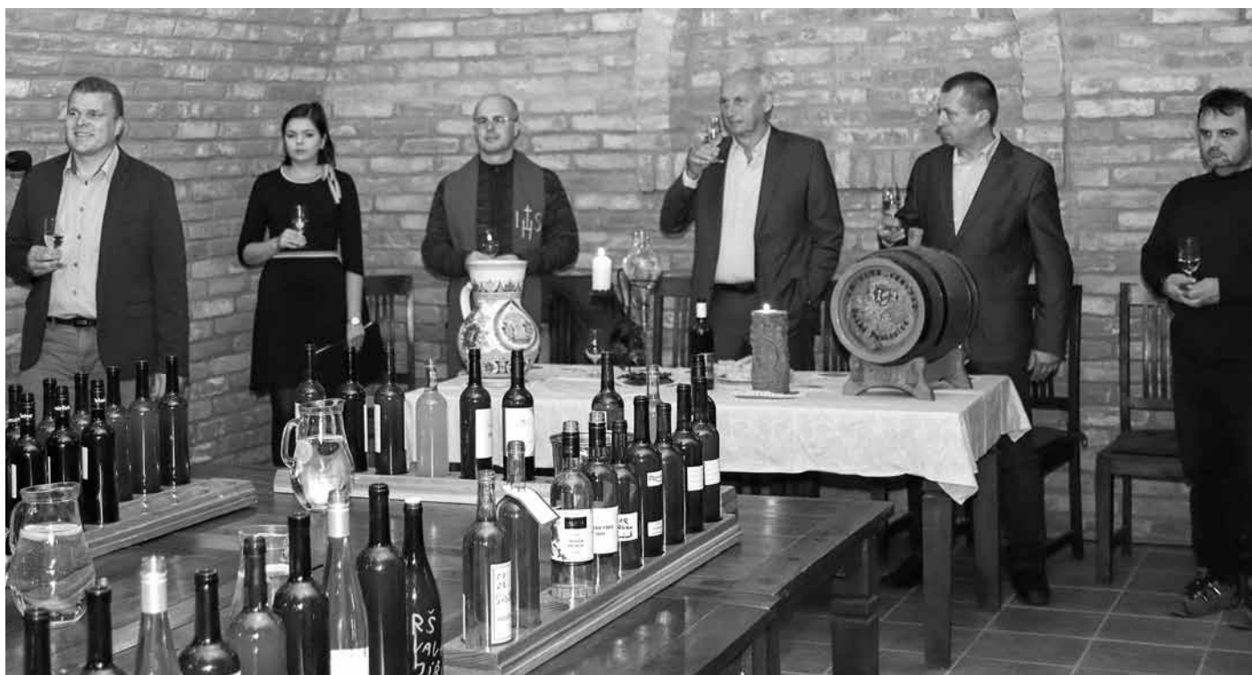
Žehnání vzorků mladých vín je vždy důstojnou a pro vinařský rok přelomovou událostí.