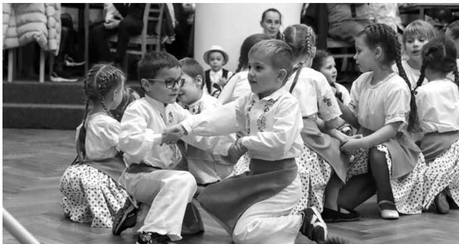
Na Kateřinských hodečkách samozřejmě nemohl chybět pořadající folklorní soubor Floriánek.