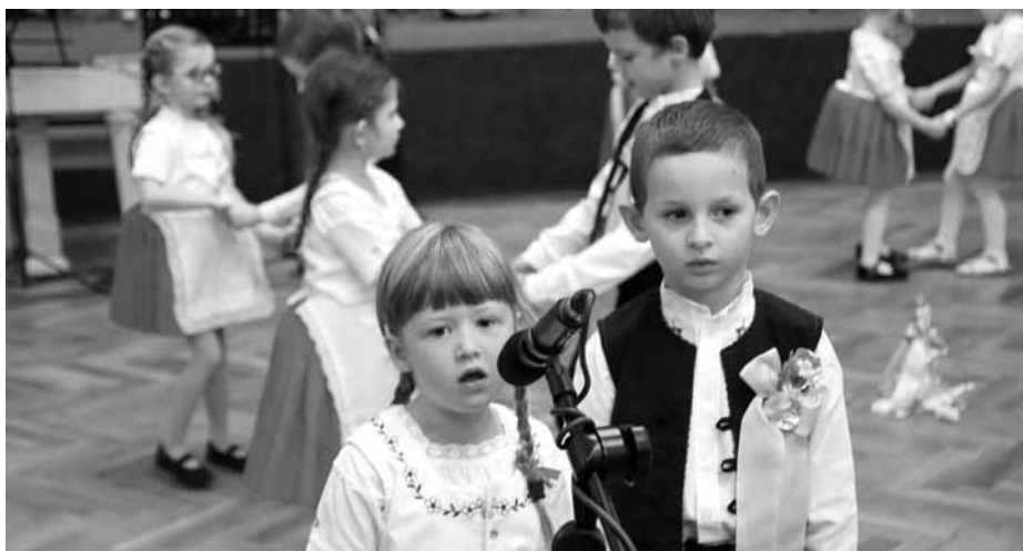
Své předtančení si na dětských hodečkách stříhl také Sadováček z místní mateřinky.