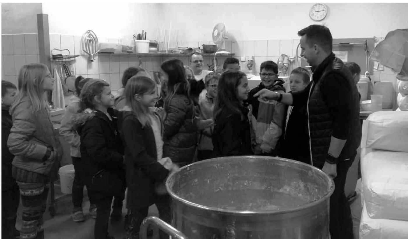
Návštěva čtvrtáků v pekařství u Pláteníků nebyla jen poučná, ale i sladká!