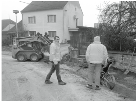
Oprava na vodovodním řadu před bytovým domem za lékárnou, na začátku ulice Nová.

V části ulice Nová byl ve spolupráci s VaK Břeclav, a.s. vyměněn vodovodní řad. Dne 11. listopadu 2019 byly dokončeny práce na pokládce chodníku od křižovatky ul. Růžová, Nová po křižovatku ulice Nová s Náměstím 9. května, který musel být z důvodu výměny rozebrán. V křižovatce Náměstí 9. května, ul. Herbenova a ul. Nová byla v havarijním stavu kanalizace a stále se na náklady VaK Břeclav, a.s. opravuje.