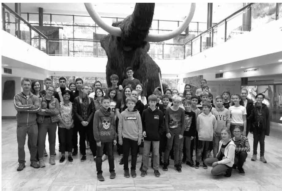
Nováčci našeho gymnázia, tedy žáci třídy prima a 1.A, si vyrazili na společný výlet do brněnského Anthroposu.

jsme si ukázali planety, hvězdy a souhvězdí, a dozvěděli jsme se, za jakých podmínek je můžeme sledovat z pohodlí domova. Konec prezentace vyplnil krátký film. Všichni studenti si z tohoto zájezdu odnesli mnoho nových poznatků a zajisté si ho i užili.