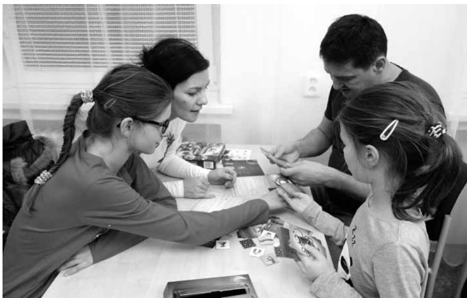
Deskovky? Zábava, která tmelí rodinu!

Návštěvníků v listopadovou sobotu na akci Deskové hry pro podzimní dny bylo požehnaně, během čtyř hodin se u stolů vystřídalo minimálně 50 malých i velkých příchozích. A protože se různě prostřídali, zatímco jedni odešli a druzí zase přišli, nebylo v sále ani přecpáno ani poloprázdno, ale přesně tak akorát.