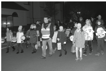
Lampionový průvod děti prostě baví. Jak by ne, je to prostě taková „jiná“ zábava a je takto organizovaná jen jednou do roka. Proto si ji nechá ujít jen málokdo!

V neděli 17. listopadu 2019 prošel našim městečkem už tradiční lampionový průvod. Příznivců se před radnicí sešlo, stejně jako