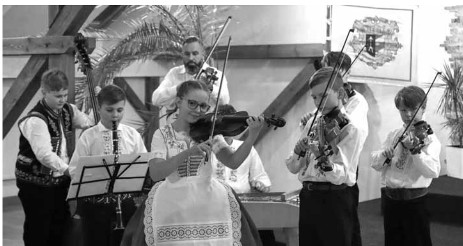
O kulturní program se postarala místní dětská cimbálová muzika Palička.