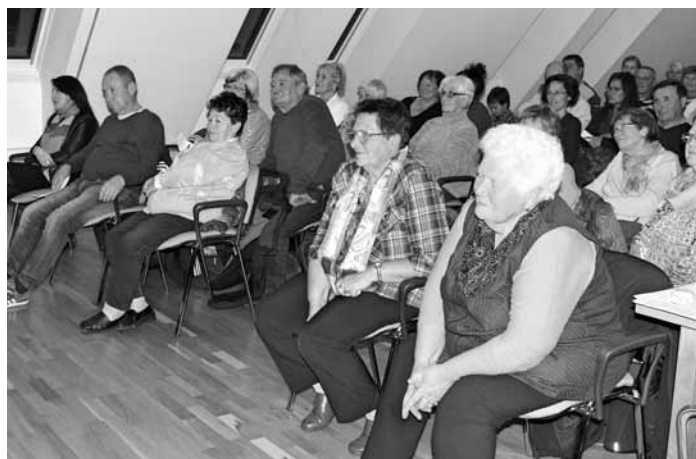
Početné obecnstvo, složené z velké většiny bývalými a současnými žáky, si s chutí vyslechlo krásný koncert.