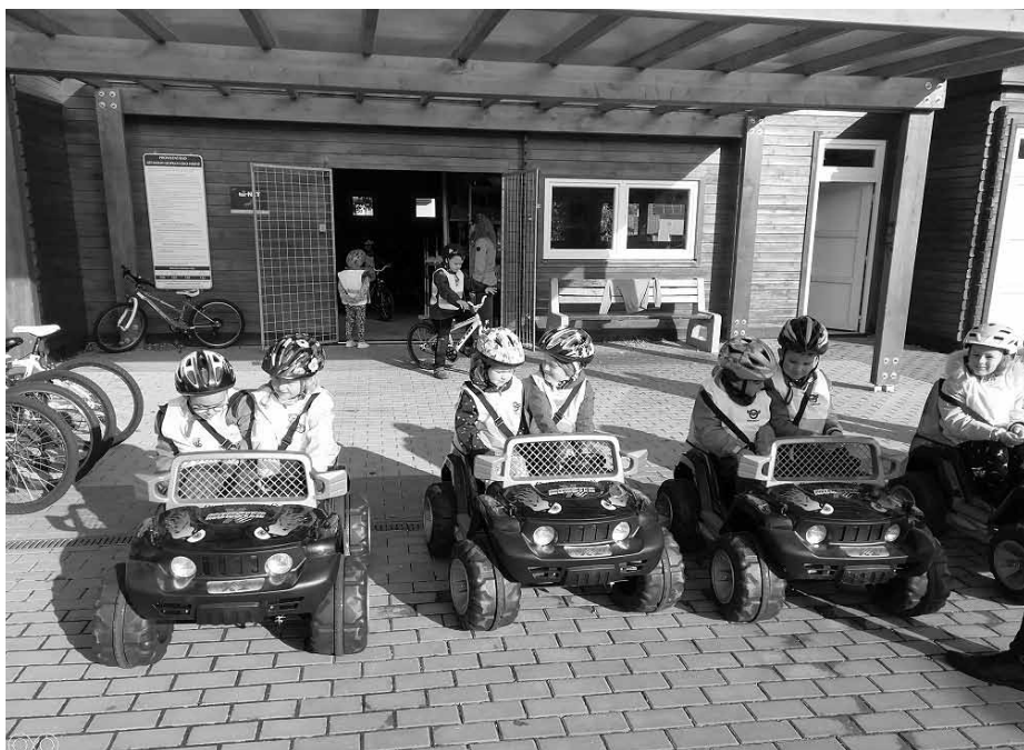
Předškoláci na dopravním hřišti v Hustopečích.