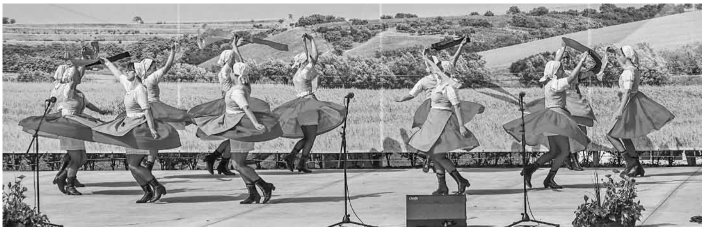
Hanáckoslovácký krúžek na Folklorním festivalu Kraj beze stínu v Krumvíři.

Vinobraní, Benefiční koncert a Česko zpívá koledy ve Velkých Pavlovicích, Vítání jara v Lednici a Folklorní festival Kraj beze stínu v Krumvíři.