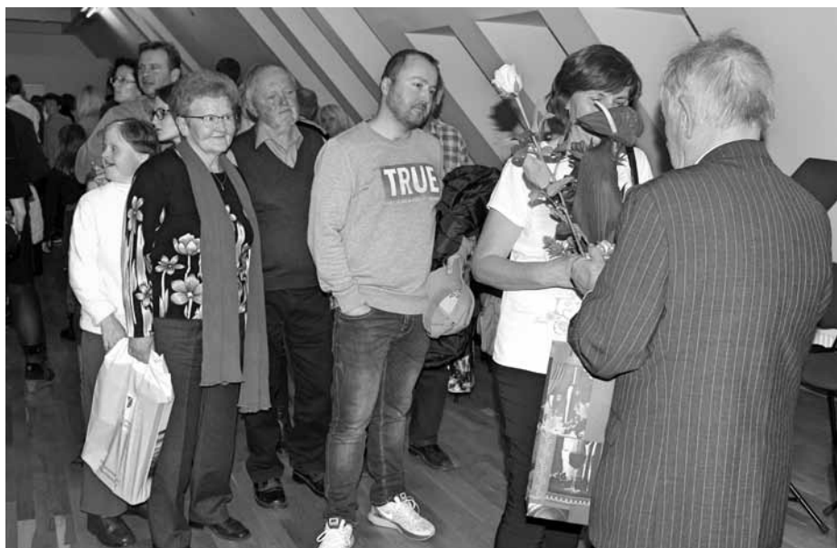
Nekonečná řada gratulantů...