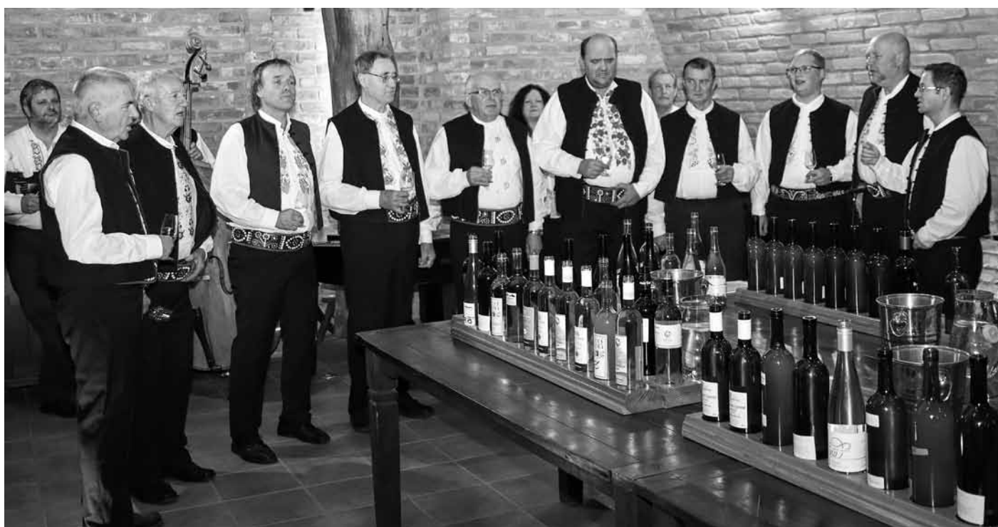
Slavnostní atmosféru umocnil zpěv velkopavlovických mužáků z Presúzního sboru.