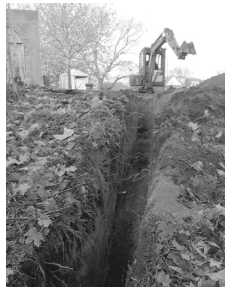
Výkop pro elektrické vedení – příprava před instalací sloupů pro osvětlení na hřišti za kostelem.

Hřiště za kostelem je využíváno dětmi v letním i v zimním období. A právě v zimě bývalo hřiště provizorně osvětlováno halogeny, aby se prodloužila doba, kdy je možné bruslit na ledové ploše. Zaregistrovány však byly od veřejnosti i připomínky, že by mohlo být osvětlené hřiště i ve dnech, kdy už je teplo a sluníčko zapadá ještě relativně brzy. Vznikl tak nápad zbudovat osvětlení na stožárech, které už bude u hřiště natrvalo.