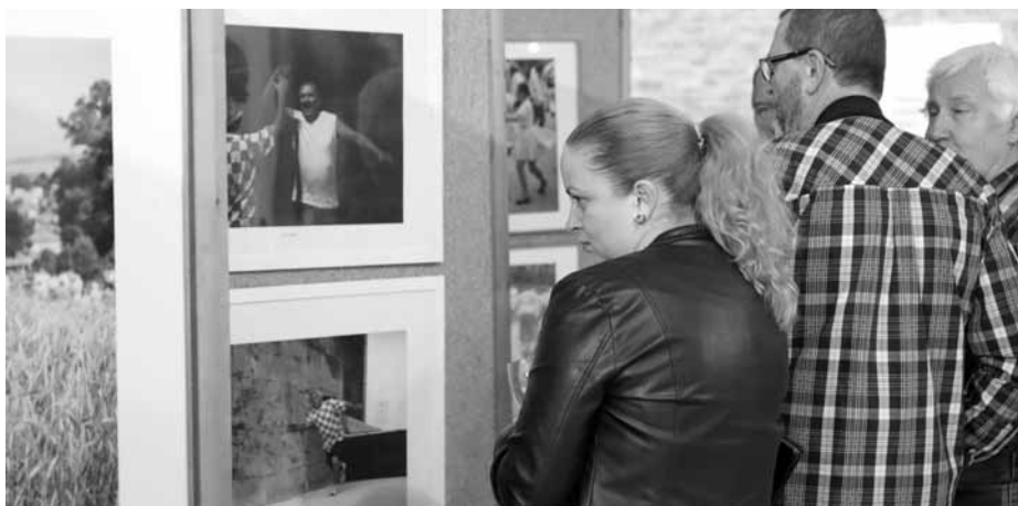
Skvělé snímky s příběhem návštěvníky vernisáže výstavy „Lidé v pohybu“ velmi zaujaly a líbily se.