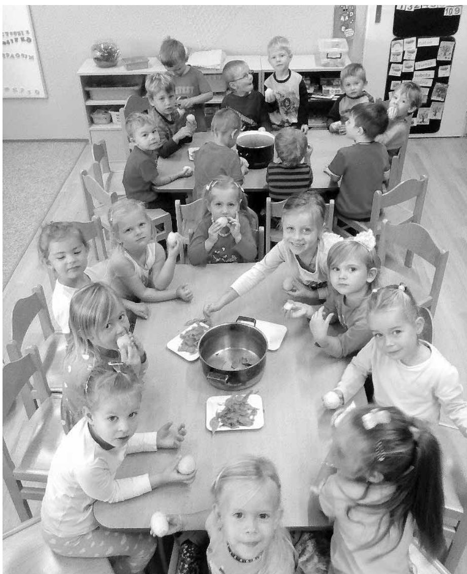
Děti se v mateřince učí spoustě praktických dovedností, třeba kterak oloupat vařené brambůrky. To bude maminka koukat, jakého má doma pomocníka!