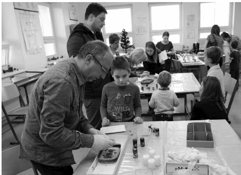
Vánoční Den otevřených dveří se na velkopavlovické základní škole nesl v duchu nadcházejících Vánoc.

I v letošním roce provázela Den otevřených dveří oslava výročí – tentokrát třicetiletého