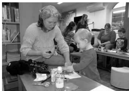
Pěkný obrázek si udělaly děti za pomoci svých šikovných a trpělivých maminek.