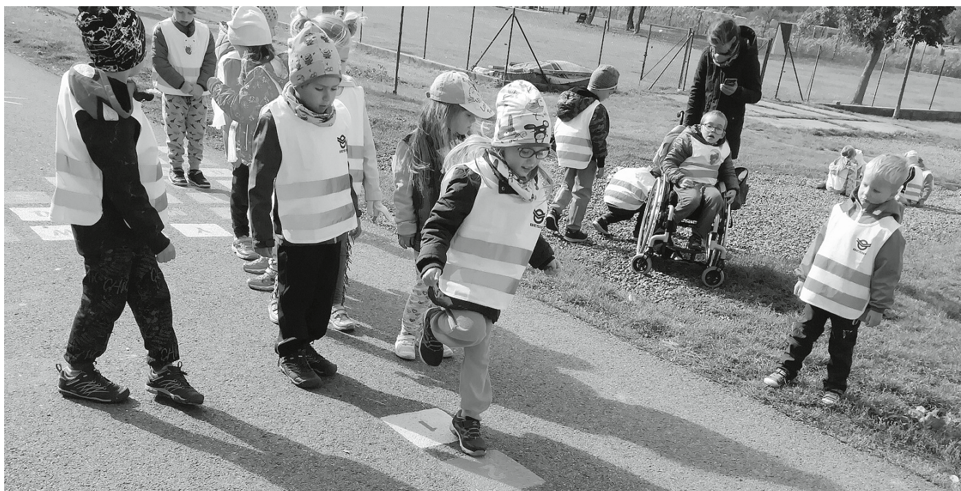
Jedna z nekonečné řady podzimních vycházek. Děti si chodí užívat nových pohybových her, které najdete na cyklostezce u skateparku.