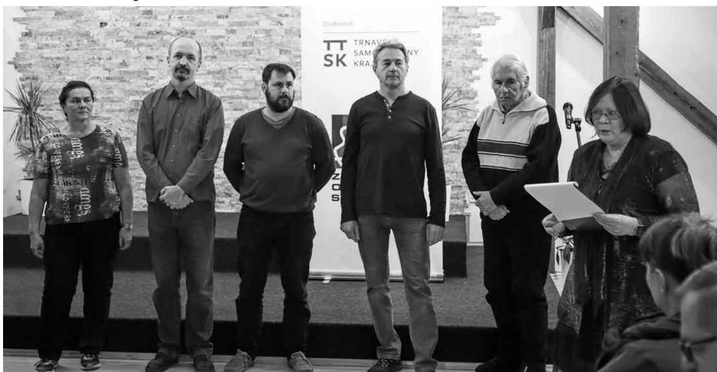
Fotografové, kteří se aktivně zúčastnili workshopu pod vedením profesionála Mgr. Petera Lančariče.