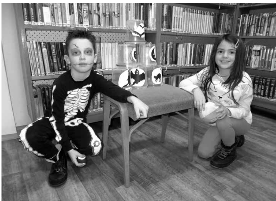
Knihovna se hemžila strašidelnými postavkami i jejich kamarády z řad civilistů.