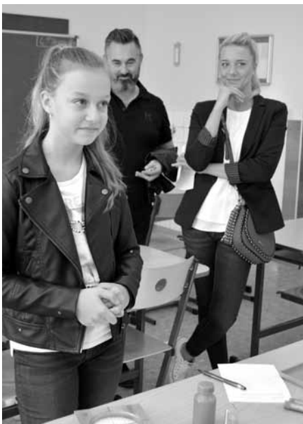
Na Den otevřených dveří dorazili nejen samotní zájemci o studium, ale i jejich rodiče.

Ve středu 6. listopadu 2019 se otevřely dveře Gymnázia Velké Pavlovice pro všechny zájemce o studium. Žáci přicházeli v doprovodu svých rodičů i dopoledne, protože měli ojedinělou příležitost nahlédnout do tříd během vyučování.