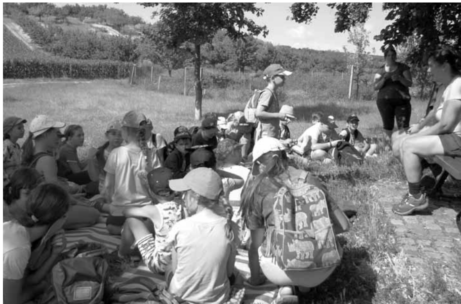
V rámci táborů na Ekocentru Trkmanka podnikají děti řadu krásných vycházek a výletů do okolí našeho města. Je tu pořád co objevovat...

Za dvě období realizace se příměstských táborů zúčastnilo neuvěřitelných 361 dětí, už druhé období byli z velké části podpořeni rodiče dětí navštěvujících Mateřskou školu ve Velkých Pavlovicích, ve které již druhým rokem v letních měsících probíhala rozsáhlá rekonstrukce.