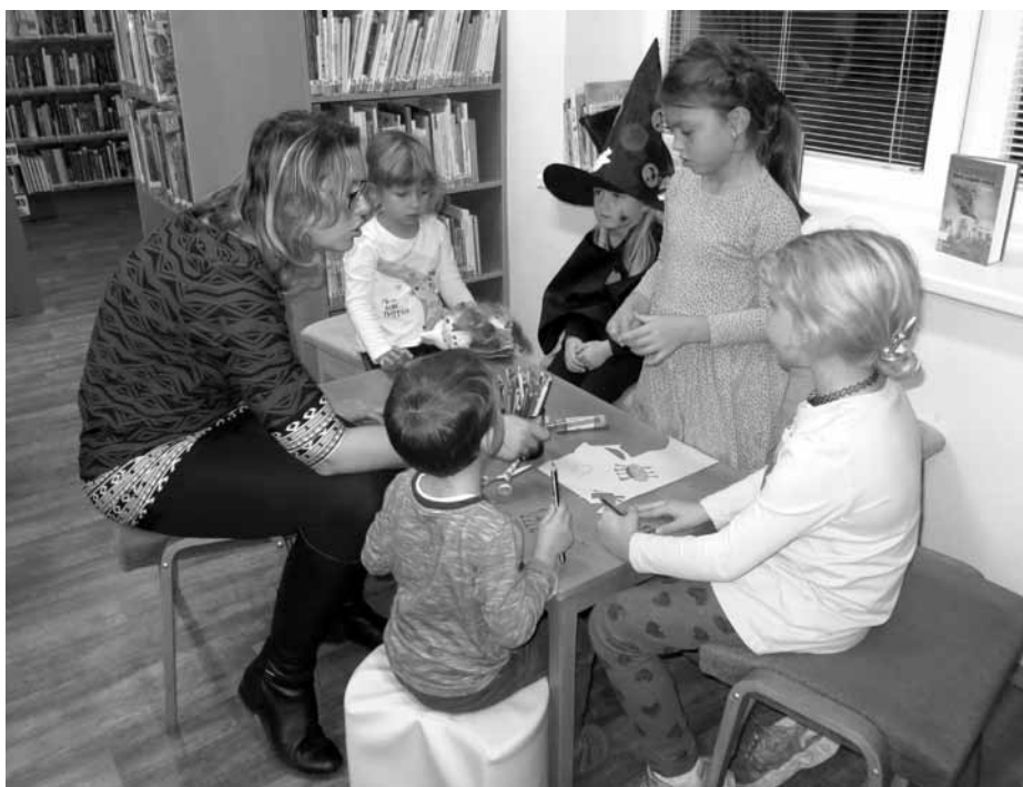
Žádná akce v knihovně, ani ta strašidlácká, se nikdy neobejde bez tvoření.