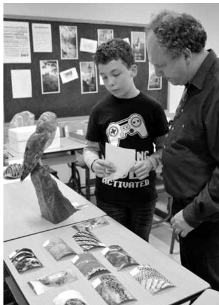
Zázraky přírody a předmět biologie velmi zaujal naše budoucí studenty, stejně také jejich dospělý doprovod.