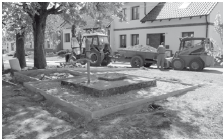
Ulice Bezručova – stavební úpravy v parčíku.

V parčíku na ulici Bezručova odstranili zaměstnanci služeb města v polovině letošního dubna staré lavičky, které měly betonové nohy usazené v zemi. Po opravě přístupového chodníku a výměně ztrouchnivělých desek na lavičkách byly lavičky opět vráceny na místo. Tímto počínem zde vzniklo příjemné zákoutí lákající, zejména v parném dni, k odpočinku ve stínu pod mohutnými kaštaný.