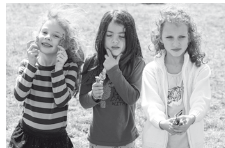
Oslavy Dne dětí se bez sladkostí prostě neobejdou. A tyto laskominy, věřte nevěřte, spadly přímo z nebe!