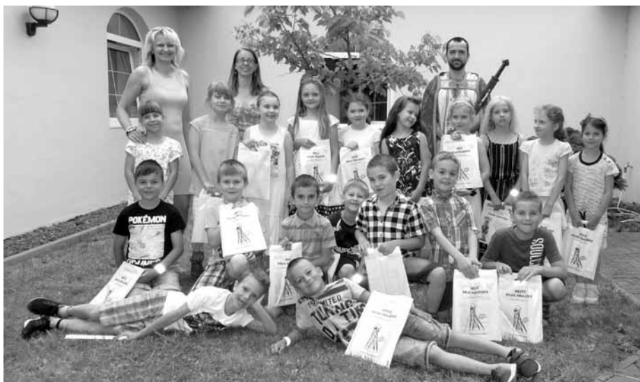
Novopečení čtenáři ze třídy 1.A.