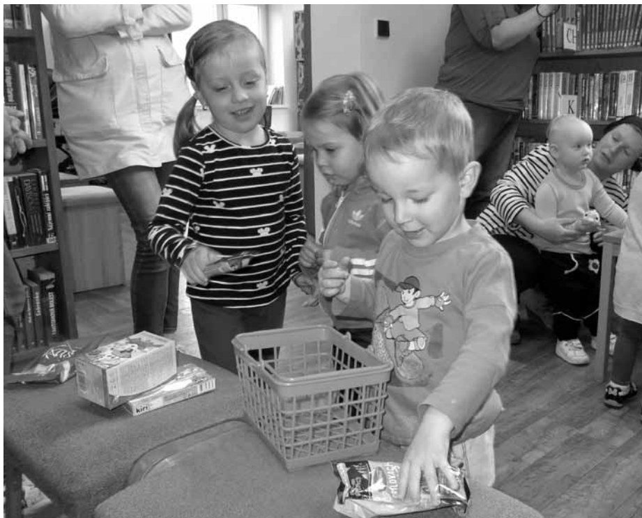
Děti se v knihovně naučily, kterak pomáhat maminkám. Třeba tím, že nakoupí.

V knihovně je totiž možné všechno, stejně jako v knihách. A tak děti mezi regály knih věšely ponožky, zametaly, krájely zeleninu a nakupovaly. A jejich mámy chvíli nedělaly VŮBEC NIC!