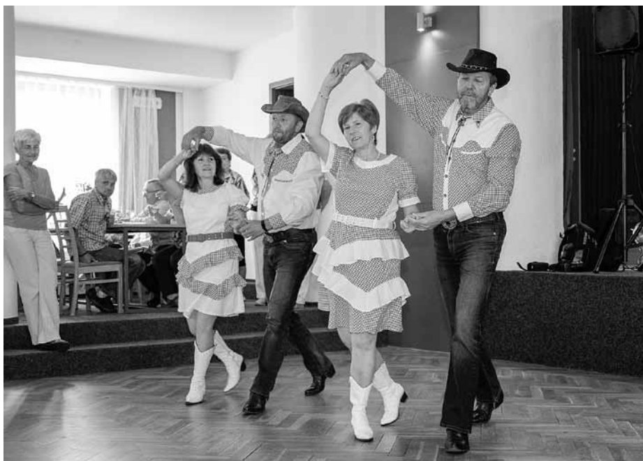
Hostům ze Ždírc nad Doubravou zatančila v rytmu country velkopavlovická Country jízda.