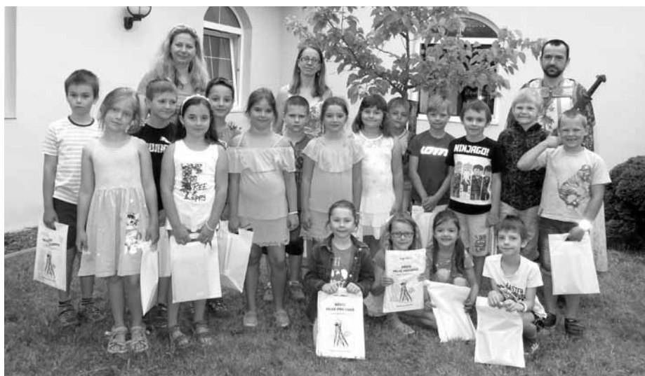
Novopečení čtenáři ze třídy 1.B.