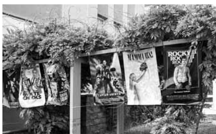
Plakáty zvoucí na filmové trháky – v hlavních rolích letošní maturanti!

Pokud jste také propadli kouzlu filmových plakátů a navíc jste byli zvědaví, kdo se koncem května potrápí nad maturitními otázkami za zdi velkopavlovického gymnázia, určitě jste si nenechali ujít příležitost shlédnout tablo letošních maturantů. Rok co rok se těšíme, s jakým nápadem aktuální maturanti přijdou a opět nezklamali. Z loňského lesa plného pestrobarevného dýmu přeskočili, co by hollywoodské hvězdy, na plakáty věhlasných filmových trháků. Neotřelý nápad, perfektní zpracování, skvělý zážitek!