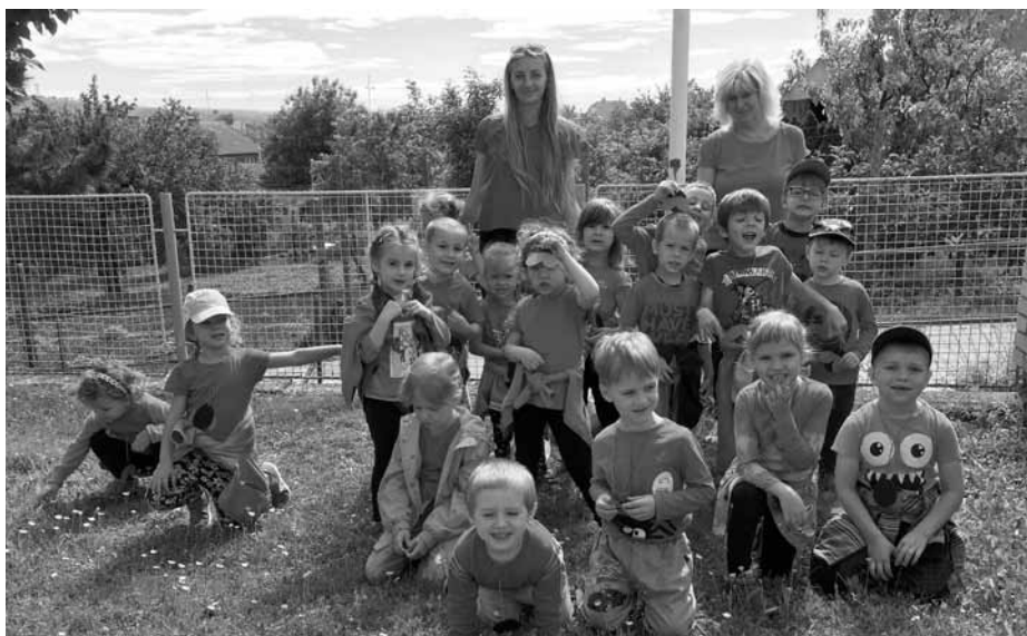
MDD ve třídě Berušky.