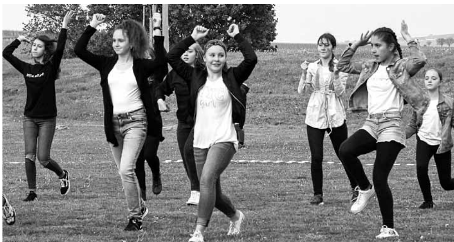
Pálení čarodějnic roku 2019 – taneční vystoupení v podání místních školaček.

Tak se kterými dámami se už nepotkáme? Jak to? O poslední dubnové noci přeci lehly popelem!