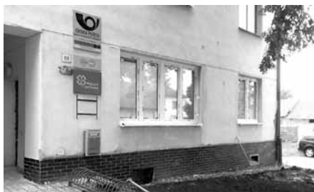
Výměna oken na pobočce České pošty, s.p. ve Velkých Pavlovicích.

V posledním pracovním týdnu měsíce května prošla velkopavlovická pobočka České pošty, s.p. rychlou částečnou rekonstrukcí. Ta spočívala ve výměně starých nevyhovujících oken za nová plastová a ve výměně dvou kusů dveří za kvalitní z hliníku. Okna a dveře vyrobila