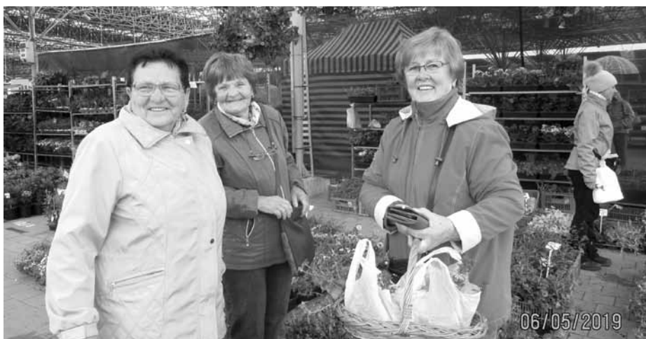
Návštěva výstavy Floria Kroměříž je vždy spojena s větrem v penězence. Nabídka je tak lákavá, kdo by všem těm barvám a vůním odolal!