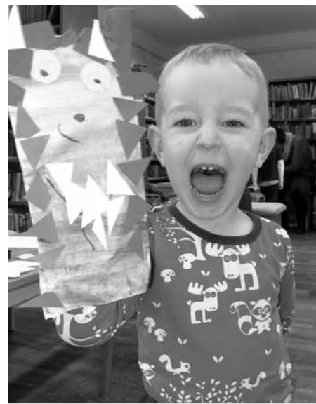
Být mezi knihami? To je prostě radost bez konce.