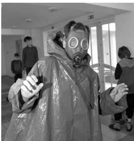
Nebyl by to pravý „braňák“ bez zkoušky plynové masky a oděni se do pláštěnky... Dříve narození – vzpomínáte?