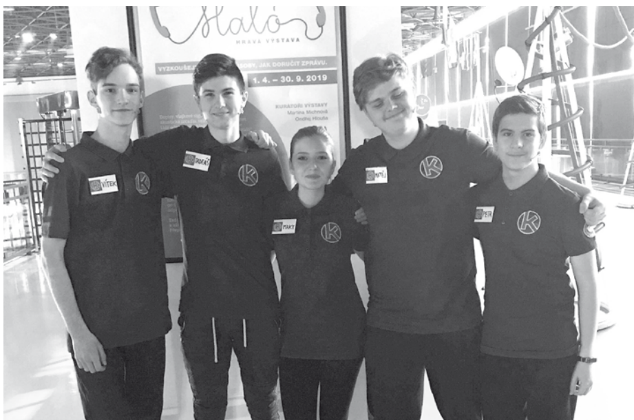
Velkopavlovický tým Kryptoni v pořadu České televize „Už tam budem?“ zazářil.

V úterý 9. dubna 2019 se žáci z devátých ročníků a z 8.A třídy ZŠ V. Pavlovice zúčastnili natáčení dalšího dílu nového dětského soutěžního pořadu České televize s názvem „Už tam budem?“ a to v prostorách VIDA centra v Brně.