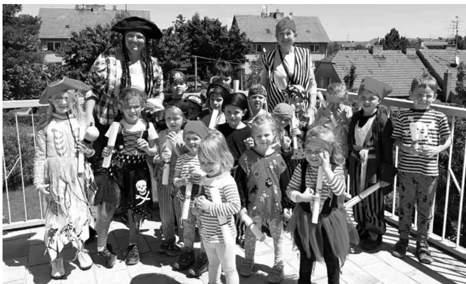
MDD ve třídě Koťáka.