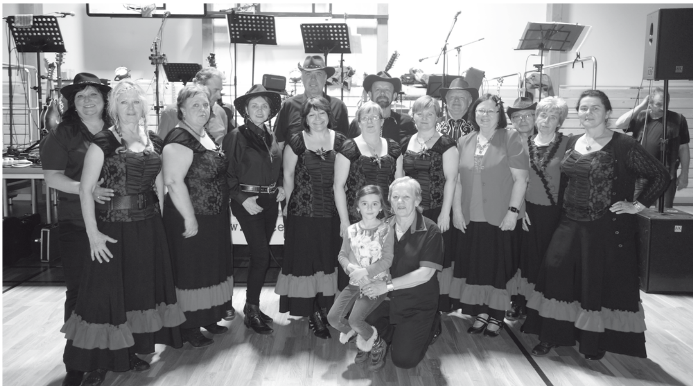
Přátelé country z Velkých Pavlovic na vystoupení v Jiříkovicích.