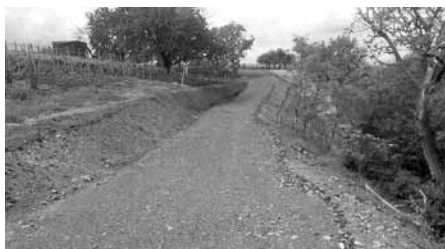
Opravená polní cesta ve Staré hoře.

Firma Stavba a údržba silnic, s.r.o. Břeclav provedla dle projektu úpravu polní cesty v extravilánu města Velké Pavlovice – ve vinařské trati Stará hora. Služby města Velké Pavlovice provedly nutné zajištění svahu.