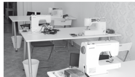
Naše stroje připraveny právě pro vás!

I ve Velkých Pavlovicích už kurzy šití probíhají. Pod vedením vynikajících krejčovských se s námi také můžete naučit šít. Naučte se s námi šít a buďte pyšní, že jste něco krásného dokázali vytvořit! Pochlubte se a užijte si krásný pocit z vlastnoručně ušitého modelu.