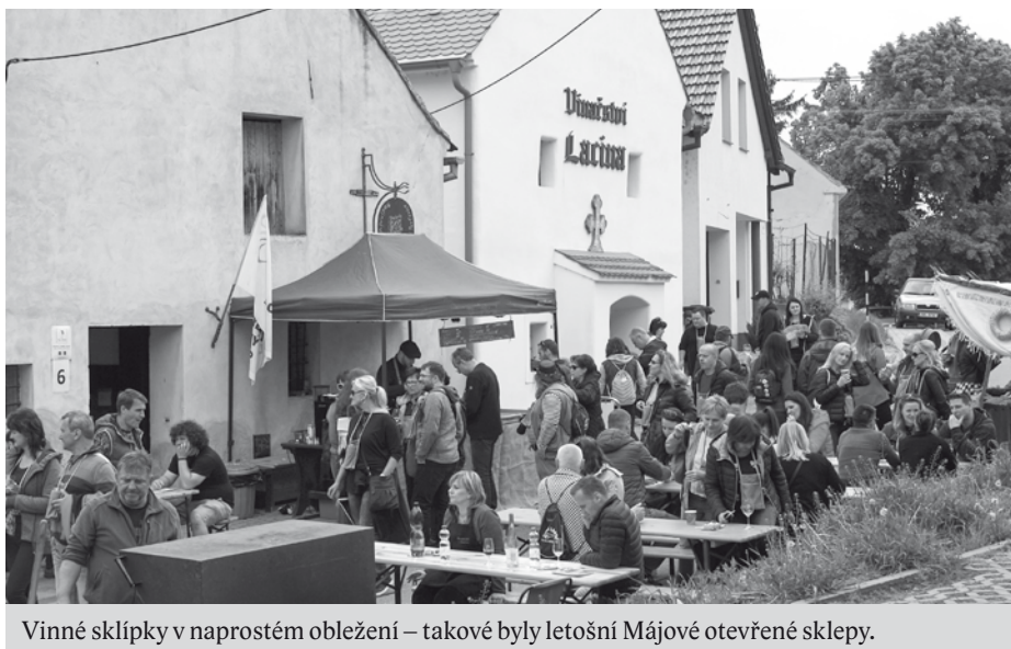
Vinné sklípky v naprostém obležení – takové byly letošní Májové otevřené sklepy.