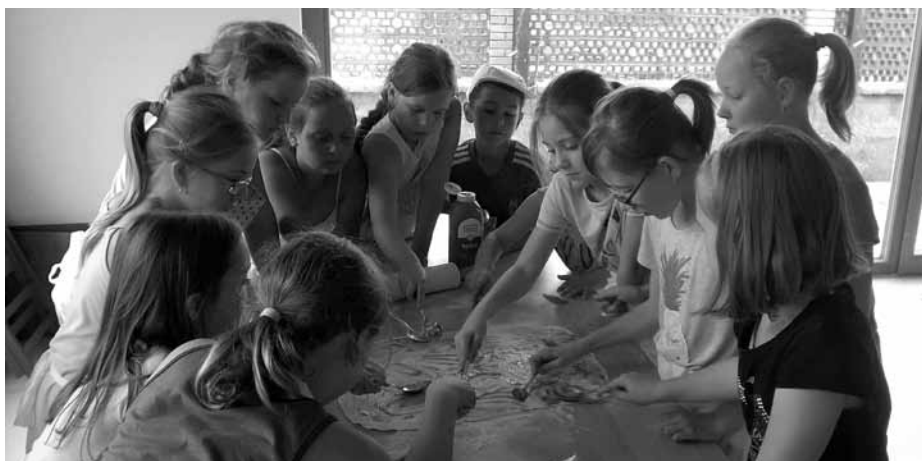
Tvoření vaření – na Trkmance je to vždycky prima!

Projekt CZ.03.2.65/0.0/0.0/16_047/00098 32 Příroda volá. Slyšíš ji? Příměstské tábory na Ekocentru Trkmanka, Operační program zaměstnanost, Výzvy MAS Hustopečsko – OPZ – Prorodinná opatření II. 566/03_16_047/CLLD_16_02_015