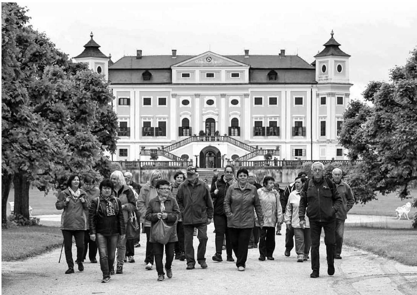
Příjemná vycházka po rozlehlých zahradách zámku v Miloticích.