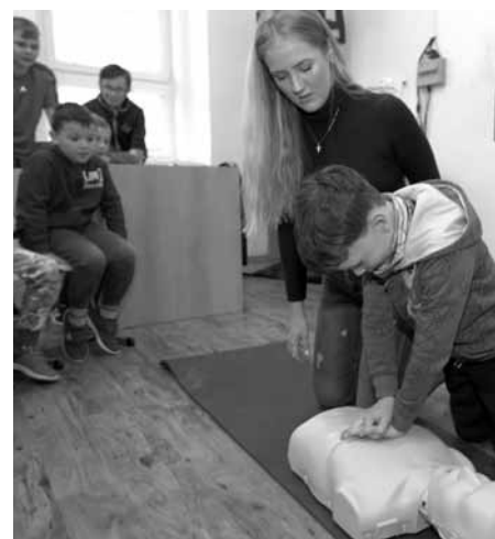
Umět dát první pomoc? K nezaplacení! Naši školáci to už umí.