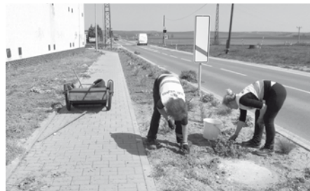
Ulice Hodonínská – úprava zahrádek na veřejných prostranstvích.

Poznaly to zaměstnankyně města, které se zhruba v polovině měsíce dubna daly do údržby veřejného prostranství v ulicích Brněnská