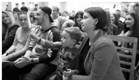
Každoroční hřeb Aprilesu – dražba. Výtěžek putoval potřebným.

Stalo se již tradicí, že studenti velkopavlovického gymnázia každoročně pořádají charitativní akci Apriles . Letošní již osmý ročník se podařilo zorganizovat studentům sexty a 2.A. Akce proběhla v pátek 12. dubna 2019 v místní sokolovně a její výtěžek byl