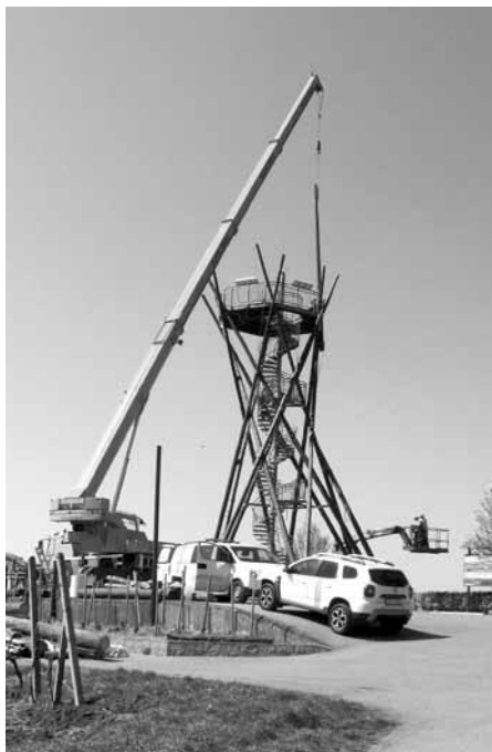
Rozhledna Slunečná během opravy – k výměně kúlů bylo zapotřebí těžké techniky.

Pracovníci společnosti Teplotechna Ostrava, a.s. v poslední dekádě měsíce května 2019 dokončili výměnu dřevěných holovin na rozhledně Slunečná. Vyměnit pár smrkových kúlů, to se zdá být jednoduchá záležitost, ale jaký byl vlastně postup a co všechno bylo potřeba udělat?