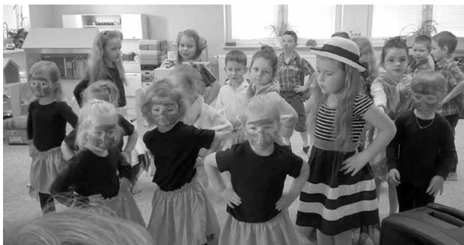
Sluníčka a jejich Cesta kolem světa .

V úterý dne 11. června 2019 se otevřely dveře mateřské školy místním dříve narozeným občanům. Děti ze dvou tříd – Sluníček a Kuřátek pozvaly totiž všechny babičky a dědečky (nejen ty své) na pilně nacvičené představení.