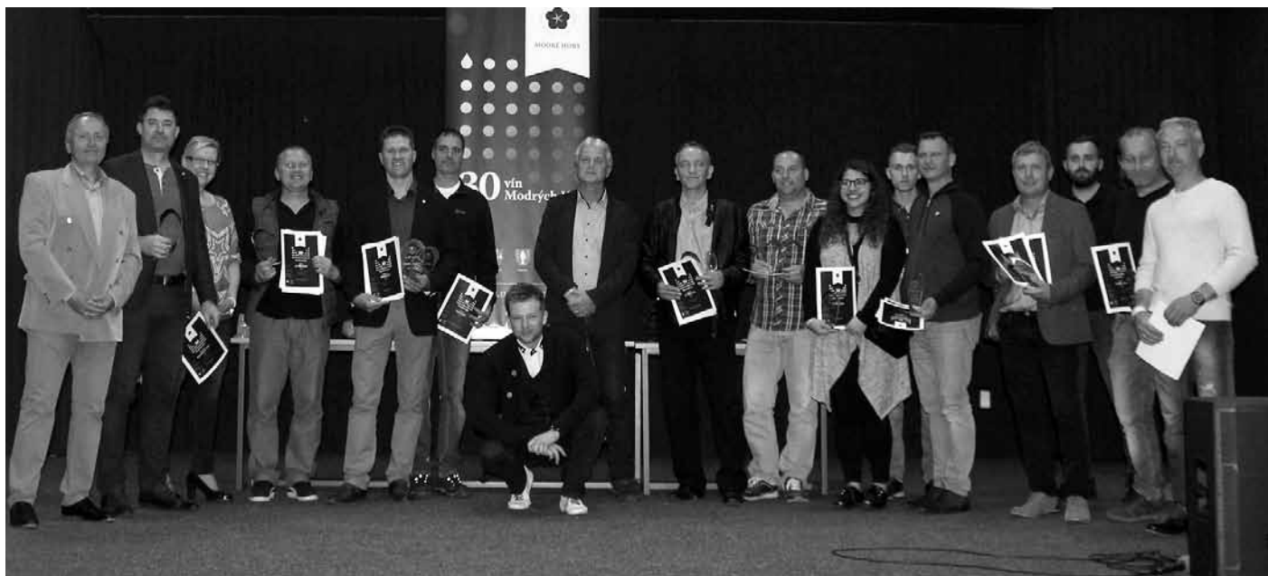
Půlkulatý již V. ročník výstavy 30 vín Modrých Hor – slavnostní vyhlášení oceněných vinařství.

Poslední dubnová sobota s datem 27. 4. 2019 byla již popáté vyhrazena ryze modrohorským vínům, která se veřejnosti představila v dalším ročníku prestižní výstavy vín s názvem 30 vín Modrých Hor ve velkopavlovické sokolovně. V letošním ročníku se utkalo 189 vín, z toho bílých 114, červených 61 a rosé 14, výhradně z pětice obcí mikroregionu Modré Hory.