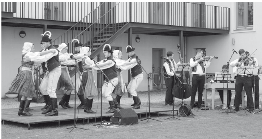
Na Modrohorském zpívání vystoupil jako host folklórní soubor Pohárek z Týnce, zatančil za doprovodu velkopavlovické cimbálové muziky Lašár.

Čtvrtá májová sobota s datem 25. května 2019 patřila modrohorským mužáckým sborům, které se sešly tentokrát na nádvoří Ekocentra Trkmanka ve Velkých Pavlovicích.