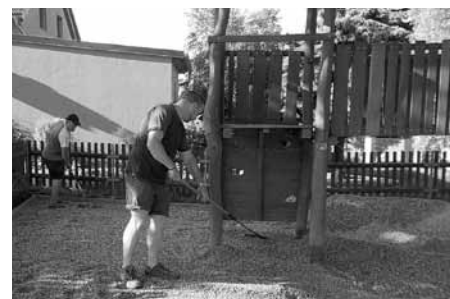
Dětské hřiště za kostelem – instalace nového povrchu.

Pracovníci stavební skupiny služeb města se na přelomu měsíců května a června věnovali rekonstrukci povrchu dětského hřiště za kostelem. V prvotní fázi byla z celé hrací plochy odebrána zemina, poté následovala fáze přípravy terénu pro položení nového povrchu. Nakonec byl starý nevyhovující travnatý povrch nahrazen dnes tolik populárními drobnými říčními oblázky – kamínky ze sousedního Slovenska. Dopadové plochy jsou tak nyní bezpečnější.