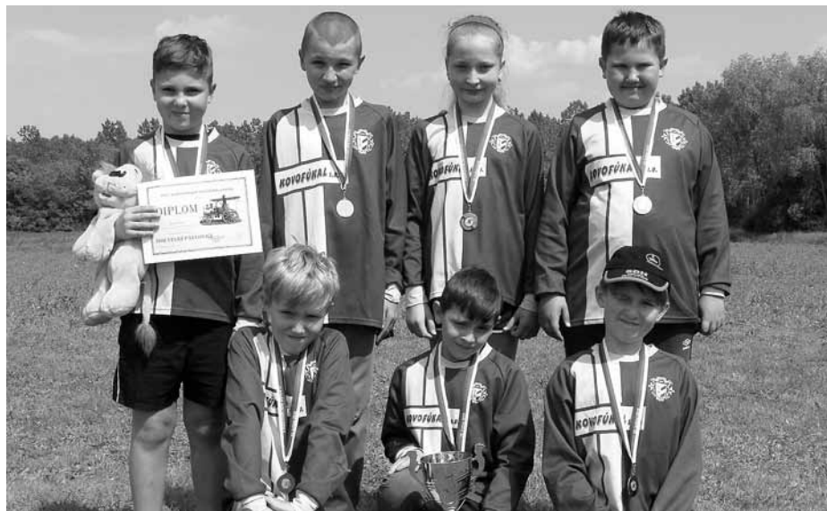
Mladší družstvo našich mladých hasičů vybojovalo druhé místo v Novosedlech.