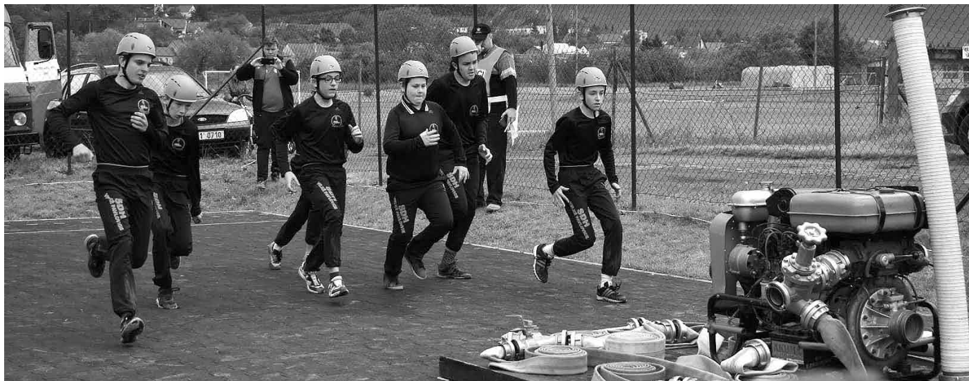
Velkopavlovičtí mladí hasiči na soutěži v požárním útoku v Kobyli.