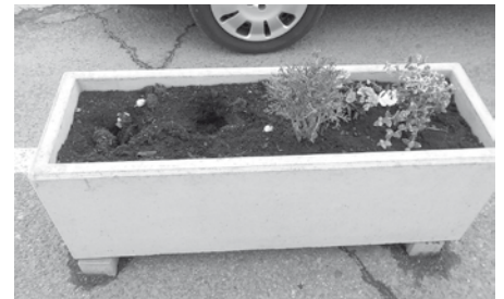
Krásná květinová výzdoba na autobusovém nádraží po ataku zlodějů. Líbí?

Ve čtvrtek 25. dubna 2019 byly osázeny betonové truhlíky na autobusovém nádraží. A byl to krásný pohled. Bohužel, výsadba nevydržela bez poškození ani první víkend. Přestože od návštěvníků denně slyšíme, jak je naše město hezké a upravené, stále se najdou tací, kterým se to nelíbí, anebo naopak, líbí natolik, že chtějí mít doma to samé, ale ZADARMO. Pravděpodobně právě do této skupiny patří osoba, která o víkendu z truhlíků spoustu čerstvě vysazených rostlin pokradla. Je velmi smutné, že se i v dnešní době v ulicích našeho městečka tak často setkáváme s našimi spoluobčany, kteří jsou bohužel stále schopni dopouštět se krádeží a vandalství, ať už se jedná o soukromý majetek či veřejná prostranství!