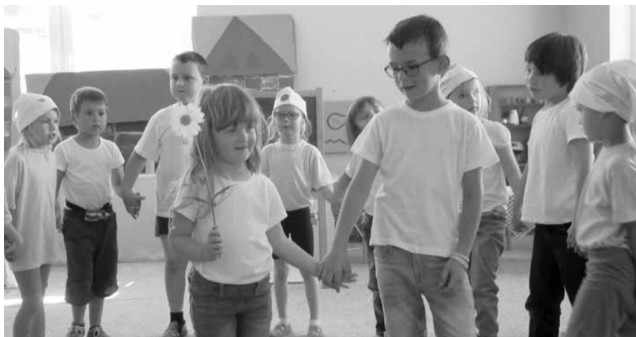
Kuřátka a jejich divadelní zpracování proslulé dětské filmové komedie Ať žijí duchové .