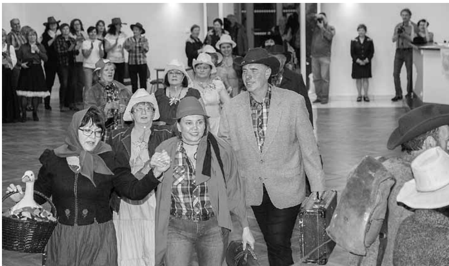
Tanečníci country ve víru tance!

V dubnu jsme téměř nestihali účast na všech konaných akcích, nedali jsme si však ujit country bál se skupinou Mlha Revival, který pořádali břeclavští železničáři 27. dubna. Dokonale do sálu společenského domu zapadlo naše nové vystoupení „Oranžový expres“, nádražáky jsme opravdu příjemně překvapili.