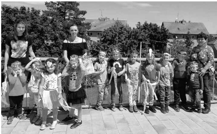
MDD ve třídě Sluníčka.

Nejoblíbenější letní kratochvíle, které se vždycky nemůžou všichni školkařiči dočkat – koupání v bazénku na zahradě.