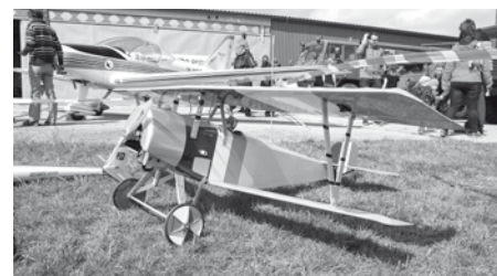
Co by to byl za letecký den bez letadel? Opravdových i jejich věrných zmenšených kopií.