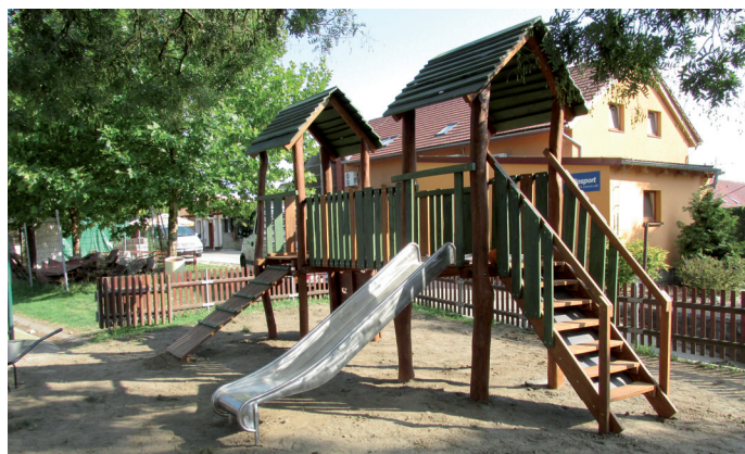
Nový herní prvek na dětském hřišti za kostelem