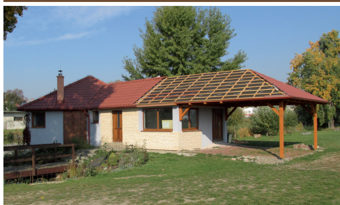
Rybářská bašta u rybníka na ulici Nádražní – stavba přístřešku