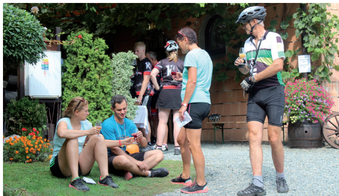
PUTOVÁNÍ ZA BURČÁKEM PO MODRÝCH HORÁCH * XI. ročník