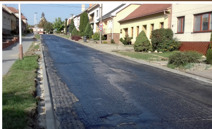
Zahájení asfaltování vozovky na ulici Dlouhá