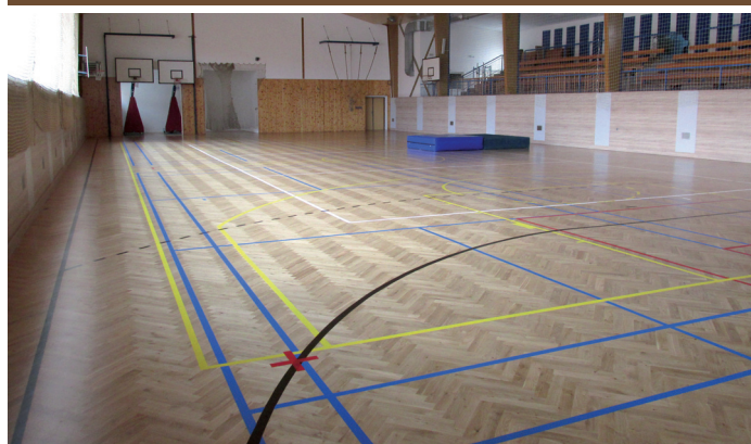
Sportovní hala při Základní škole Velké Pavlovice po opravě, otevřena byla 1. října 2018