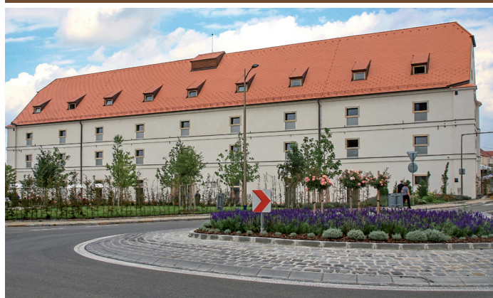
Kruhový objezd na křižovatce u Hotelu Lotrinský vypadá jako malá krásná zahrádka