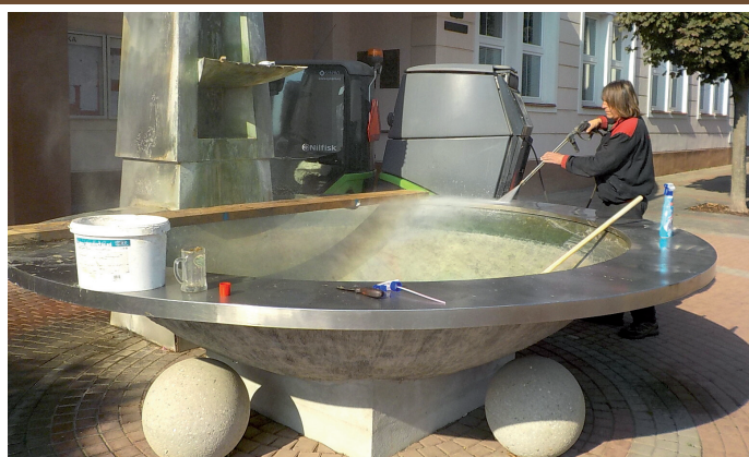
Podzimní čištění kašny před radnicí města