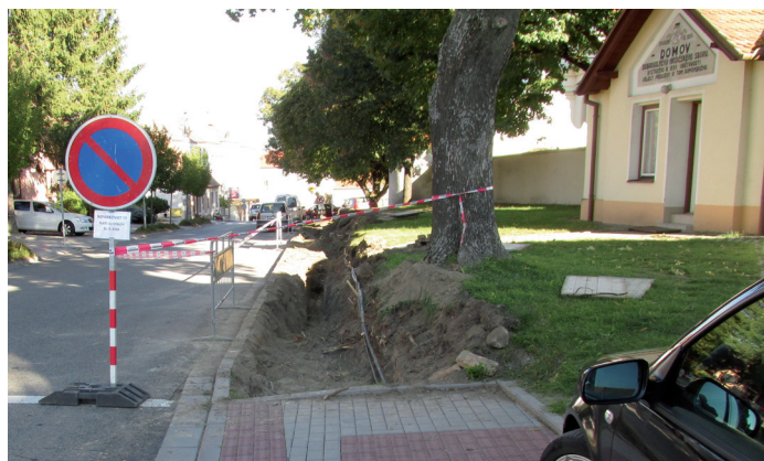
Výstavba nové parkovací plochy mezi hasičskou zbrojnicí a kostelem