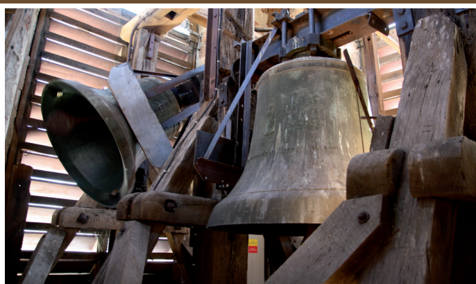
Zvony ve věži velkopavlovického kostela, která prošla náročnou opravou