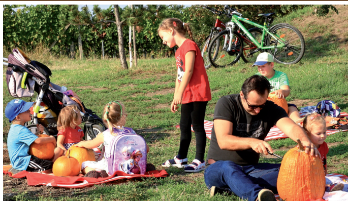
VESELÉ DÝŇOBRANÍ POD ROZHLEDNOU SLUNEČNÁ * VIII. ročník