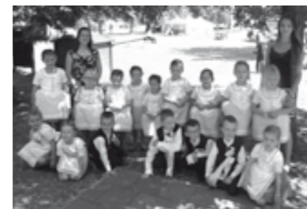
Sadováček – folklórní soubor při Mateřské škole Velké Pavlovice.

O víkendu 10. a 11. června 2017 se v nedalekém Krumvíři konal jubilejní XXX. ročník folklórního festivalu KRAJ BEZE STÍNU. Po dlouhých letech na něm vystoupily hned dva velkopavlovické folklórní soubory.