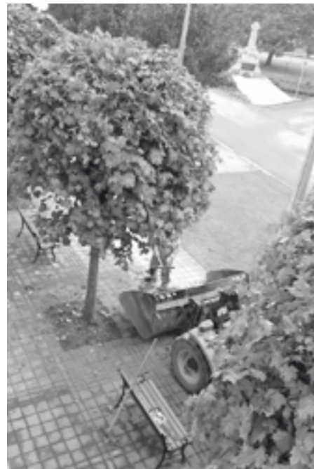
Ořez větví a tvarování korun stromů před radnicí města.

Vytrvalé deště, které nás provázely prvními dny měsíce května, komplikovaly pracovníkům služeb města průběžnou údržbu městské zeleně. Ta se díky vydatné zálivce nekontrolovatelně rozbujela, a právě kvůli dešti nebylo mnohdy vůbec možné provádět pravidelně