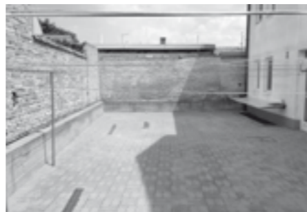
Nová dlažba na dvorku bytového domu na ul. B. Němcové.

V pátek dne 9. června 2017 byly zahájeny