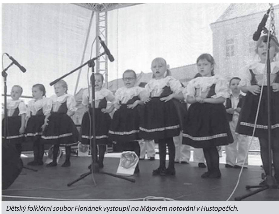
Dětský folklórní soubor Floriánek vystoupil na Májovém notování v Hustopečích.