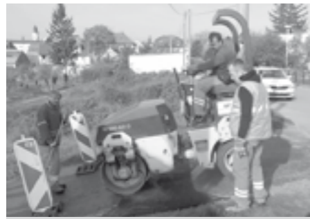
Oprava vozovky na ulici Pod Břehy.

ku živichého povrchu u sjezdu do garáží, dále bylo zapraveno autobusové nádraží, překop v ulici Za Dvorem a v ulici Horňanského.