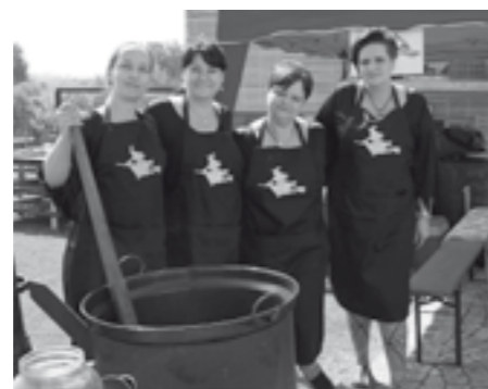
Na letošním Gulášfestu vařily i čarodějnice – sličné členky místního týmu!