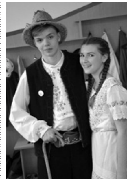
Bludiště - kdo nesoutěžil, reprezentoval jih Moravy, jak jinak než v krojích!