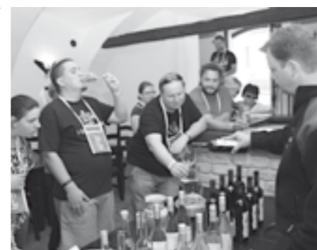
Velkopavlovické víno je dobrou a vyhledávanou značkou. Letošní ve svezích praskající Májové otevřené sklepy toho byly jednoznačným důkazem.