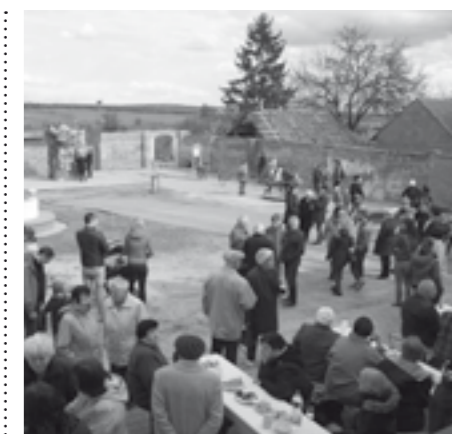
Fara ožívá... Díky „Oranžovému hřišti“ je tu dnes a denně slyšet dětský smích a radostné výskání.

Bohužel nejsou všechny práce ještě dokončeny, tak kdo má zdravé ruce a chuť, může se do oprav na naší faře ještě zapojit. O termínech prací a brigád se můžete dočíst na stránkách farnosti www.ozvi.se nebo přímo kontaktovat otce Slatinského.