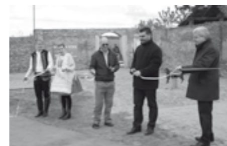
Slavností přestřihnutí pásky – symbolický akt otevírající nové hřiště na farním dvorku.

Pokud máte zájem toto nově otevřené hřiště