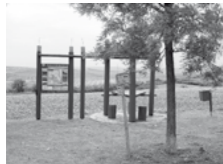
Naučná stezka Zastavení v kraji vína a merunek – posečené prostranství u odpočívky „U Jerlínů“.

Jarní a letní měsíce roku jsou pro zahradnickou skupinu pracovníků služeb města synonymem sečení travnatých ploch, nejen v intravilánu města, ale i jeho extravilánu. V květnu byla věnována zvýšená pozornost úpravě prostranství kolem trasy naučné stezky Zastavení v kraji vína merunek a cyklostezek Krajem André a Modré Hory. Péči neunikly ani odpočívky.