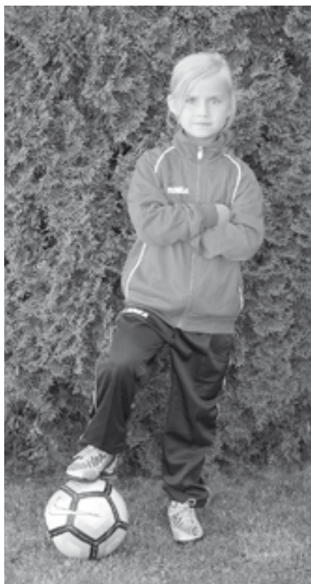
Fotbal není sportem jen pro kluky. Holky, jdeme na to!

téměř 140 dětí. Vyšlo nám neskutečně počasí a na hlavním hřišti zalitým sluncem byl opravdu šrumeček!