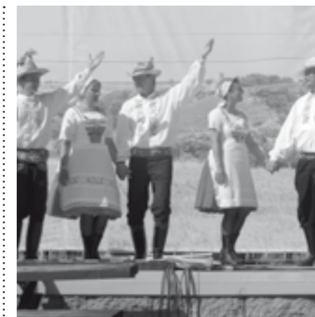
Hanákoslovácký krúžek zazářil na krumvířském festivalu Kraj beze stínu.