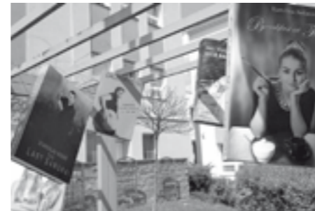
Studenti 4.A pojali své tablo jako knižní přebaly skutečných literárních děl, která charakterizují jejich záliby a vlastnosti. Bronz v soutěži je důkazem, že byl jejich nápad vskutku originální.

Velkopavlovické gymnázium, konkrétně maturitní třída 4.A, bodovalo! Se svým originálním tablem dosáhlo na bronzovou příčku v soutěži o nejlepší maturitní tablo v České republice. Soutěže, ve které bylo možné hlasovat prostřednictvím webového portálu www.maturitnitable.cz během celého měsíce května, se zúčastnily obě letošní maturitní třídy Gymnázia Velké Pavlovice, tedy Oktáva a 4.A. Úspěšnější byla v tomto klání se svým originálním tablem třída 4.A, které se v ohromné celorepublikové konkurenci podařilo umístit na třetí příčku a získat tak velmi atraktivní cenu. Tou je finanční příspěvek na maturiták 2.000 Kč od partnera soutěže Slovácké léto, fotokniha tabla od společnosti ZetSet, 50% sleva na produkty aplikace ZetSet pro celou třídu a Red Bull Energy Drink. Studentům maturitní třídy 4.A Gymnázia Velké Pavlovice posíláme gratulace a přejeme, aby si zasloužené ceny patřičně užili!