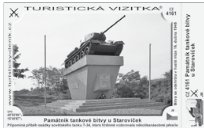
Památník tankové bitvy u Staroviček

blížejších místech v okolí našeho města, kde se nacházejí rozhledny a třech místech, kde sice rozhledna není, ale i tak je zde úžasný výhled