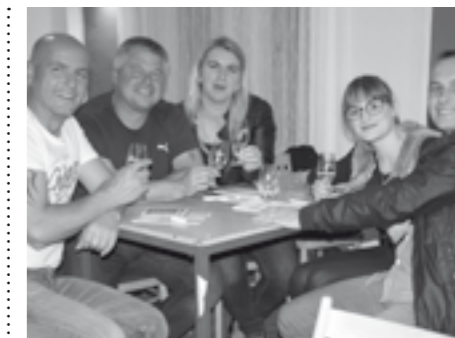
Víno z Modrých Hor je navzdory velmi krátké době své existence pojmem a dobrou značkou. Recept na raketový vzestup je jednoduchý, prostě chutná!