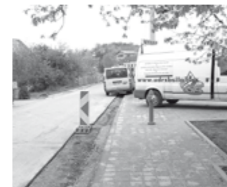
Ulice Pod Břehy – práce na pokládce nového asfaltového povrchu.

Ve druhé polovině měsíce dubna dokončili pracovníci stavební skupiny služeb města práce na ulici Pod Břehy, kde bylo vybudováno několik dlouho žádaných parkovacích míst, nový úsek chodníku a ve finále byl podél gará-