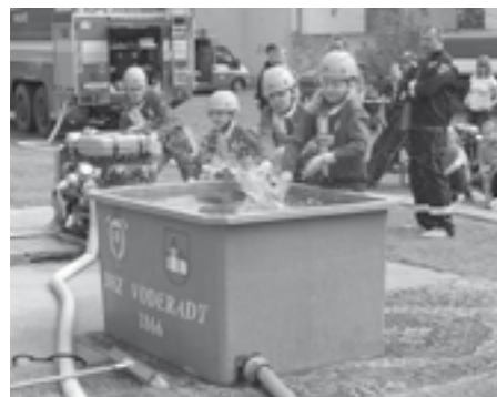
Mladí hasiči na první letošní soutěži v požárním útoku ve slovenských Voderadech.

V sobotu 6. května 2017 se mladí hasiči vydali na svou první letošní soutěž do slovenských Voderad. V krásném počasí se našim mladým hasičům podařilo vybojovat skvělé 5. místo. O den později v neděli ve Cvrčovicích se našim mladým hasičům podařilo získat první letošní medaili. S časem 20,97 s obsadili úžasné 2. místo. Další soutěže v požárním útoku se konaly o týden později. V sobotu 13. května 2017 se všechny sportovní týmy velkopavlovických hasičů zúčastnily soutěže v Drnholci. Míse to byla velmi úspěšná. „A“ tým skončil na druhém místě a „B“ tým na své vůbec první soutěži skončil těsně za stupni vítězů na místě čtvrtém. Následující neděle patřila hasičskému potěru. Na programu dne byla soutěž