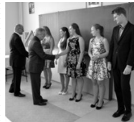
Gratulace k pěkným výsledkům maturity spojené s velkou úlevou a radostí.

sexty a 2. ročníku, je psaní ročníkové seminární práce. Myšlenka psaní této práce vychází z podnětů našich absolventů, studentů vysokých škol, kteří nám říkali, že měli omezenou příležitost seznámit se s přípravou formální a obsahové části seminární práce. Proto jsme