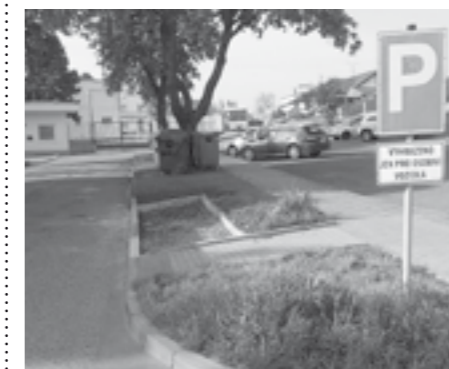
Nová stání pro kontejnery na třídě odpad na ulici Tovární.

V letošním roce pokračovali pracovníci služeb města v budování stání pro kontejnery na tří-