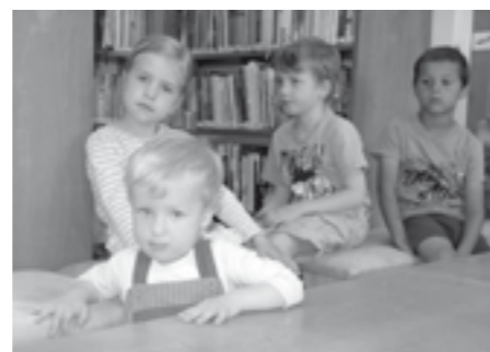
Tradiční oslava Dne dětí v knihovně, letos na téma Jaro a léto v přírodě.

Pokud máte zájem o fotky z jednotlivých aktivit, jsou všechny umístěny na webu města Velké Pavlovice, ve slozce „Městská knihovna“.