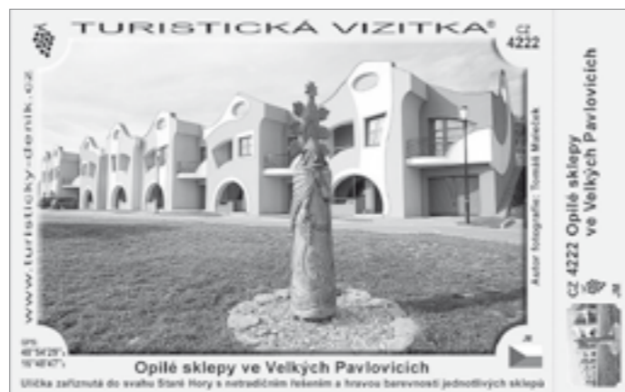
Opilé sklepy ve Velkých Pavlovicích