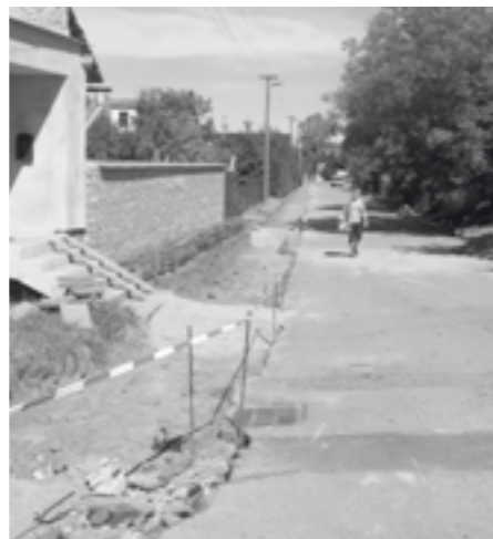
Oprava chodníku v „Báلكově uličce“.

práce na dokončení rekonstrukce chodníku v „Báلكově uličce“. Hotovo bylo přesně za týden. Po dobu opravy byla tato ulička uzavřena, což znepráhnilo řidičům motorových vozidel pohyb po městě. Dodatečně děkujeme za respektování uzavírky.