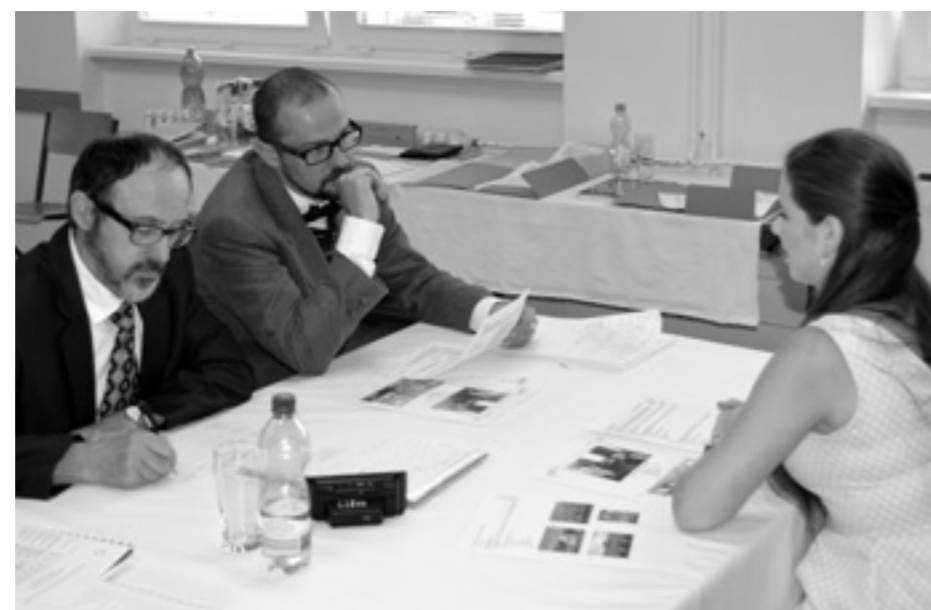
Maturita – zkouška dospělosti. Velkopavlovičtí gymnazisté ji i letos úspěšně zvládli.