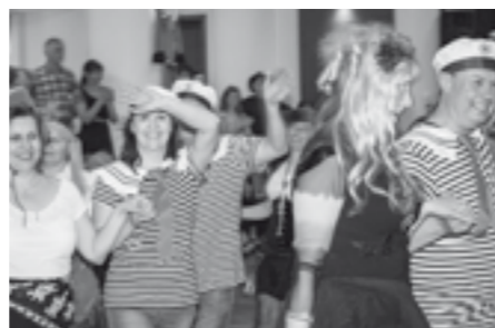
Vystoupení velkopavlovických Přátel country na 3. country bále. Tentokrát vyměnili westernové kostýmy za námořnické a pirátské mundúry. Moc jim to slušelo, co říkáte?