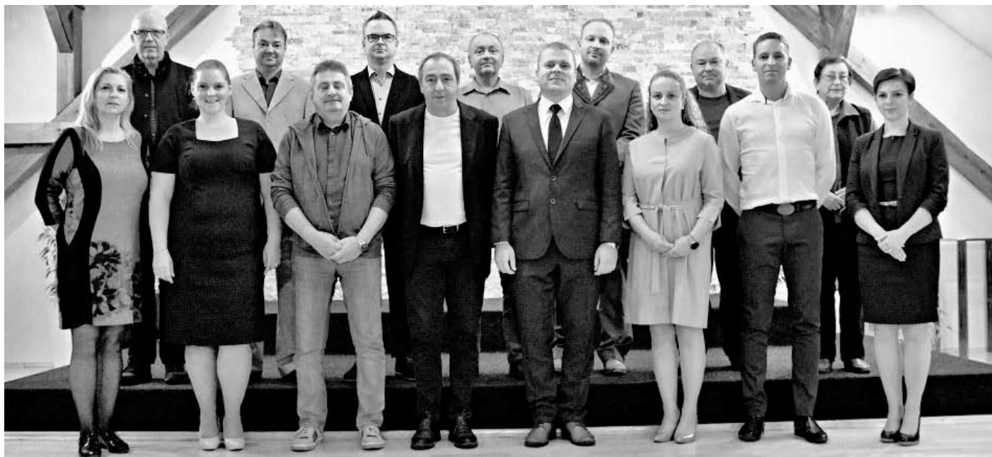
Noví členové zastupitelstva města Velké Pavlovice pro volební období 2022 - 2026.